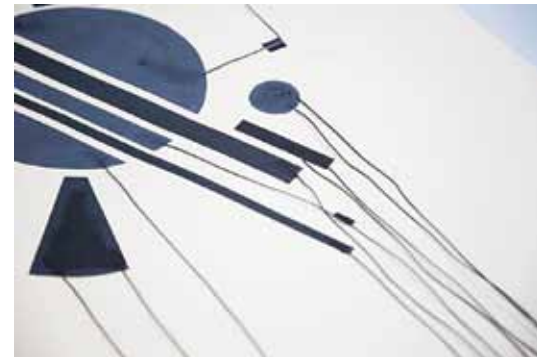
Kristas pagājušā gada darbs – grafiska kompozīcija, kurā uz papīra uzklātā krāsa ir pieslēgta vadiem. Kad tai pieskaras, rodas skaņas signāli.

Lāsma Reimane Kristas Masaļskas arhīva foto