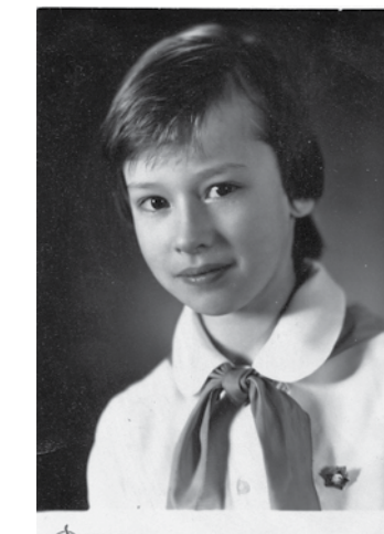
1980. gadā kā skolēnu komitejas locekle Kuldīgas 3. vidusskolā.