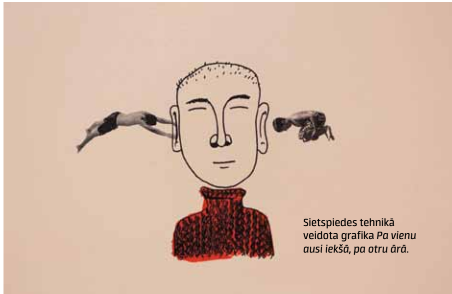
Sietspiedes tehnikā veidota grafika Pa vienu ausi iekšā, pa otru ārā .

gleznošanu, nedaudz grafisko dizainu, mākslas vēsturi. Mācību programma dod tehniskās zināšanas, lai students savā mākslas darbā prastu lietot dažādus līdzekļus. Mācības notiek vairāk sarunu veidā, nevis tā, ka studenti klausās pasniedzēja lasījumu. Diskutējam ar pasniedzēju, rādām darbus, izdarām secinājumus – ir individuāla pieeja.” Pasniedzēji piedalās izstādēs, seko līdzi jaunumiem pasaulē, un arī studentiem tiek dota iespēja parādīt savus darbus. „Interesantākais bija interaktīvo tehnoloģiju programmēšana. Pagājušajā gadā uztaisīju zīmējumu – grafisku kompozīciju, kur uz papīra uzklātā krāsa ir pieslēgta vadiem. Kad tai pieskaras ar roku, rodas skaņas signāli. Šis darbs labi attēlo to, cik dažādā tehnikā strādājam.”