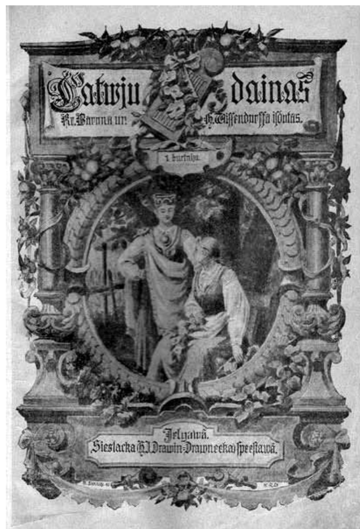
Rihards Zariņš. Titullapa Latvju dainu izdevumam. 1894. g.