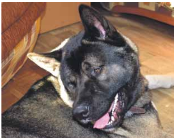
Amerikāņu akitas Latvijā vēl ir retums, un mūsupusē Rodžers varētu būt vienīgais savas šķirnes pārstāvis.