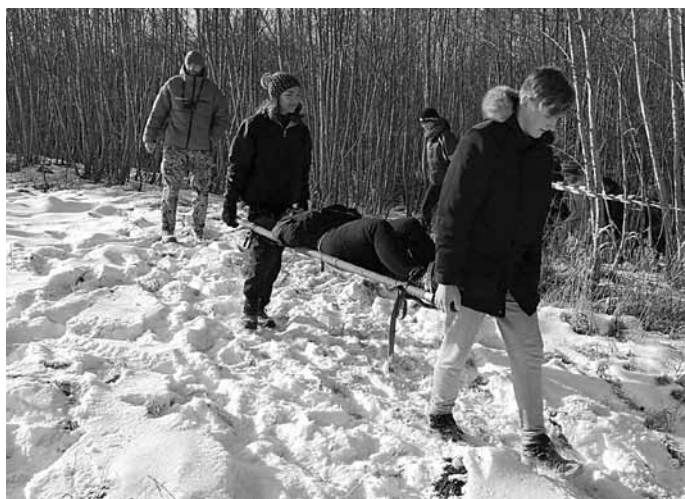
Ir arī kritušie – par laimi, tā tikai improvizācija, tomēr jauniešos rosinātas pārdomas par karavīru varonību valsts atbrīvošanas cīņās.