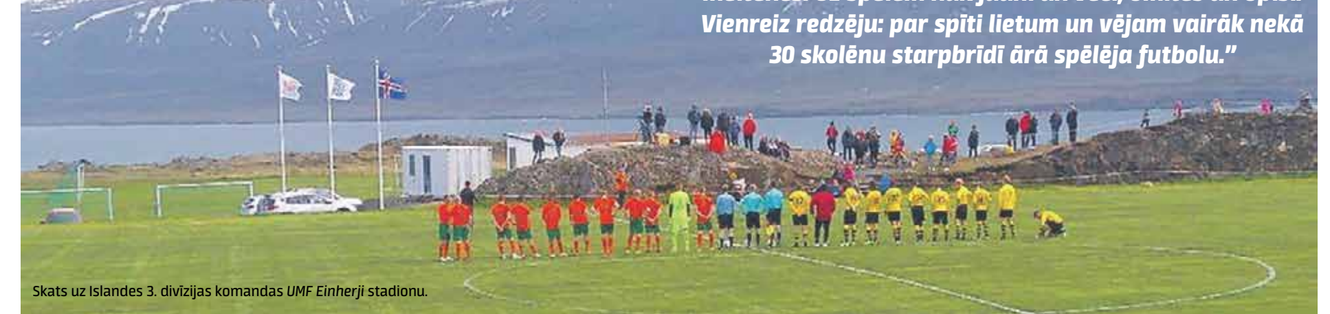
Skats uz Islandes 3. divīzijas komandas UMF Einherji stadionu.

„Vārtsargiem Islandē dzīve ir grūta, jo pūš spēcīgs vējš, mainot bumbas lidojumu. Neko darīt – jāpierod.”