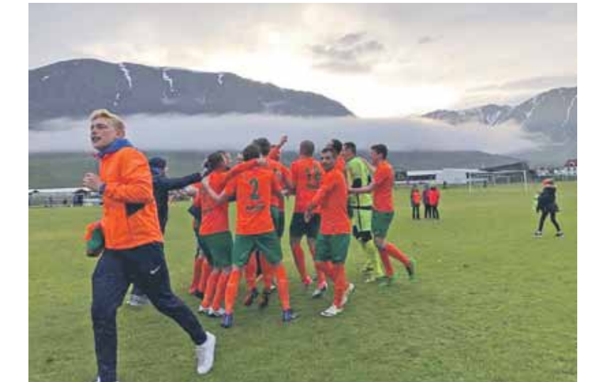
Kopā ar komandas biedriem prieks par uzvaru.