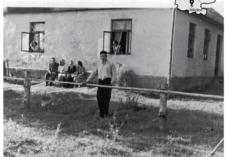
Mežgaļi 1940. gadā. Vēlāk kara laikā tur pagrabā slēpās Maku un Šopu ģimene.

vēta elektrostacija. Tēvam nebija skolotāja izglītības, un viņš aizgāja strādāt par elektriķi. Mammu 1949. gada februārī norīkoja strādāt par skolotāju Rudbāržos, bet skolotāju N. Baltiņu atsūtīja uz Nīkrāci, un viņa kādu laiku bija direktore Božes vietā.