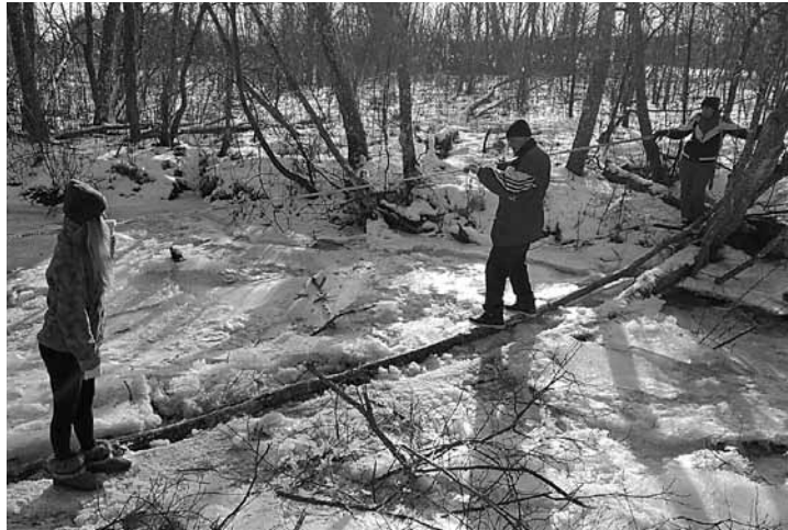
Gandrīz kā Latvijas brīvības cīņās 1919. gadā tiek forsēta upe, bet šoreiz tā ir Koja, nevis Venta.