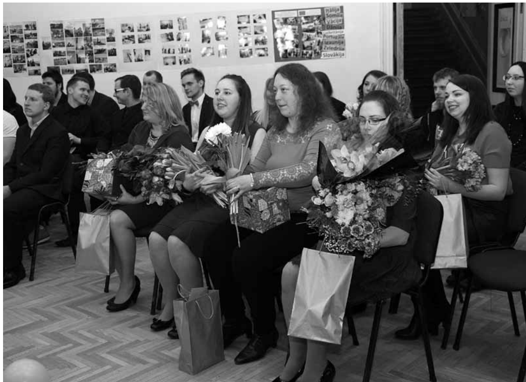
Kuldīgas Tehnoloģiju un tūrisma tehnikumu ceturtdien beidza 28 audzēkņi četrās specialitātēs: autoelektriķi, loģistikas darbinieki, ēdināšanas speciālisti un aukles.