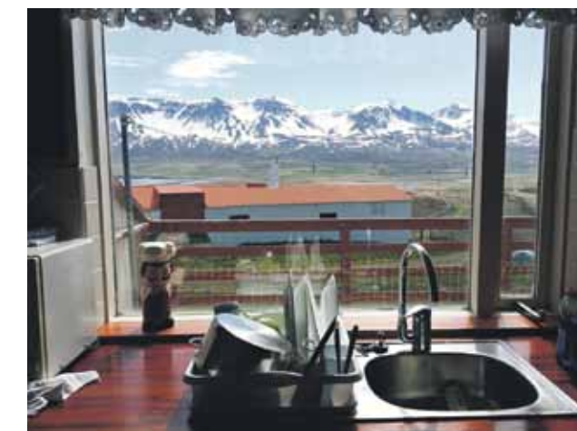
Skats pa Oskara dzīvokļa logu nelielajā pilsētīnā Vopnafjördurā.