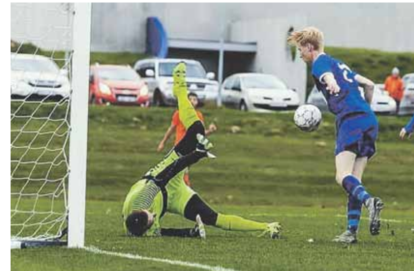
Latviešu vārtsargs rāda meistarību, neļaujot pretiniekam iesist bumbu.

„Vārtsargiem Islandē dzīve ir grūta, jo pūš spēcīgs vējš, mainot bumbas lidojumu. Neko darīt – jāpierod.”