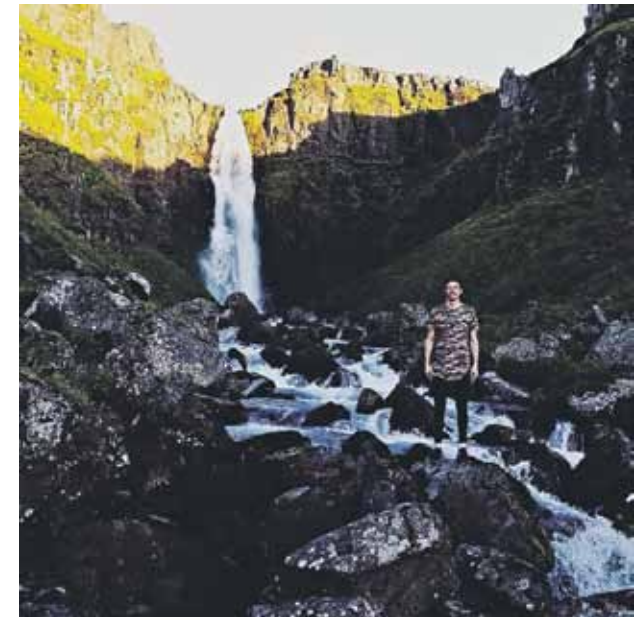
Kuldīdznieks izbūvē Islandes pasakaino dabu.