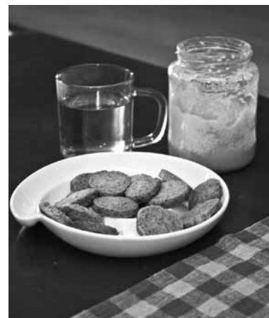
Kaņepju tējas garša katram saistoties ar ko citu: ar pelašķiem, ar vasaru. Klāt var piekrist pašceptus cepumiņus, arī ar kaņepēm.