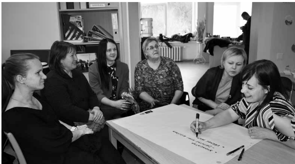
Ko vēl organizēt pagasta bibliotēkā? To sarunas dalībnieki apsprieda darba grupās.

Bibliotēka sadarbojas ar skolu un pirmsskolas iestādī, ar senioriem, jauniešu centru Čiekurs un pagasta pārvaldi. Pasākumi vairāk domāti mazajiem lasītājiem: „Piecgadniekus un sešgadniekus radinām pie grāmatām un lasīšanas. Reizi vai divas nedēļā viņi nāk uz tematisko pēcpusdienu, kurā ir uzdevumi un rotaļas. Divreiz mēnesī nāk ciemos rotaļu grupas bērni. Lasīšanas programmā Bērnu un jauniešu žūrija piedalās arī pamatskolas bērni un jaunieši. Kopā ar skolu rīkojam pasākumus, pie mums ciemojusies rakstniece