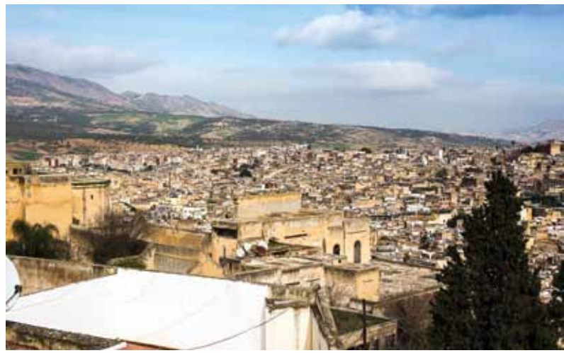
Skats no brokastu terases.

Vēl tiek iekasēta 1500 eiro drošības nauda, bet ar to bijām rēķinājusies. Tieši pirms izbraukšanas bankā Citadele akcija: kredītkarte VISA pusgadu bez maksas, bet patīkami. Dodamies meklēt mašīnu. Stāvvietā grozās auto īres kompāniju darboni. Tā kā uz dokumentu mapes rakstīts Hertz ,