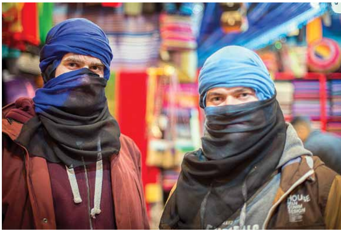
Gandrīz kā īsti berberī.