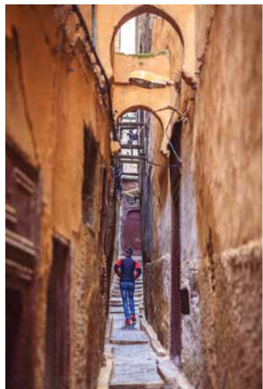
Kā viņi mājās atnes jauno ledusskapi?