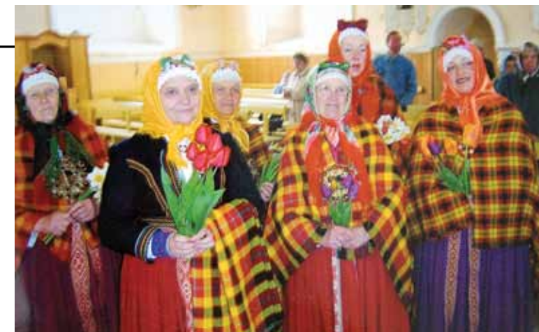
Suitu sievas (Ilga otrā no kreisās) dzied Alsungas baznīcā.

„Dieviņš mani diktī milē, tādēļ uzstājta man kuņģa čūlu. Nogulēju mēnesi slimnīcā, un tādēļ bija iemesls teikt, ka uz turieni nebraukšu, jo jāietur diēta. Tad man ļāva izvēlēties Latgalē Dagdas krievu internātskolu vai Liepnas vidusskolu, kurā arī biju mūzikas skolotāja trīs gadus.