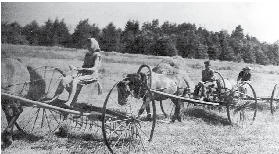
Skolēnu darbs vasarā.