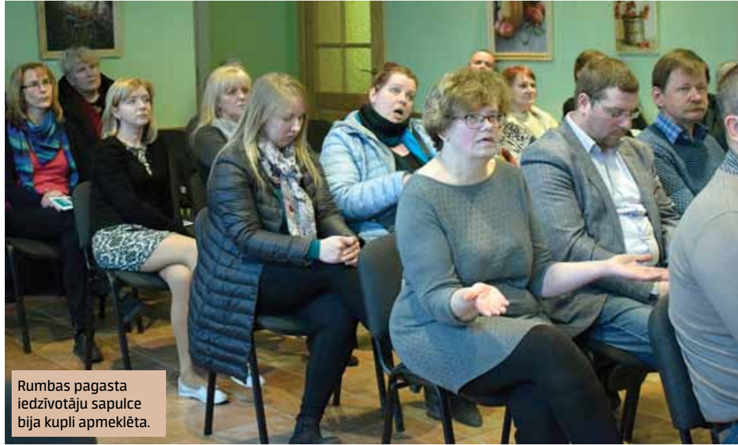
Rumbas pagasta iedzīvotāju sapulce bija kupli apmeklēta.

Pērn nomainītas trīs caurtekas (5432 eiro) uz ceļa Palejas–Kriš-