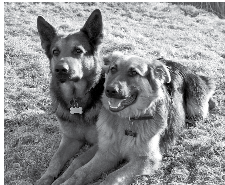
Kardo un Basters ir dresēti suņi, prot izpildīt vairākas komandas, viena no tām – gulēt.