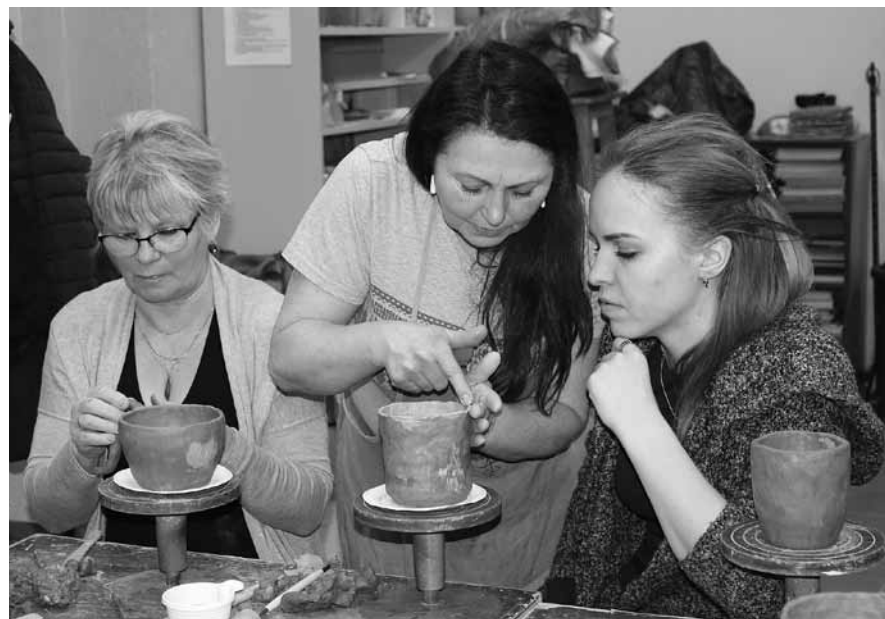
Kuldīgas paletes arhīva foto

Latvijā akcija notika jau desmito gadu. Tās būtība ir plašākai sabiedrībai pavēstīt par meistariem, viņu zināšanām un prasmēm, kas pārmantotas no paaudzes paaudzē.