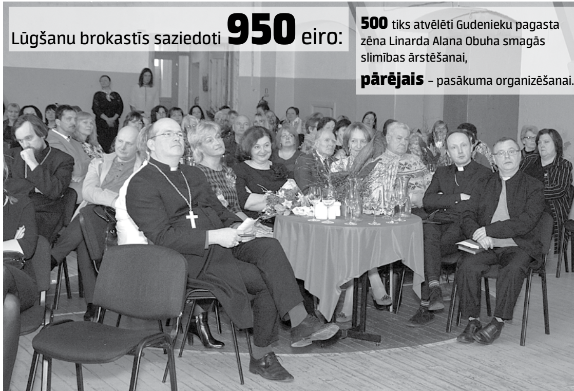
Kuldīgas novada astotās Lūgšanu brokastīs pulcēja dažādu kristīgo konfesiju, laicīgās varas un uzņēmumu pārstāvjus.

Kuldīgas novada astotajām Lūgšanu brokastīm izvēlēta vieta – Jauniešu māja – radija atbilstošu gaisotni, lai pārdomātu, vai viegli būt jaunam.