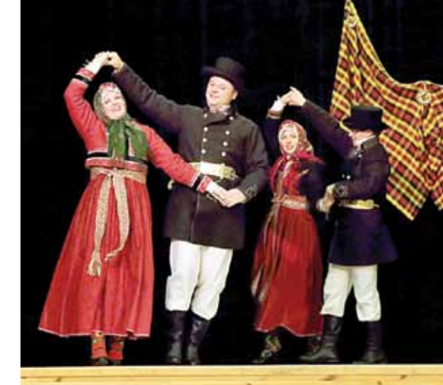
Alsungas vidējās paaudzes deju kolektīvs Suiti sevi rāda jaunajos tautas tērpos. Tie tapuši ar biedrības Suiti gādību un par programmas LEADER naudu.

rējām parādīt sava tērpa košumu, uzvelkot kaut ko citu, jo sievu tērpiem ir trīs veidu jaciņas. Līdz tam mums katrai bija tikai viena, vairumam – privātas. Tagad varam parādīt suitu bagātību. Tas ir ārkārtīgs ieguvums.” Ideja darināt tērpus radusies tāpēc, ka Latvijas simtgadē alsundznieki gribējuši rādīt etnogrāfisko uzvedumu Suitu kāzas .