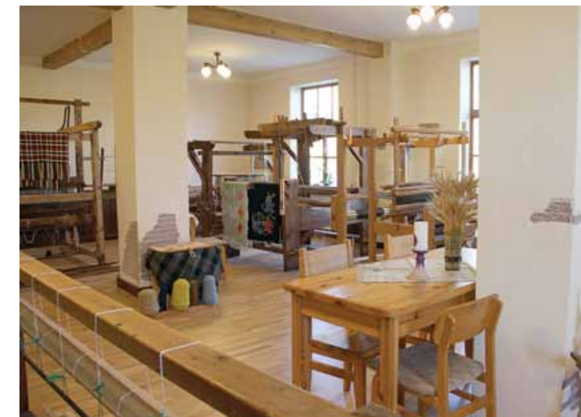
Alsungā, Skolas ielā 11a, izremontēta austuve.