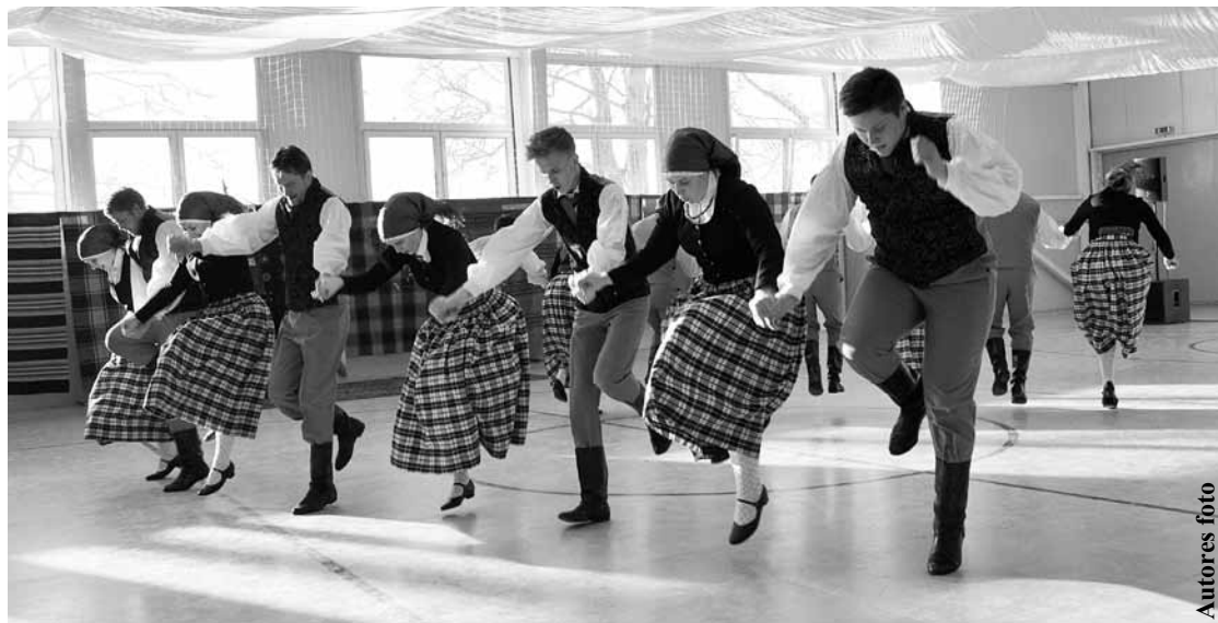
Koncertā Vārmē dejotāji lēca tik augstu un ar tādu atdevi, ka skatītāji ievēroja – līdzī kustas griestu rotājumi. Dimdari visu atlikušo spēku un enerģijas dzirksti atdod pēdējai dejai Kūmas .

Vārmenieki atzīst, ka uzstāties mājās tomēr daudz grūtāk nekā ciemos. Pašiem un arī skatītājiem, kuru šogad bija vairāk, vislabāk patikusi koncerta beigu daļa, kurā iekļautas izvēles dejas, nevis no lieluzveduma. Tās bija rakstur-