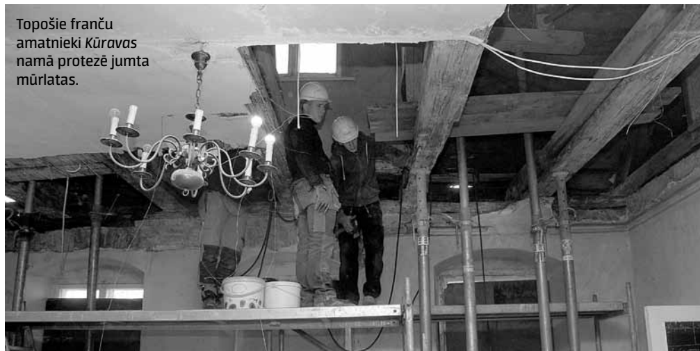
Topošie franču amatnieki Kūravas namā protezē jumta mūrļatas.