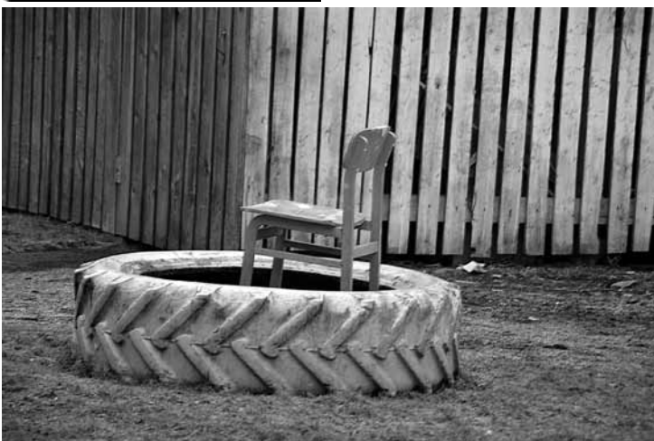
Gatavojamies dārza svētku ballītei!