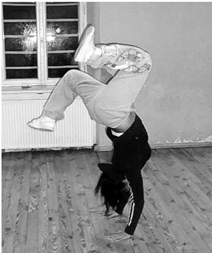
Agrita mēģinājuma brīdi.

Kā karsējmeitenes konkursā piedalījāmies pirmo reizi, bet kā deju grupa uz festivāliem braucam regulāri. Tuvākais būs 27. aprī-