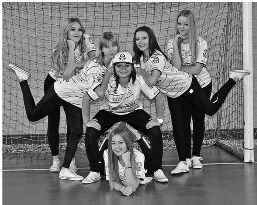
Deju grupa Beat the Moment pirms uzstāšanās.