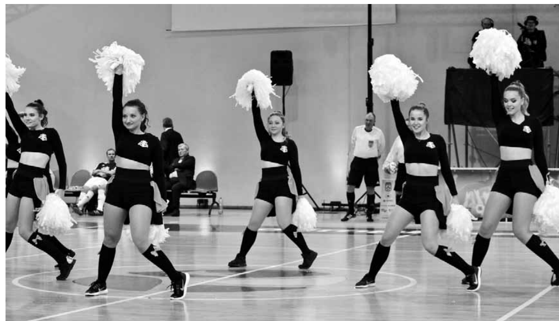
Kuldīdznieces pirmo reizi piedalījās futbola karsējmeiteņu konkursā Rīgā un izcīnīja 3. vietu.

atsāku grupu vadīt. Nu jau dejojām vairāk nekā desmit gadus.