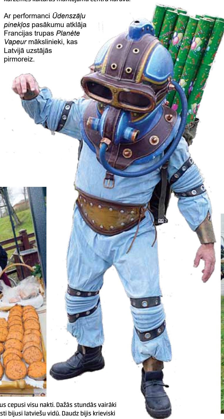
Ar performanci Ūdenszāļu pinekļos pasākumu atklāja Francijas trupas Planète Vapeur mākslinieki, kas Latvijā uzstājās pirmoreiz.