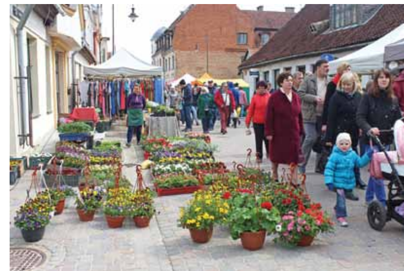
Tirgošanās sākās Liepājas ielā un turpinājās Kalna ielā līdz pat Pilsētas dārzam.