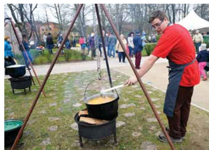
Lašu zupu trijos lielos katlos uz uguns vāra Skrundas SIA Cepļiņi .