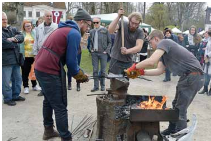
Starptautiskajā saietā Laires kalēji Igaunijas smēdē daudz skatītāju.