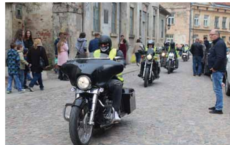
Arī Kuldīgā atklāta motosezona.