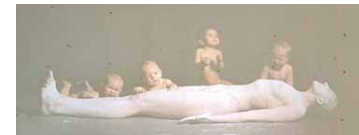
Kuldīgas Mākslinieku rezidencē – izstāde Starp diviem ezeriem , kurā apkopotas performances no 90. gadiem līdz mūsdienām.