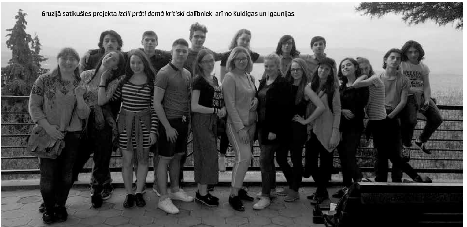
Gruzijā satikušies projekta Izcili prāti domā kritiski dalībnieki arī no Kuldīgas un Igaunijas.