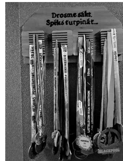
Medaļu turētājs – meitas dāvana.