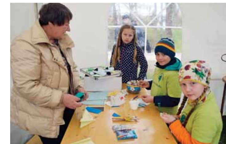
Kuldīgas kultūras centrs izveidojis taureņu un spāru inkubatoru: gan bērniem, gan mammām un vecmammām ir, ko darīt.