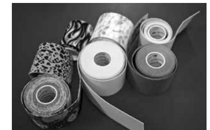
Teips ir kokvilnas lente ar akrila līmi, tiem ir dažādas krāsas un raksti.

„Plāksteris iestiepjoties paceļ virsādu un zemādas fascijas muskuļus, zem tiem rodas telpa, kurā uzlabojas asinsrite, vielmaiņa, limfās atcece, mainās sāpju un kustību receptoru darbība. Teipi ir dažādi: ir sporta – tie nav tik elastīgi un pieguļ ļoti stingri, ir dinamiskie – tie stiepijas visos virzienos utt. Es strādāju ar kinēzioloģiskajiem, kas stiepijas tikai vienā virzienā – garenvirzienā.