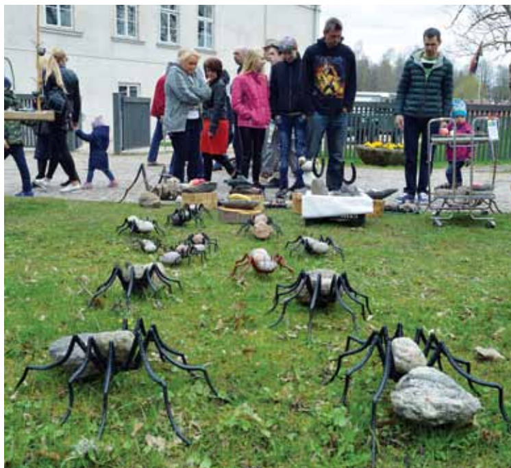
Aivara Vāveres dārza dekori no akmens un metāla.