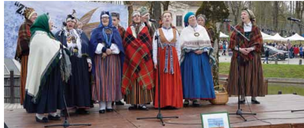
Folkloras kopa no Kandavas atbraukusi uz Kuldīgu apdziedāt Kurzemes kultūras mantojuma centru Kūrava.