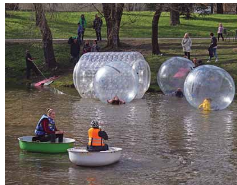
Aktivitātes Alekšupītes diņi.