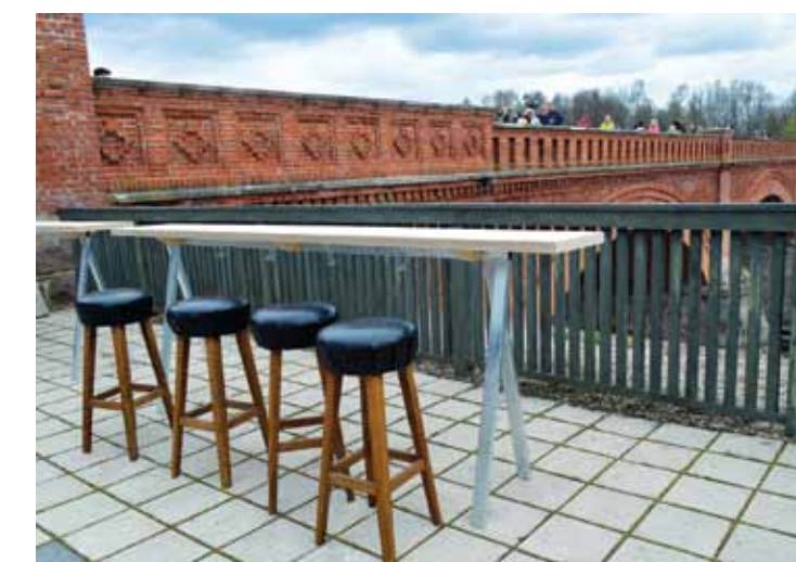
Pagalmā aiz Mākslinieku rezidences Ventas krastā atvērta jauna kafējnīca Residence kafe .