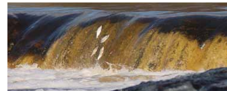
Svētki tapuši par godu lidojošajām vimbām, un galvenās, protams, tajos ir zivis.