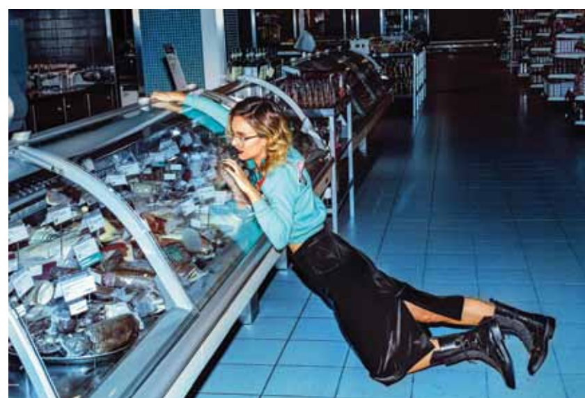
No fotosesijas apavu zīmolan INCH2.