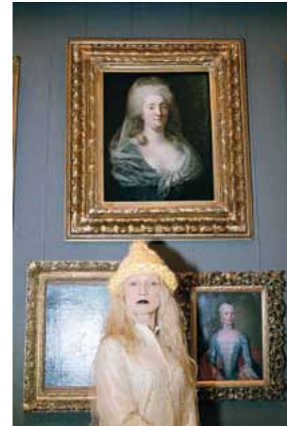
No žurnāla Veto modes fotosesijas.