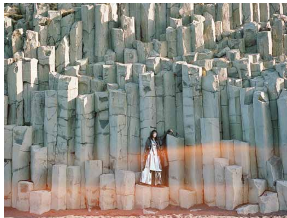
No žurnāla Veto modes fotosesijas.

Pirms diviem gadiem Latvijas Fotogrāfijas muzejā bija skatāma skrundenieces Kristīnes Madjares personalizēta par Skrundu. Līdz dzimtajai pilsētai tā gan nenonāca, taču fotogrāfe turpina strādāt pie dokumentālās sērijas Inland (Iekšzeme) , kas stāsta par savrupo mazpilsētu, ko, pēc autore vārdiem, raksturo klusums, tukša ainava, smags un pacietīgs cilvēku darbs.