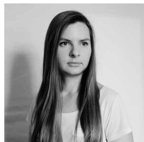
Fotogrāfe Kristīne Madjare: „Skrunda man ir atslodze no lielpilsētas burzmas un vienaldzības.”