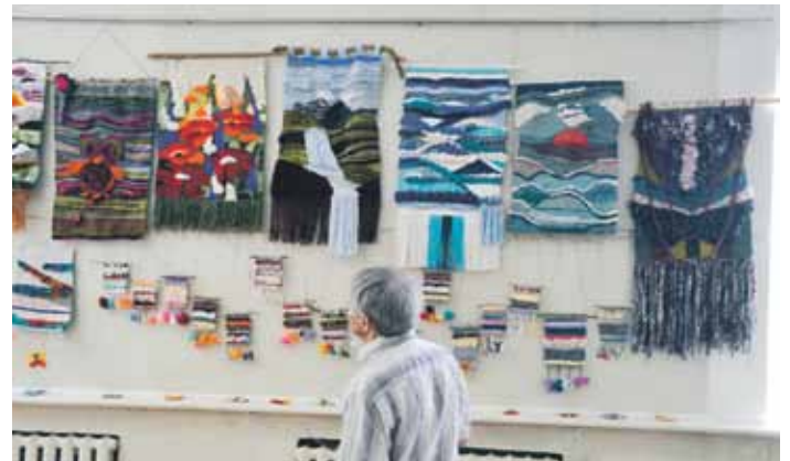
Kultūras namā varēja skatīt gobelēnu izstādi.