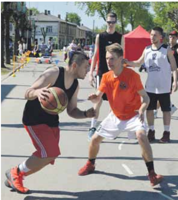
Neiztrūkošas ir sporta sacensības, galvenais – strītbols.