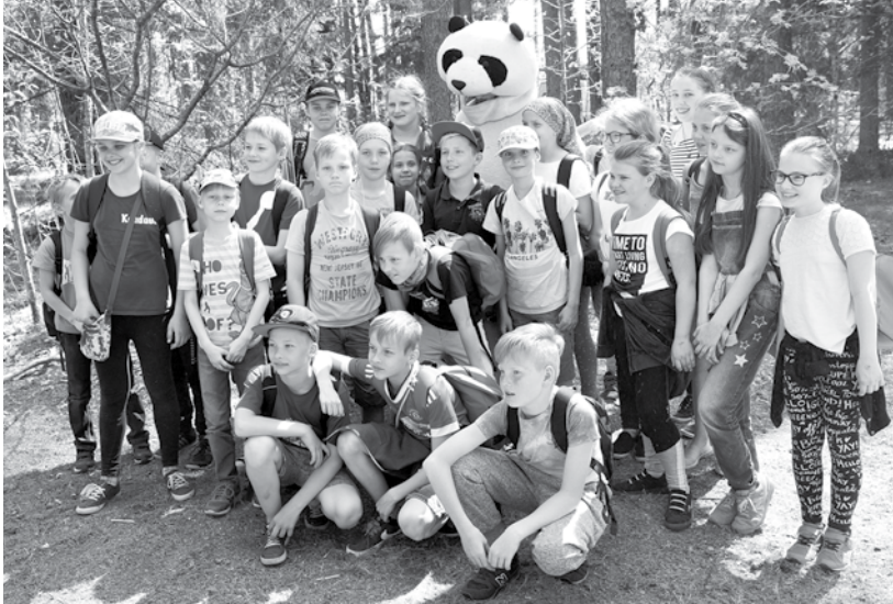
Pēc Pasaules dabas fonda pieturas Meža dārgumi , kurā bija jāatpazīst meža iemītnieku balsis, ikvienam bija iespēja nofotografēties kopā ar pandu, un vai ikviena skolēnu grupa to arī izmantoja.