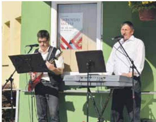
Ar populārām latviešu sirdsdziesmām priecē grupa Ēna no Snēpeles.