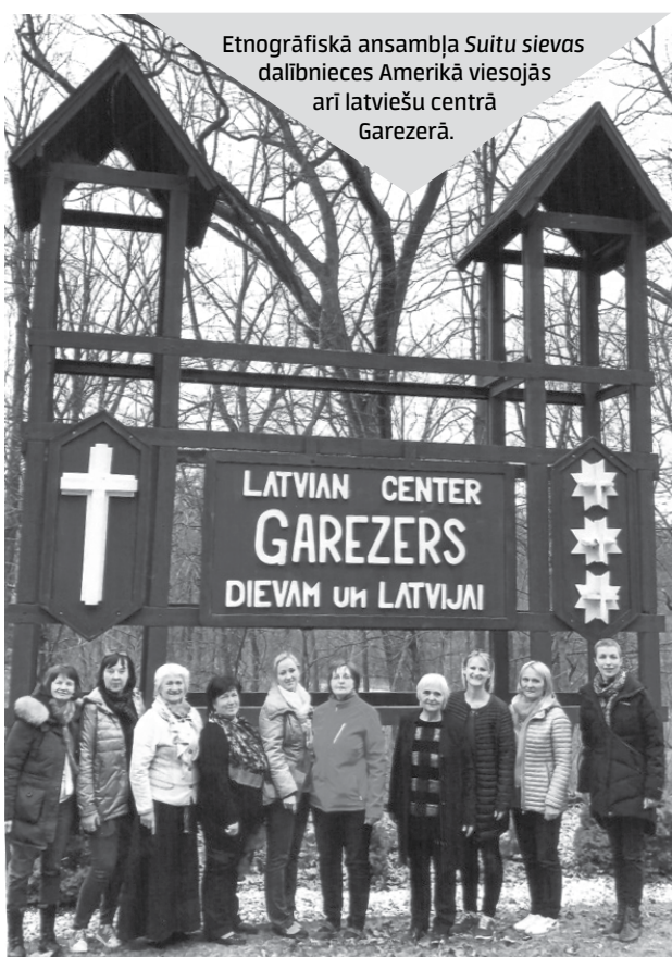
Etnogrāfiskā ansambļa Suitu sievas dalībnieces Amerikā viesojās arī latviešu centrā Garezerā.