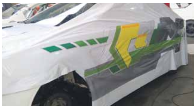
Šādi izskatās automašīna, kas sagatavota aplīmēšanai.