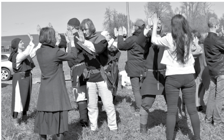
Ušiņa dienā Turlavas pagastā Vidrižu folkloras kopa Delve dziedāja, spēlēja un gāja rotaļās ar apmeklētājiem.

nosaukums tam ir ugunskrusta mezgls. Ugunskrusts nes veiksmi, un to nodrošinās mezgls, kurā četri zari sakrustojas. Mezglu siešana ir arī ļoti laba darbošanās pirkstiem. To var uztvert arī kā meditāciju – ritmiska darbība noskaņo uz kādas domas viļņa. Saka, ka latvietēm jebkādi rokdarbi ir meditācija. Galvenais ir katram atrast piemērotu.”