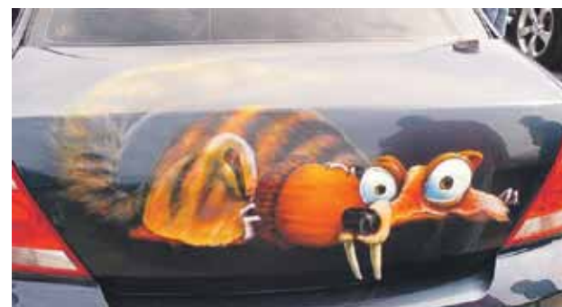
Aerografikā darināts tēls no animācijas filmas Ledus laikmets .