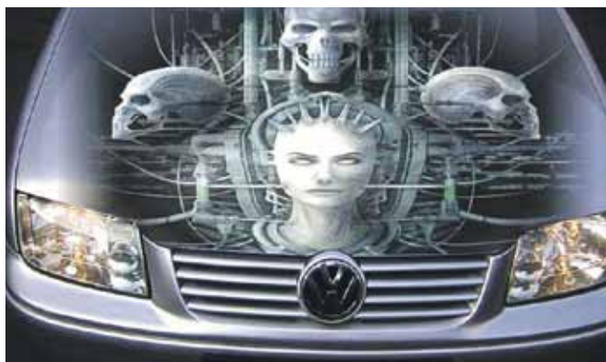
Šāds aerografikas zīmējums vairāk tik jaunajai paaudzei.

Auto aplīmēšanai konkrētu summu uzņēmums nevar nosaukt, jo tā atkarīga no klienta vēlmēm,