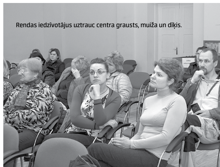
Rendas iedzīvotājus uztrauc centra grausts, muiža un dīķis.