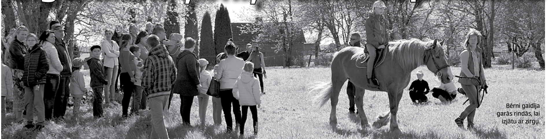
Bērni gaidīja garās rindās, lai izjātu ar zirgu.

Klausīties dziesmas, kuršu ķoniņu dzimtu stāstus, skatīties dejas, iet rotaļās un piedalīties meistarklasēs varēja Ušiņdienas svinībās Turlavas pagasta Ķoniņciema Vidusmaulās.