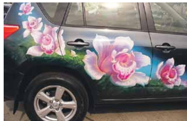
Krāšņie ziedi aerografikas tehnikā.