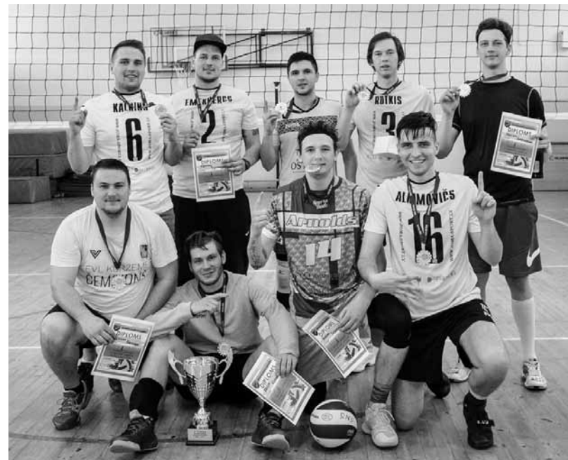
Nu jau ceturkārtēji Skrundas atklātā volejbola čempionāta laureāti – mājnieku komanda Ziedu fabrika .