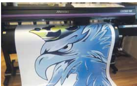
Tiek drukāta uzlīme (ērglis) smagajai automašīnai.