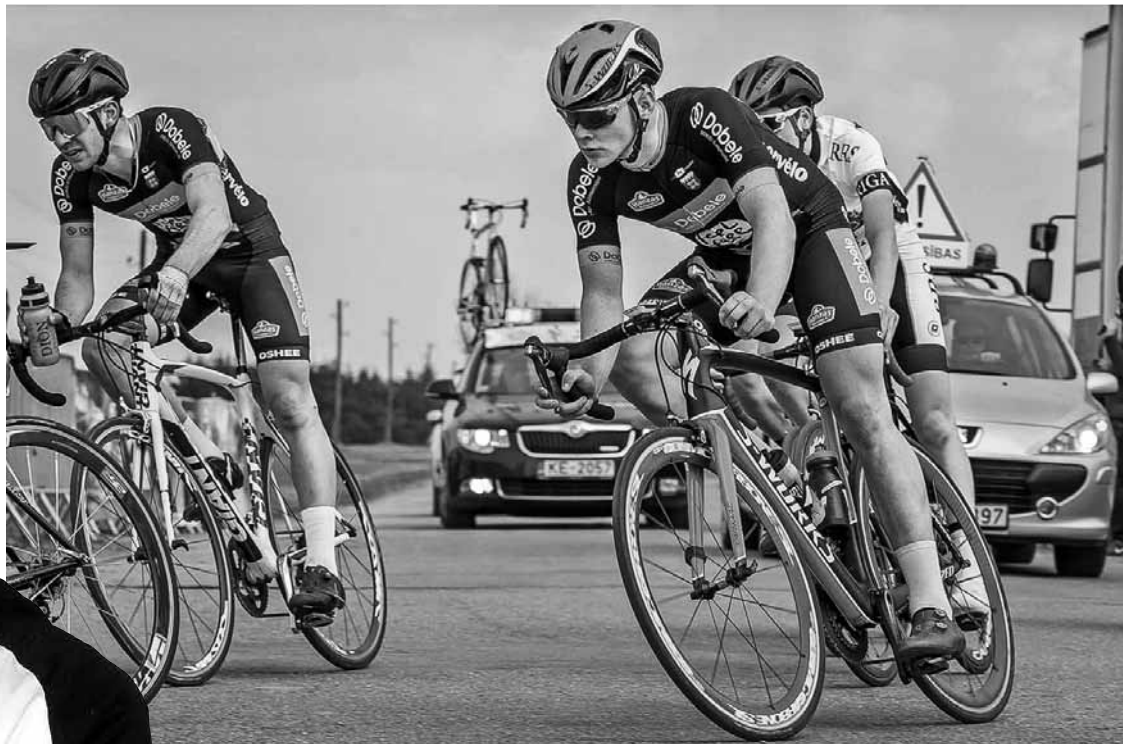
Arvis sacensību brīdī.

Droši vien tas, ka jebkurā laikā varu uzsēsties uz riteņa un