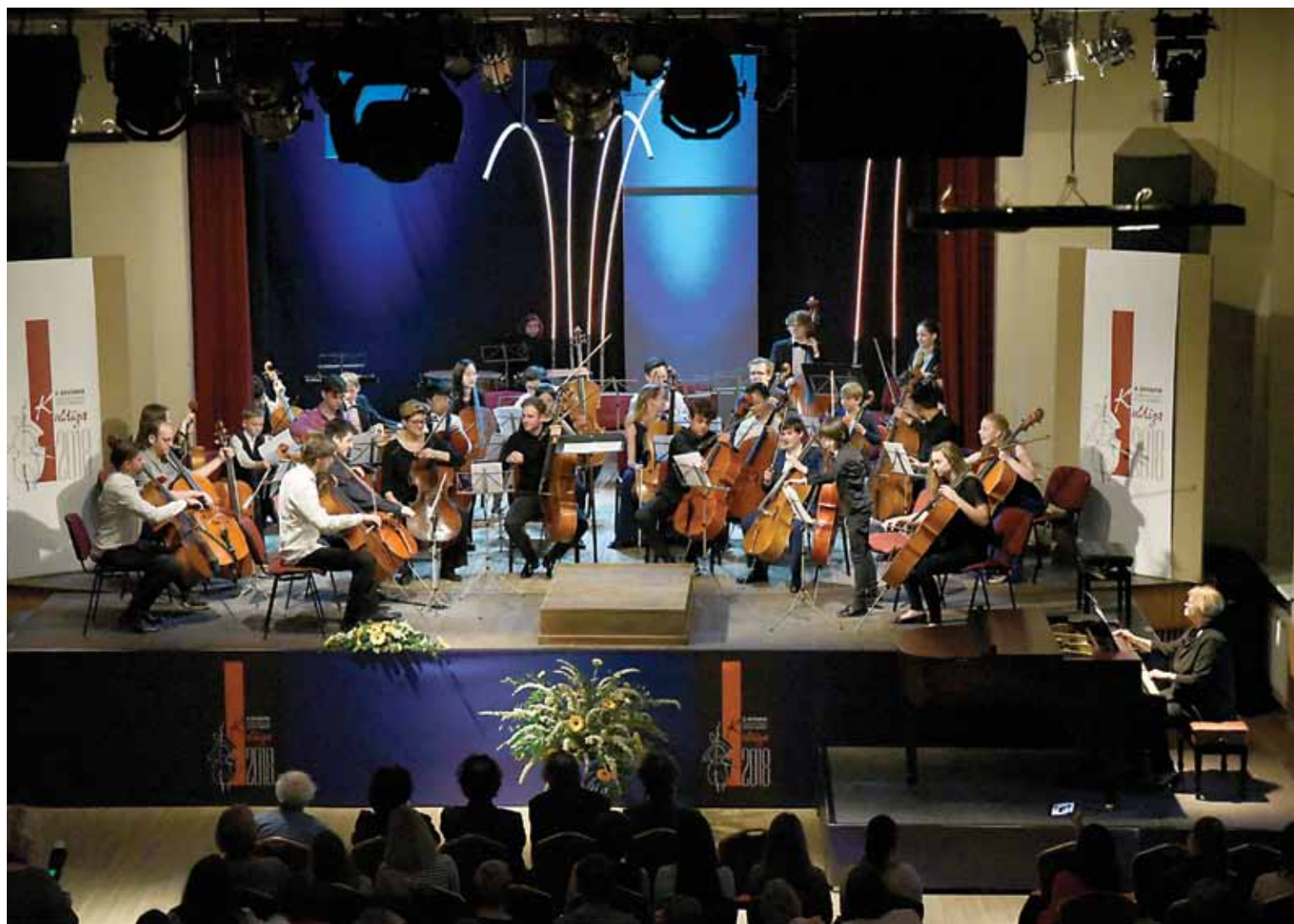
Čellistu konkursantu orķestris.