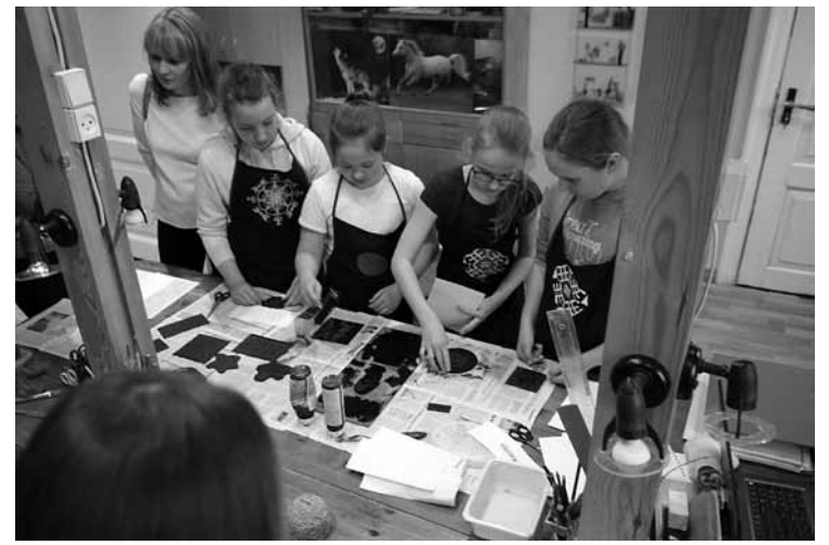
Vienkārša linogrēzuma tehnikas darbnīca: formas jeb klišejas nokļāj ar krāsu, tad nospiedumu drukā uz papīra.