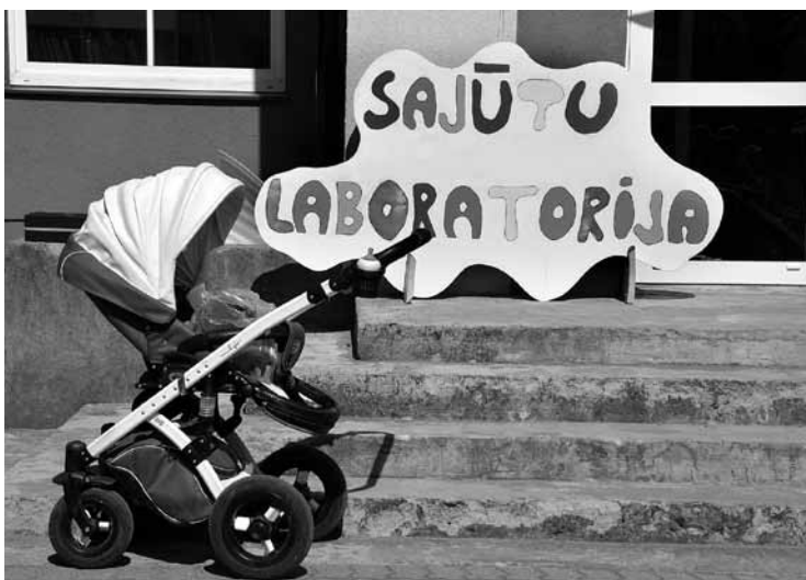
Aizgāja nodot bērnības sajūtas.