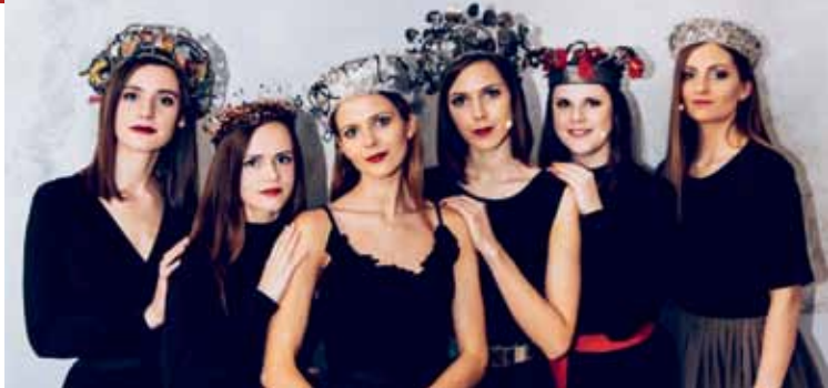
Etno mūzikas grupa "Tautumeitas". Publicitātes foto