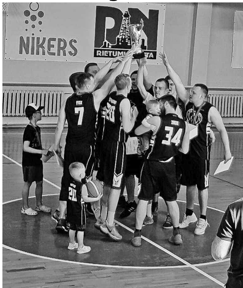
Par Kuldīgas novada čempioniem kļūst komandas Buki spēlētāji.