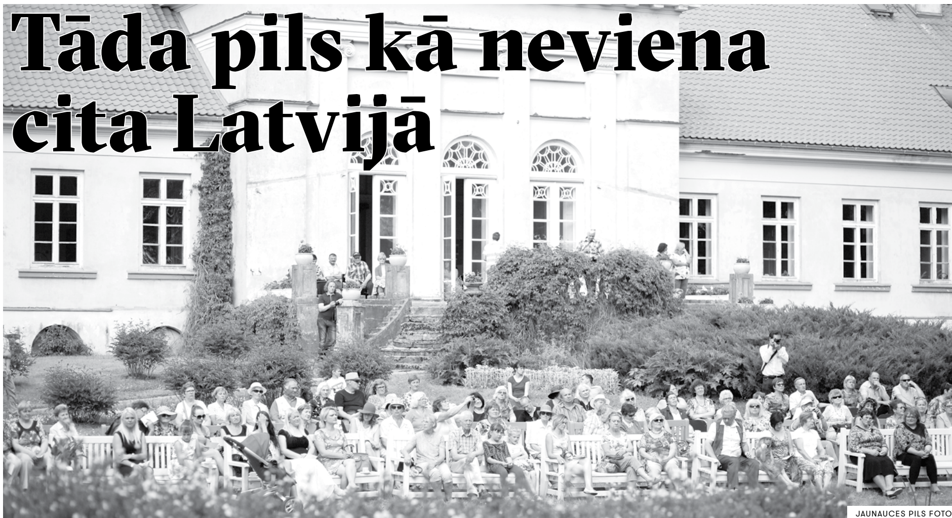
JAUNAUCES PILS FOTO

DĀRZA SVĒTKI JAUNAUCES PILĪ vienmēr tematiski un stilistiski citē pils vēsturi.