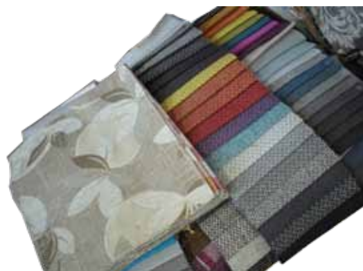
Visbiežāk cilvēki izvēlas mēbeles atjaunot pelēkos un brūnos toņos.

Visbiežāk mēbeles vēlas pārtapsēt privātpersonas, bet ir nācies to darīt arī uzņēmumiem un skolām. „Pie kādas mēbeles ir pierasts, tā pierādījusi, ka nelūst, tāpēc cilvēki vēlas atjaunot. Uzliekot kaut vai jaunu audumu, tā