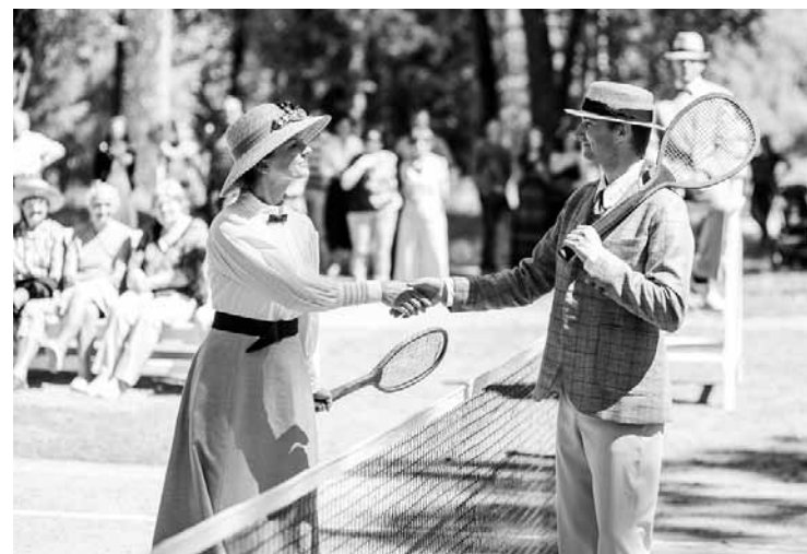
2017. gadā jaunaucēnieki atdarināja 1903. gadu, jo tad pils parkā izveidoja tenisa laukumu. Dārza svētkos demonstrēja tērpus, kādos vietējie muižnieki spēlēja tolaik Eiropā populāro pāru spēli. Katrām dārza svētkiem to rīkotāja biedrība “Mēs Jaunaucēi” uzšuj vienu vēsturiski precīzu tērpu sievietei un vīrietim. Kolekcija būs pabeigta, kad garderobe aptvers Ropu laikus Jaunaucē (1815–1920).

“Mēs jau darām muzejnieku darbu, jo redzam pili visu Latvijas muzeju saimē. Darbojamies divos virzienos, ieskaitot visu, kas saistīts ar skolas mitināšanos pilī (mums ir autentiskas ekspozīcijas par padomju laika skolu, piemēram, 60. gados veidots fizikas un ķīmijas kabinets ar visu