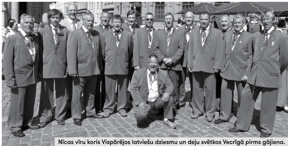
Nīcas vīru koris Vispārējais latviešu dziesmu un deju svētkos Vecrīgā pirms gājiena.