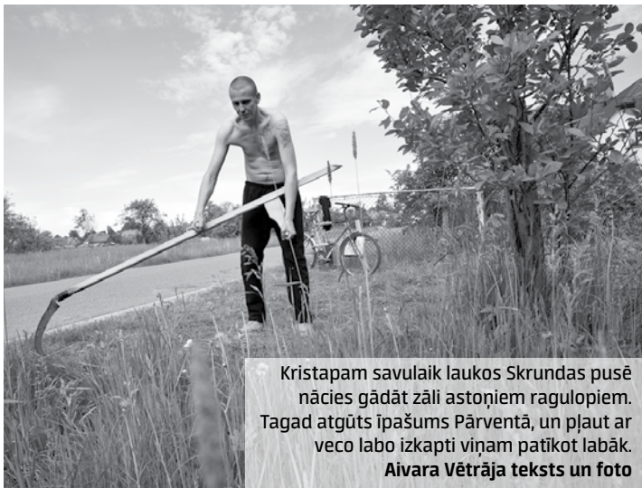
Kristapam savulaik laukos Skrundas pusē nācies gādāt zāli astoņiem ragulopiem. Tagad atgūts īpašums Pārventā, un plaut ar veco labo izkapti viņam patīkot labāk.

Kurzemnieks Kuldīgā, 1905. gada ielā 19, LV-3301