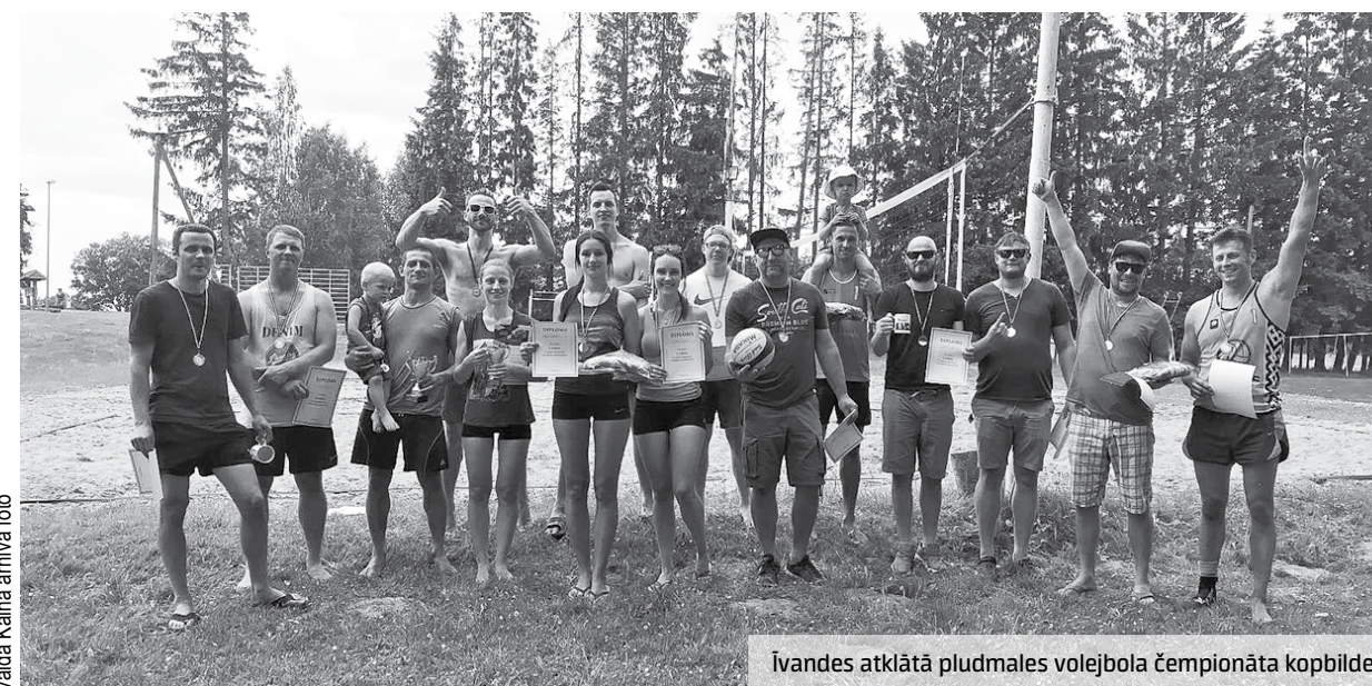
Ivandes atklātā pludmales volejbola čempionāta kopbilde.

Dalībnieki saka paldies pagasta pārvaldei par balvām, Kuldīgas novada sporta skolai par laukumu inventāru, bet Ivandes muižai par lielisko sacensību vietu.