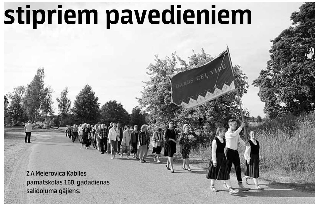
Z.A.Meierovica Kabiles pamatskolas 160. gadadienas salidojuma gājienis.