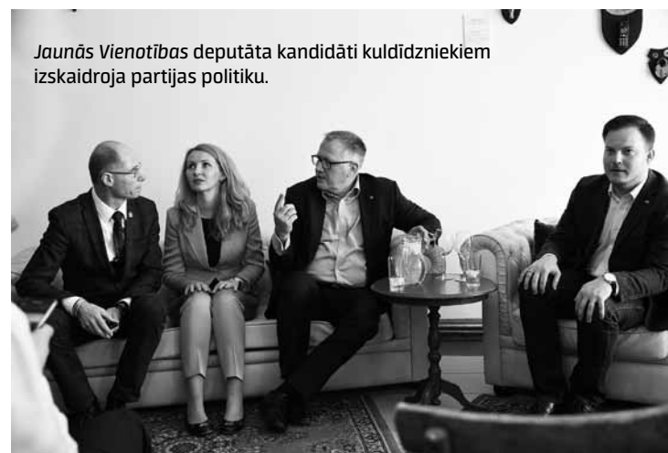
Jaunās Vienotības deputāta kandidāti kuldīdzniekiem izskaidroja partijas politiku.