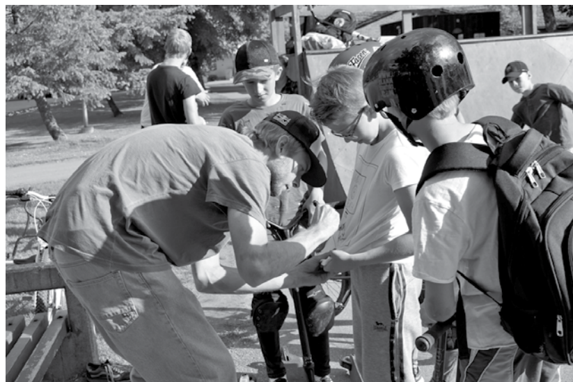
Ieraugot Madaru, mazie kuldīdznieki stāvēja rindā, lai saņemtu autogrāfu.

Armands to dara jau 17 gadus. Viņš novērojis, ka skeitparki vai vismaz vieta ar vienu rampu ir teju vai katrā Latvijas pilsētā. „Skeitboards dod brīvības izjūtu. Strādāju maz, taču katru dienu vismaz astoņas stundas skeitoju. Kā man tas izdodas? Strādāju pie projektiem, esmu režisors palīgs, tikko beidzu darbu pie krievu filmas. Iznāk aptuveni tā: mēnesi strādāju, mēnesis brīvs – varu ceļot un skeitot.”