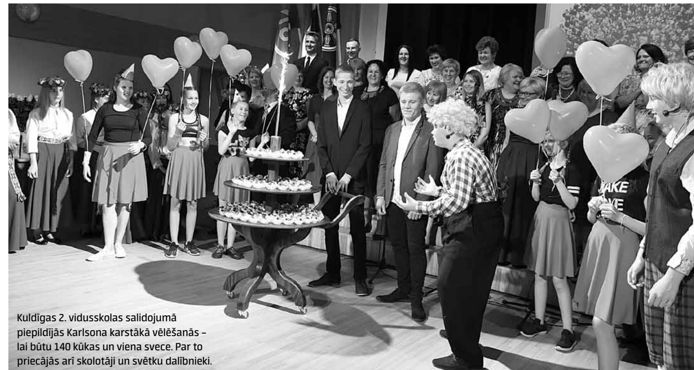
Kuldīgas 2. vidusskolas salidojumā piepildījās Karlsona karstākā vēlēšanās – lai būtu 140 kūkas un viena svece. Par to priecējās arī skolotāji un svētku dalībnieki.

Laila Liepiņa  Vairāk foto: www.kurzemnieks.lv .