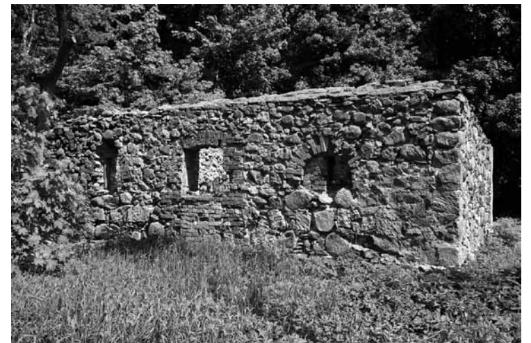
Iecerēts, ka šo drupu vietā taps baznīca.