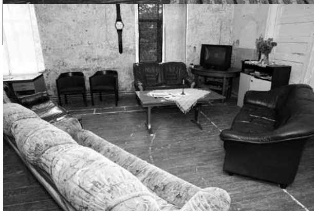
Tiem, kuri vēlas atbrīvoties no atkarības, atpūtas telpā jauts skatīties televizoru, tomēr biežāk šeit notiek sarunas.