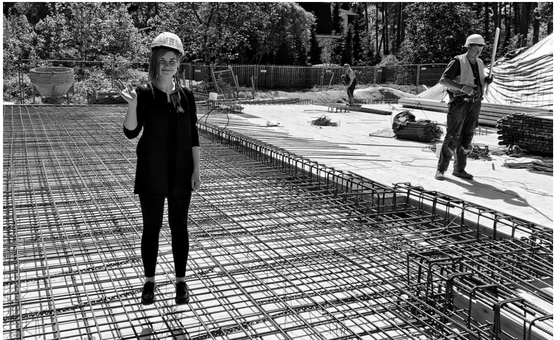
Autoruzraudzības laikā, pieņemot pagrabstāva pārseguma plātnes stiegrojumu atpūtas namā Jūrmalā.

„Universitātē risinām uzdevumus un nesaskaramies ne ar kādām pārdabiskām situācijām, bet dzīvē viss ir pavisam citādi. Katra situācija ir unikāla, un jācenšas