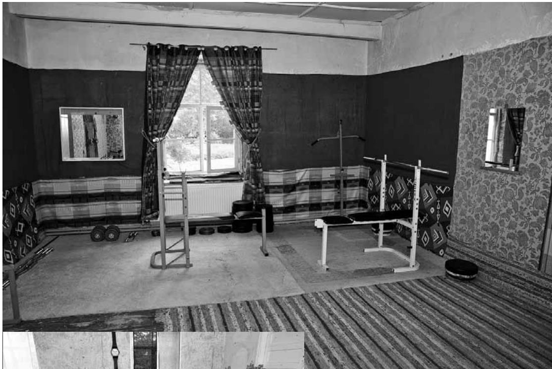
Nīkrāces skolas bijušais vēstures un ģeogrāfijas kabinets pārveidots par trenāžieru zāli, tomēr jaunie saimnieki no Lietuvas saglabājuši uzrakstu uz durvīm.

Jau vairāk nekā piecus gadus notiek Nīkrāces vecās skolas nama atdzimšana – tagad tur saimnieko kristieši no Lietuvas pilsētas Akmenes: gan palīdzot grūtībās nonākušiem cilvēkiem, gan atjaunojot vēsturisko ēku un iekopjot apkārtni.