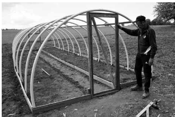
Tiek veidots dārzs un celta siltumnīca, lai kristīgā kopiena pati izaudzētu pārtikai vajadzīgo.