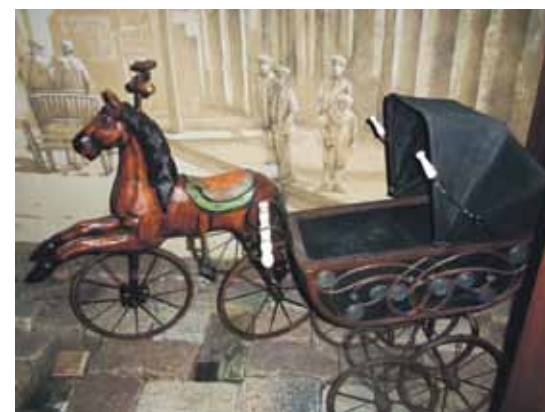
Neparastais bērnu trīsritenis zirdziņa veidolā un mazuļa ratiņi kādreiz ražoti Šauļos.