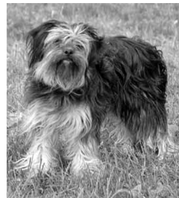
Tiklīdz parkā parādās kāds ar četrkājainu draugu, klāt ir vietējais šunelis, kas uzskata, ka tam jāuzrauga visa iela.