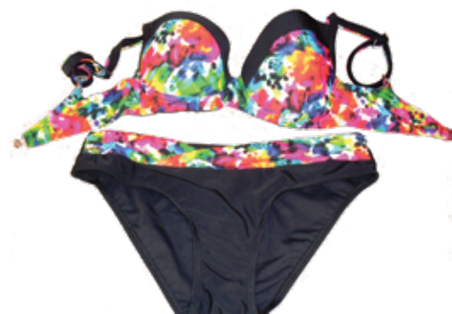
Košs peldkostīms, krūsturis ar polsterējumu.