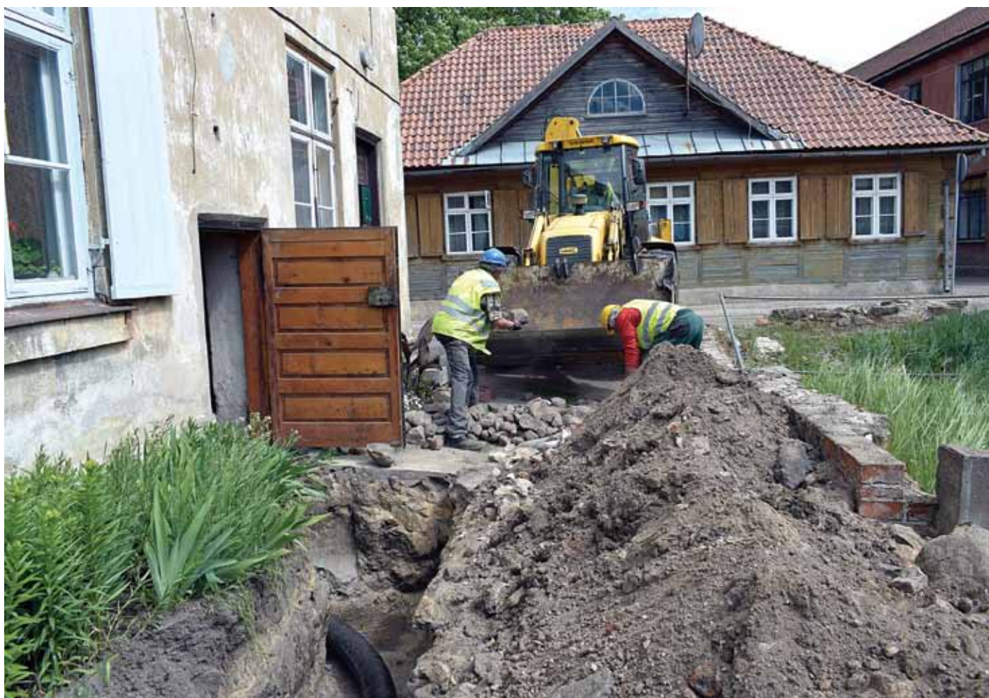
Kuldīgas siltumtīklu darbinieki Kalna ielā 10 pabeidz ēku pieslēgt pilsētas siltumapgādei.

Kuldīgā drīz būs pabeigta daudzdzīvokļu nama Kalna ielā 10 pieslēgšana centralizētajai apkurei, bet līdzīgā ēkā Smilšu ielā 1 Kuldīgas siltumtīklu (KS) darbinieki to jau izdarījuši.