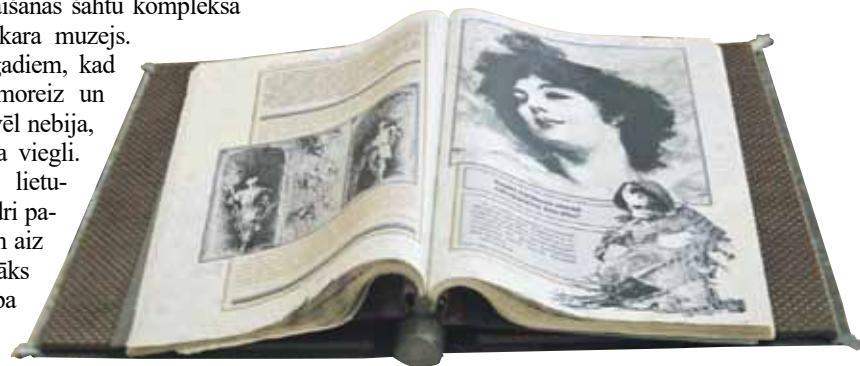
Lielākā un smagākā Lietuvas grāmata skatāma Šauļu universitātes bibliotēkas foajē.

atklātu šahtas ieeju. Par laimi, neviena raķete palaista netika, bet radioaktīvā degviela vienīgo reizi iepildīta 1968. gadā, kad raķetes notēmētas uz Čehoslovākiju. Cipari ir šaušalīgi: raķetes ātrums – 600 m sekundē. Londonu tā sasniegtu desmit minūtēs; ja jākorģē mērķa precizitāte, 5 km šur vai tur ir sākums – „ka tik Londona”. Muzejs iespaidīgs, arī propagandai atvēlētā telpa, un tā nevilšus liek aizdomāties, cik labils ir miers pasaulē, kad lielvaras grib sevi demonstrēt.