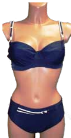
Tumši zilo tērpu lieliski papildina baltas lencas.