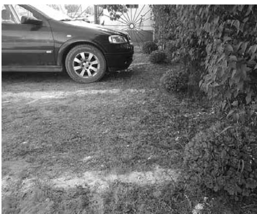
Pie Akmeņraga bākas viss ir ekoloģiski, pat autostāvvietu marķējums.