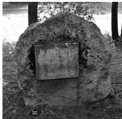
Neviens nav uzdrošinājies aizvākt šo padomju laiku palieku. Tāpat nevienam agrākajam komjaunietim nav bijis dūšas notīrīt akmens plāksni, lai labāk var izlasīt, ka ozoliņus parkā 1968. gada 28. septembrī sastādījuši Latvijas Ļeņina komunistiskās jaunatnes savienības 50. gadadienas salidojuma dalībnieki.