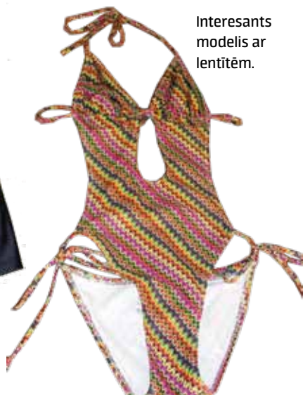
Interesants modelis ar lentītēm.