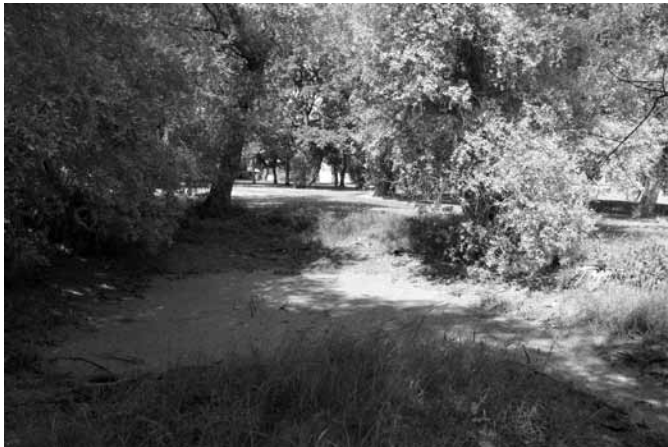
Kādreiz Leona Paegles ielas bērniem ziemās šis vītoli ieskaūtais diķītis bija slidotava.