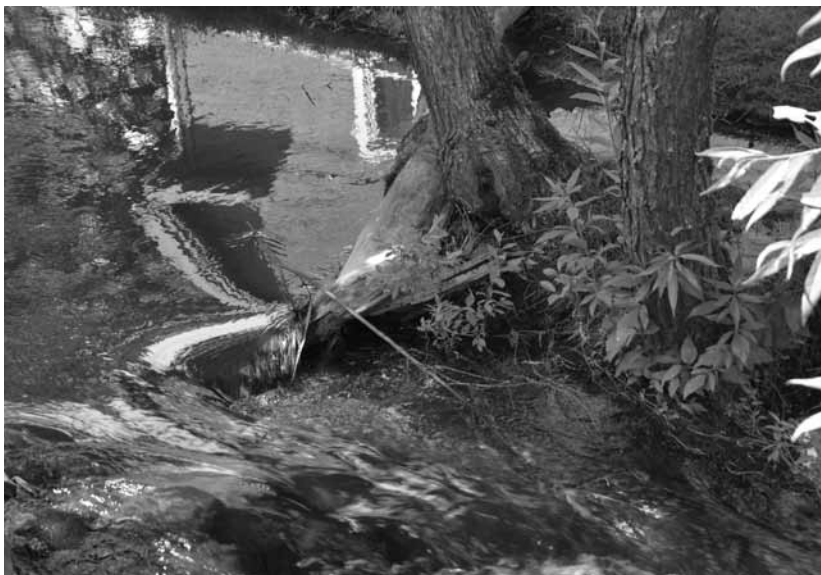
Burbuļo Alekšupīte, un no otra krasta tajā spoguļojas Sv. Annas draudzes māja.