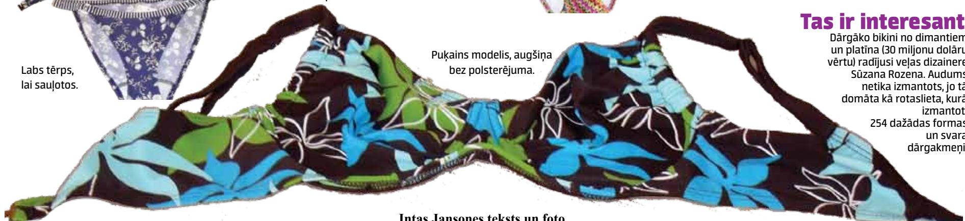
Intas Jansones teksts un foto