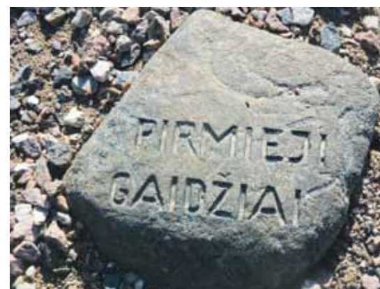
Saules laukumā – atgārne par senajiem diennakts stundu nosaukumiem, bijis arī pirmo gaiļu laiks.