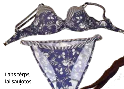
Labs tērps, lai sauļotos.