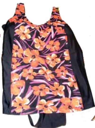
Kopējais peldkostīms augumā pamanāmām dāmām.