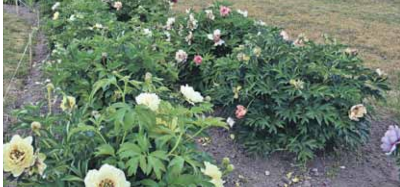
Šajā dobē aug intersekciju peonijas – tas nozīmē, ka šķirne izveidota, krustojot krūmpeoniju ar lakstaino. Tām nevajag balstus, jo kāts ir pietiekami spēcīgs, lai noturētu smagos ziedus un nenoliektos.