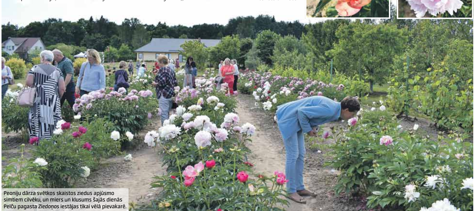
Peoniju dārza svētkos skaistos ziedus apjūsimo simtiem cilvēku, un miers un klusums šajās dienās Pelču pagasta Ziedoņos iestājas tikai vēlā pievakarē.