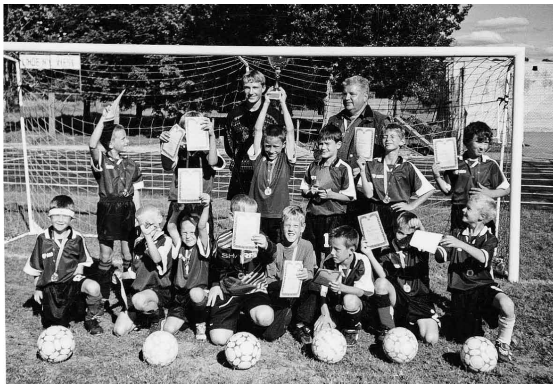
Puikas uzvarētāju godā.

Tad spēlēja arī jūrskolas komandā. Nekādās izlasēs gan nesmu bijis. Vēlāk, strādājot uz kuģa, bija pasaules čempionāts starp kuģu komandām. Tur bija sarežģīta punktu skaitīšanas sistēma. Gājām