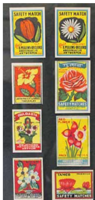
Sērkokociņu etiķetes drukātas sērijās. Šī veltīta ārstniecības augiem.