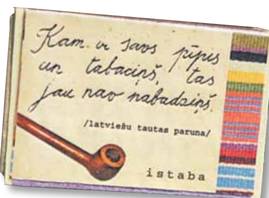
Uz etiķetes ir vieta arī pamācošiem dzejolišiem.