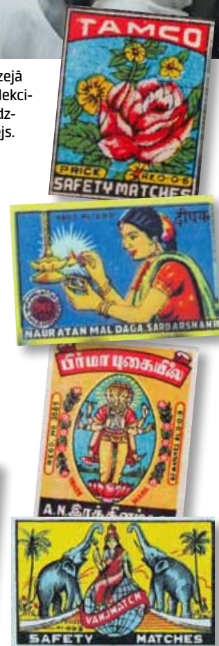
Izstādē uzreiz pamanāmas etiķetes no Indijas.