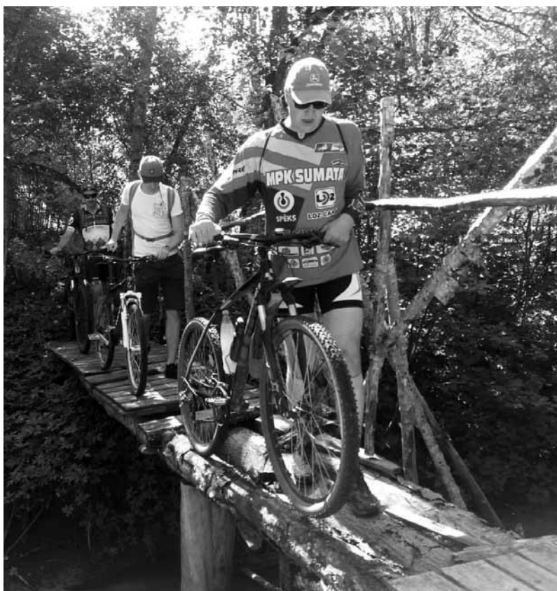
Velobraucēji brauca gan pa ceļiem, gan bezceļiem.