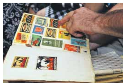
Jāņa Retēja kolekcijā ir etiķetes no 20. gs. vidus.