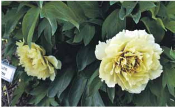
Dzeltenās peonijas, piemēram, šķirne 'Yellow Dream', apmeklētājiem bieži raisot vislielāko apbrīnu, jo tādas daudzi redz pirmo reizi.