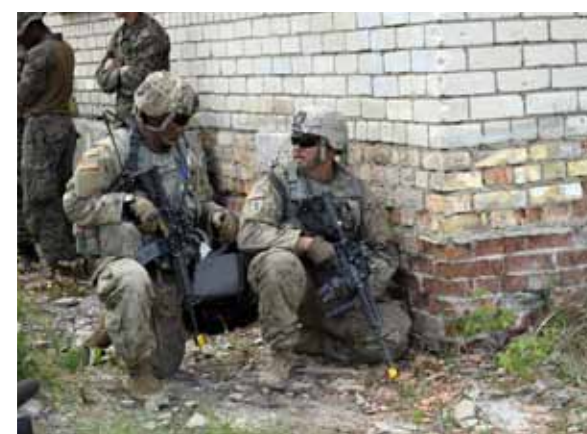
Amerikas armijas karavīri mācību brīdī.

Tur centīsimies demonstrēt pašgājēju artilēriju, ar kuru jāmācās rīkoties.”