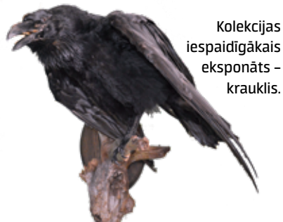
Kolekcijas iespaidīgākais eksponāts – krauklis.

Cilvēkiem, īpaši bērniem, par kolekciju esot interese. Tāpēc vairākus gadus kolektīvs Padure iesaistās Hercoga Jēkaba gadatirgū. „Pie eksponātiem daudzi fotografējas, uzdod jautājumus,” saka A.Lange. Viņaprāt, īpaši daudz mednieku ar putniem nekrāmējoties, jo tos izbāzt ir gana sarežģīti, turklāt diezgan dārgi. „Viena putna izbāšana maksā ap 70 eiro,” skaidro kolekcionārs.