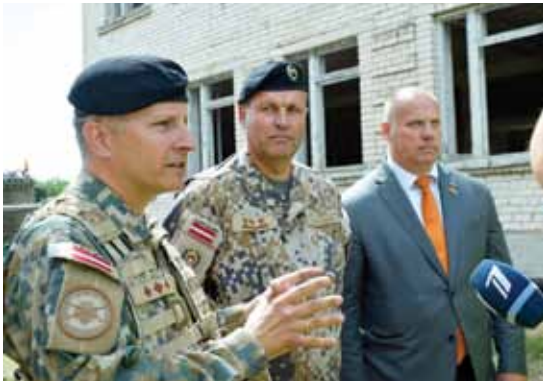
Sauszemes spēku mehanizētās kājnieku brigādes komandieris Ilmārs Lejiņš, Latvijas Nacionālo bruņoto spēku komandieris Leonīds Kalniņš un aizsardzības ministrs Raimonds Bergmanis.