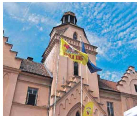
Ēdoles pils parkā Emīla gadatirgus karogs svētdienā pirms Jāņiem plīvo astoto gadu.