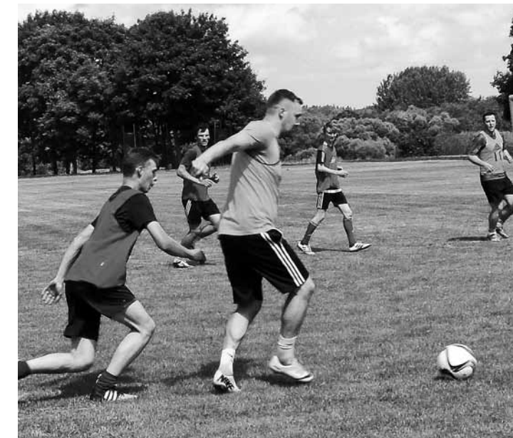
Karstais laiks netraucēja atcerēties skolas laiku un spēlēt futbolu.

Beigās visi kopā kavējās atmiņās par treniņos un sacensībās piedzīvoto.