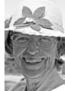
Liesma, bijusī skolotāja