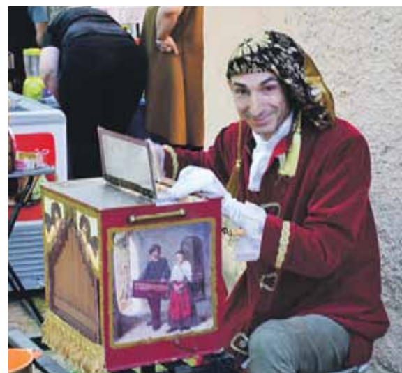
Kārtīgā tirgū neiztiek bez leijerkastnieka.