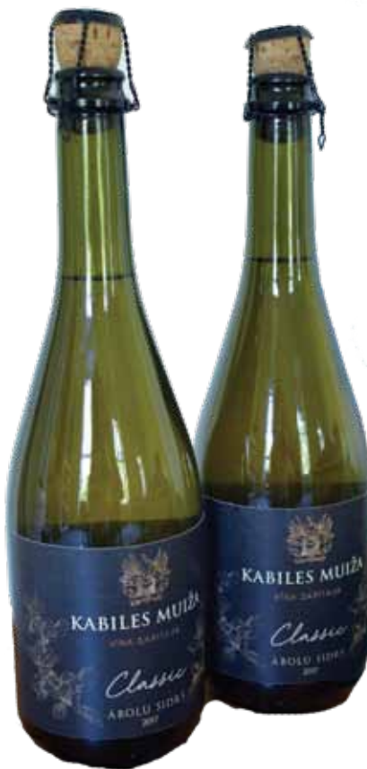
Šogad tautā palaista pirmā sidra partija.