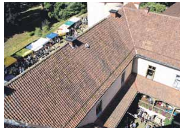
No pils torņa, kurā līdz pat pēcpusdienai netrūka gribētāju uzkāpt, rosība bija redzama gan pagalmā, gan apkārtnē.

„Agrāk bija tā: pils izsūca visu apkārtni – cilvēki tās labā strādāja un deva nodevas. Tagad ir otrādi: pils uzturēšana izsūc naudu no īpašnieka.”