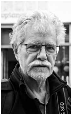
Väcietis Šūmana kungs parasti dodas ceļā bez ilgas domāšanas un priecājas par iznākumu.

Kuldīgu arī šovasar apmeklē tūristi no dažādām valstīm. Kurzemnieks sastapa krievus, vāciešus, poļus un japāņi. Viņi pilsētu sauc par skaistu, kaut gan bija paguvuši te būt tikai dažas stundas.