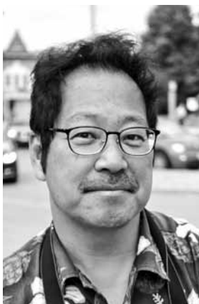
Japānis Masahiko jūtas apmulsis, ka Kuldīgā viņu pēkšņi uzrunā vietējais laikraksts.

Abi vīrieši ļoti vēlējas atrast Latvijā ražoto Abavas sidru . Viņi te palikšot vienu dienu, Kuldīgu vēl apskatīšot, un esot doma atbraukt vēl, viņi saka šķiroties.