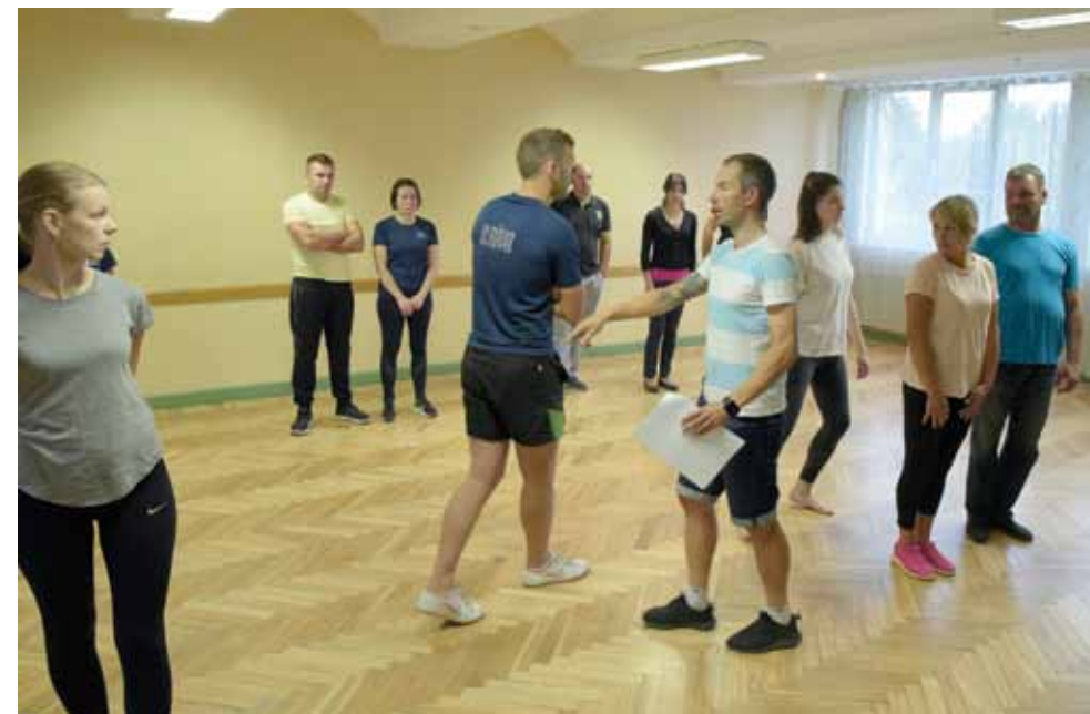
Vilgāles vidējās paaudzes kolektīvs Riva dosies uz saviem pirmajiem Deju svētkiem Rīgā. Šis ir viens no pēdējiem mēģinājumiem.

Kurmāles pagasta vidējās paaudzes deju kolektīvam Rīva šie būs pirmie Dziesmu un Deju svētki. Jaunie pašdarbnieki gatavojušies atbildīgi: gan deju soļi apgūti, gan tautas tērpi sagādāti.