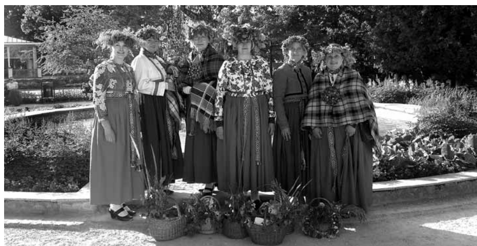
Basu suitu dalībnieces Rīgā, operas skvērā, pēc gājiena folkloras festivālā Baltica.