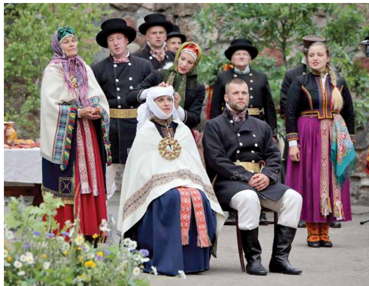
Emocionālā mičošanas epizode, kurā meitai noņem linkaini – īpašu līgavas galvassegu virs vainadziņa.