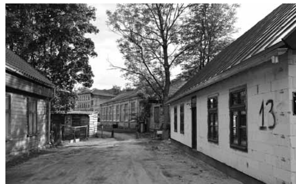
Oficiāli iela stiepjas līdz krustojumam ar Dzirnau ielu, bet faktiski beidzas pie 6. numura (vienīgās mājas kreisajā pusē) un tikko pārbūvētā 13. nama.