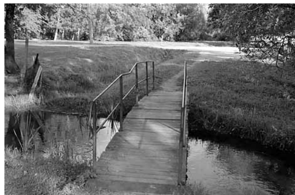
Tā nav vienkārša laipa, bet gan tiltiņš pāri Alekšupītei vietā, kur senāk bijusi Māras iela, kas savieno tagadējo Leona Paegles un Dzirnau ielu.