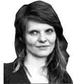
Maija Jankovska, tālr. 63323021, redakcija@ kurzemnieks.lv

Pagājušajā nedēļā Cēsīs, sarunu festivālā Lampa , bija pulcējušies vairāk nekā 16 000 pēc saturīgām diskusijām izslāpušo, lai apspriestu neiedomājami plašu tēmu loku, sākot no lokālām aktualitātēm, beidzot ar globālām problēmām. Festivāla virstēma šogad bija uzticēšanās.