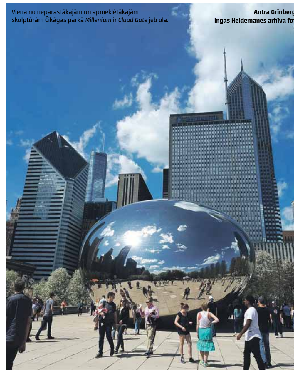
Viena no neparastākajām un apmeklētākajām skulptūrām Čikāgas parkā Millenium ir Cloud Gate jeb ola.