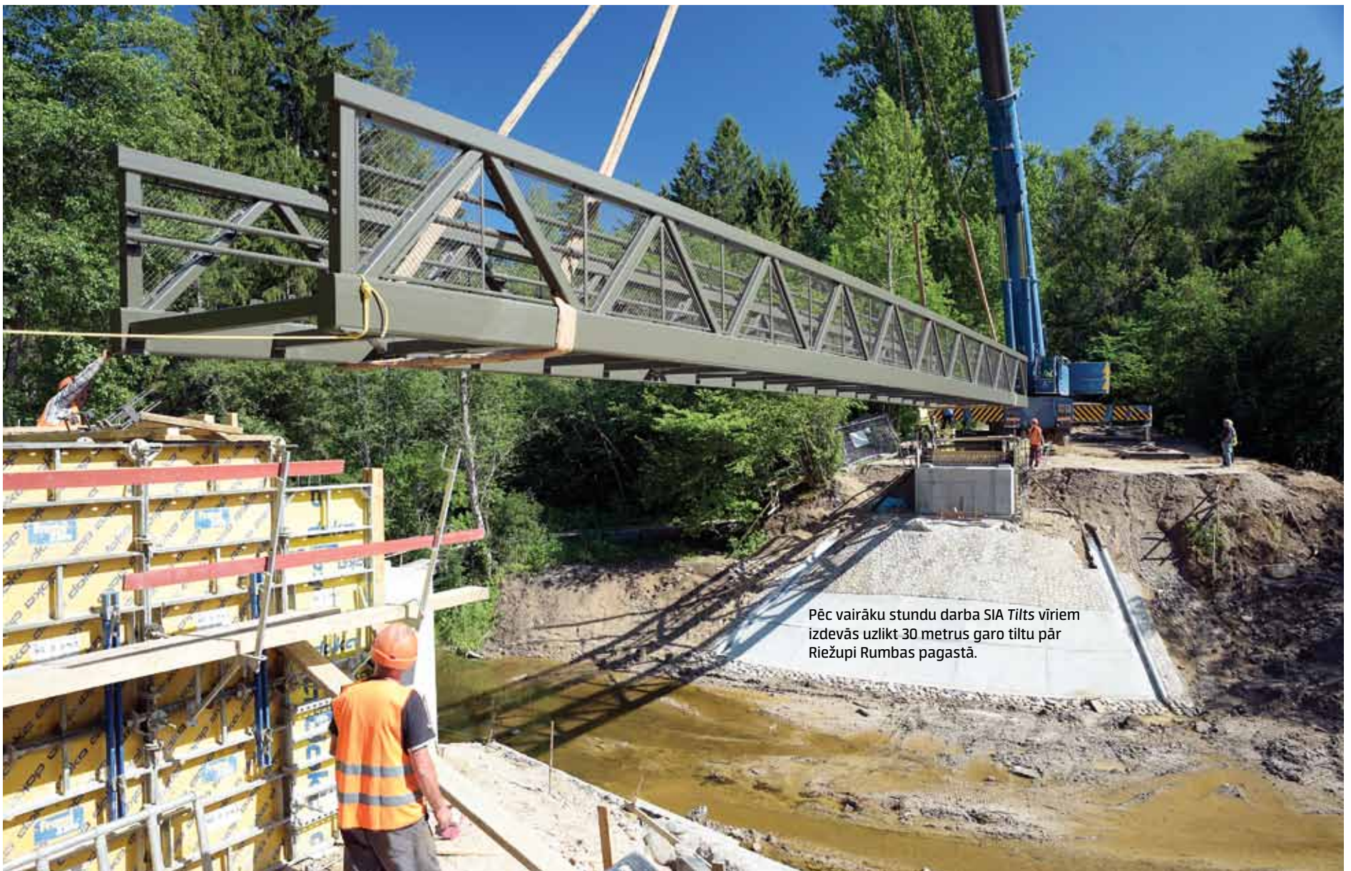
Pēc vairāku stundu darba SIA Tīlts vīriem izdevās uzlikt 30 metrus garo tiltu pār Riežupi Rumbas pagastā.

Pēc smaga darba 4. jūlija vēlā pēcpusdienā SIA Tīlts vīriem izdevās uzlikt 30 metrus garo gājēju un velobraucēju tiltu pār Riežupi Rumbas pagastā.