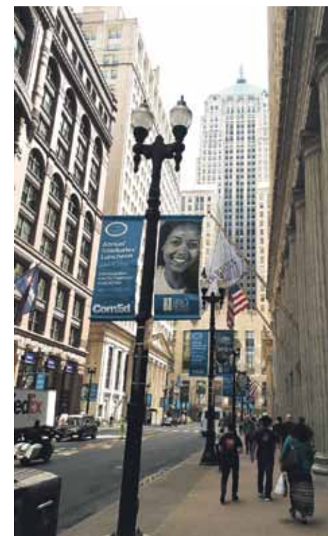
Klasiska iela Čikāgā, ko kuras pavērsas skats uz vienu no neskaitāmajiem debesskrāpjiem.