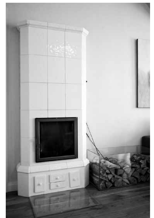
Somu krāsnij blakus novietota pamatīga stikla kaste, kas ir ugunsdroša un nodar malkas glabāšanai.

Mazā, zaļā franču krāsns rada senatnīgu noskaņu.