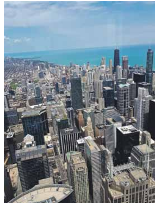
Skats no Vilisa tornā, kas līdz 1998. gadam bija augstākā ēka pasaulē (442 m).