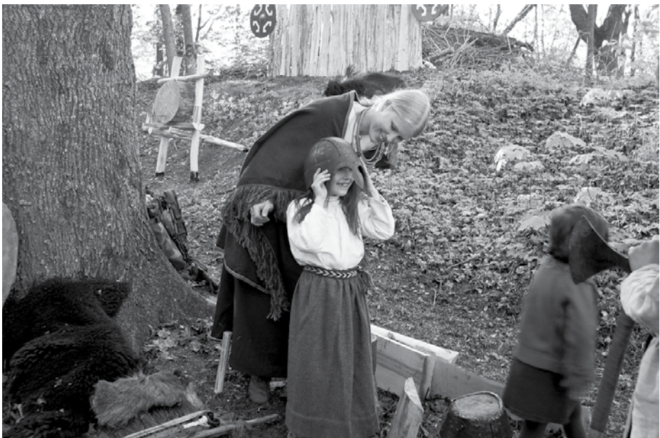
Popularizējot Latvijas senāko vēsturi Mežotnes pilskalna svētkos Bauskas novadā.

Lai arheologs var atradumu datēt, tiek pētīta priekšmetu tipoloģija, veidotas tabulas, lai noteiktu dažādu periodu atšķirības. Ja nebūtu šādu pētījumu, kas kādam varbūt šķiet garlaicīgi, mēs nespētu rekonstruēt konkrēta perioda vēstures ainu. Datēšana ir viens virziens, bet man interesēja jostas nozīme, valkāšanas ieradumi. Pēc jostu fragmentiem apbedījumos var pateikt, kā tā valkāta, kas pie tās stiprināts, jo kabatu tad nebija – priekšmetus stiprināja pie jostas. Interesē viss apģērba kontekstā, jo tas bija sabiedrības spogulis – par valkātāju sniedza ļoti daudz ziņu.