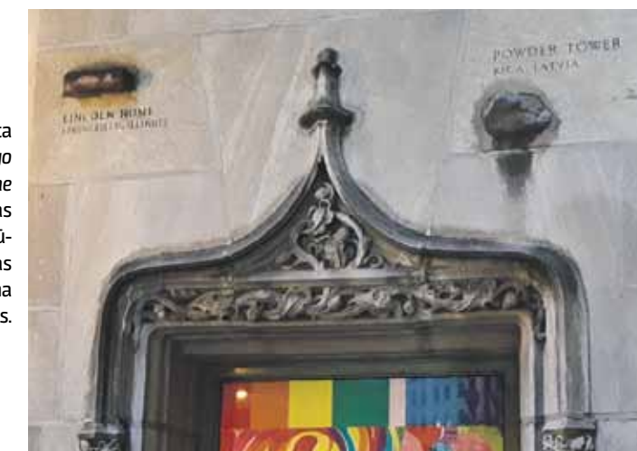
Laikraksta Chicago Tribune redakcijas ēkā iemūrētais Rīgas Pulvertornā akmens.