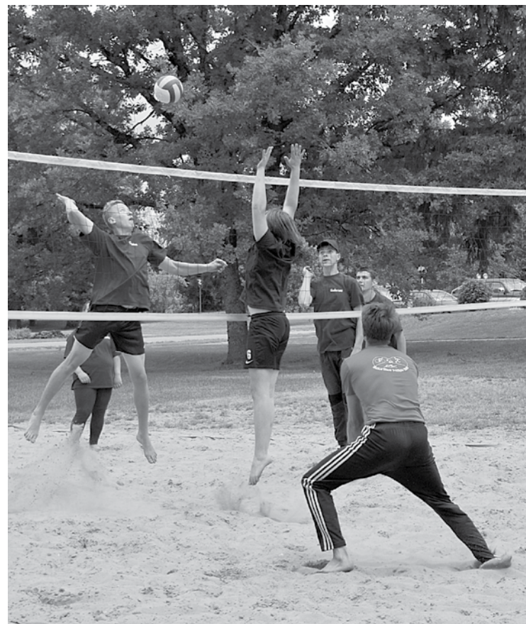
Volejbolā tiekas Gudenieku komanda Super Klas un Skrundas komanda Pēdējā cerība .