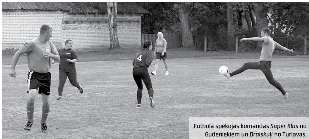
Futbolā spēkojas komandas Super Klas no Gudeniekiem un Draiskuļi no Turlavas.