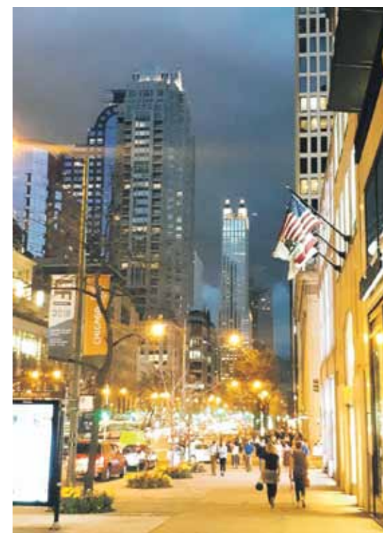
Uzreiz pēc ierašanās Čikāgā Inga ar draudzeni devās naksnīgā pastaigā pa Mičiganas avēniju.