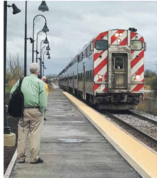
Visas dzelzceļa stacijas ir vienādas – antīkas laternas, mazi peroni un gadu desmitiem nokalpojuši vilcieni, kas pie tiem pierīti.