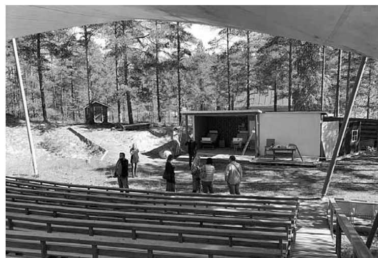
Skatuve, uz kuras Eskolas ciema iedzīvotāji rāda amatiereteātra izrādes. To ienākumi tiek nodoti viedā ciema vajadzībām. Attēlā – Latvijas grupa, kas viesojas Somijā.

saviem ieskatiem. Pērn par tādu atzīta spēle izlaušanās istabā ( Escape Room ), kas balstīta Somijas vēsturē.