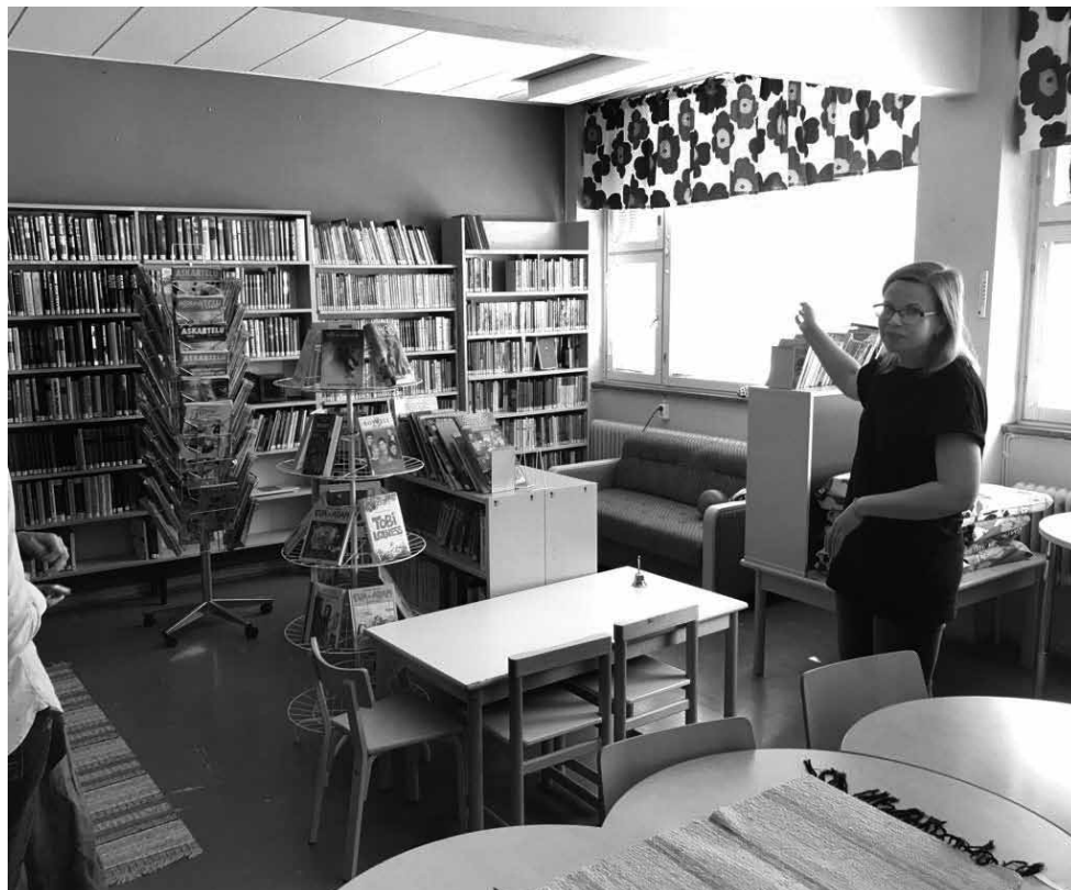
Kopienas pakalpojumu projekta vadītāja Eskolas ciemā Somijā rāda iedzīvotāju iekārtoto klasi, kurā šogad mācīsies 11 dažāda vecuma sākumskolas bērni.

las ciema iedzīvotāji nodibinājuši biedrību, kas raksta projektus. Ciema attīstībai tā nopelna arī ar amatiereteātra izrādēm, kurās iesaistās vietējie. Uz tām tiek pārdotas biļetes, kuru cenā ietilpst arī ēdienreize, un vasarā notiek 10–13 izrādes. Katru apmeklējot ap 300 skatītāju. Pirmsskolas vecuma bērnu pieskatīšanas centrā kopš 2015. gada viens darbinieks ir brīvprātīgais no Spānijas programmā Erasmus .