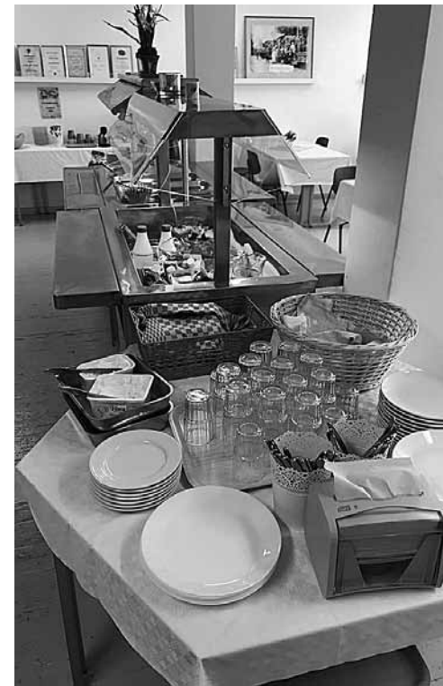
Viena ideja, kas realizēta viedajā ciemā – uzņēmuma Eskolas ciema pakalpojumi izveidots vienkāršs pusdienu restorāns, kurā tiek piedāvāts veselīgs ēdiens.

Lauku apgabali, kas balstās savās vērtībās un stiprajās īpašībās. To pamatā ir cilvēki – kopienas, kas uzņemas iniciatīvu un meklē praktiskus veidus, kā novērst problēmas, maksimāli izmanto jaunas iespējas sava apvidus izaugsmei.