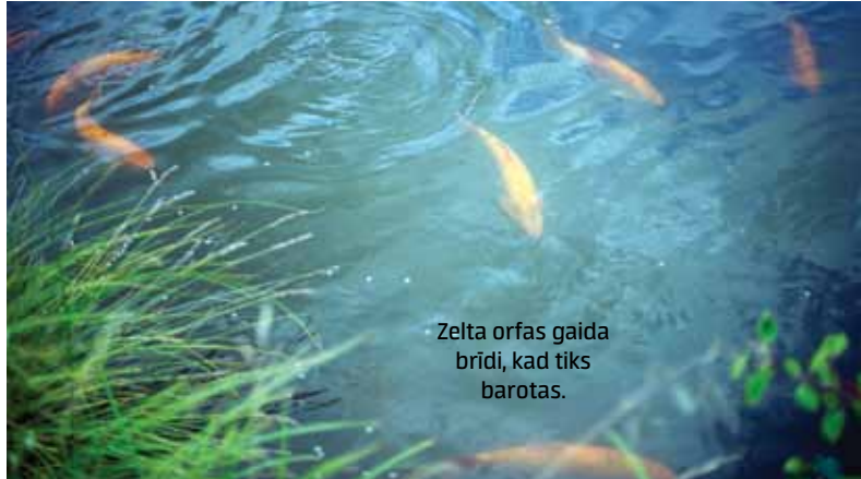
Zelta orfas gaida brīdi, kad tiks barotas.