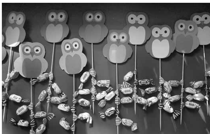
Bērnu darbi – Rudās pūces vasaras skolas simbols.

Rudbāržu nometnes rīta aplī bērni iepazīs, pastāstīja, kas viņus interesē.