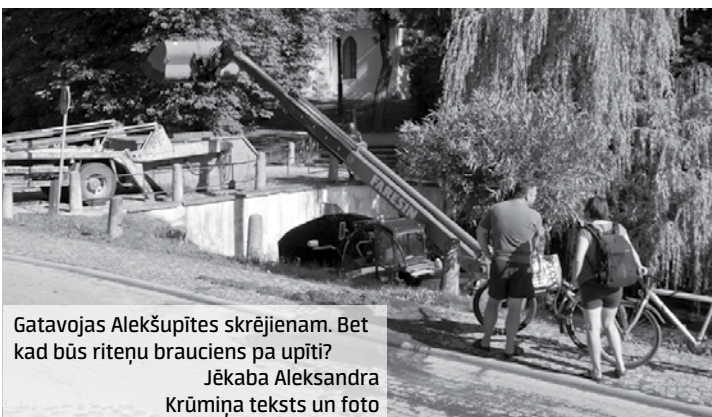
Gatavojas Alekšupītes skrējienam. Bet kad būs riteņu braucienis pa upīti? Jēkaba Aleksandra Krūmiņa teksts un foto

Kurzemnieks Kuldīgā, 1905. gada ielā 19, LV-3301 Izdevējs – SIA Jaunais kurzemnieks . Reģ. apl. nr. 1400. Iznāk pirmdienās, trešdienās, piektdienās. Pārpublicējot atsauce uz Kurzemnieku obligāta. Iespējamais SIA Poligrāfijas grupa Mūkusalas, Rīgā , Mūkusalas ielā 15a. Metiens – 3372.