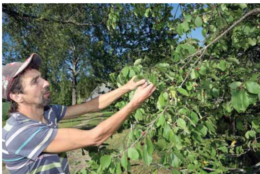
Visa tirgus produkcija ir jāsalasa un jāpagatavo iepriekšējā vakarā, jo no rīta to izdarīt nav iespējams.