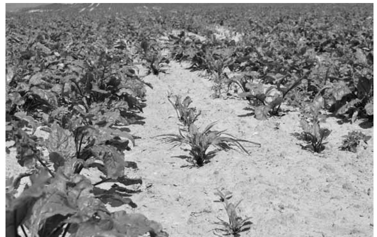
Pateicoties laistīšanai, Garīšos viss aug, bet tur, kur ūdens nav ticis klāt, var redzēt, kā būtu tad, ja laukus nevarētu laistīt.