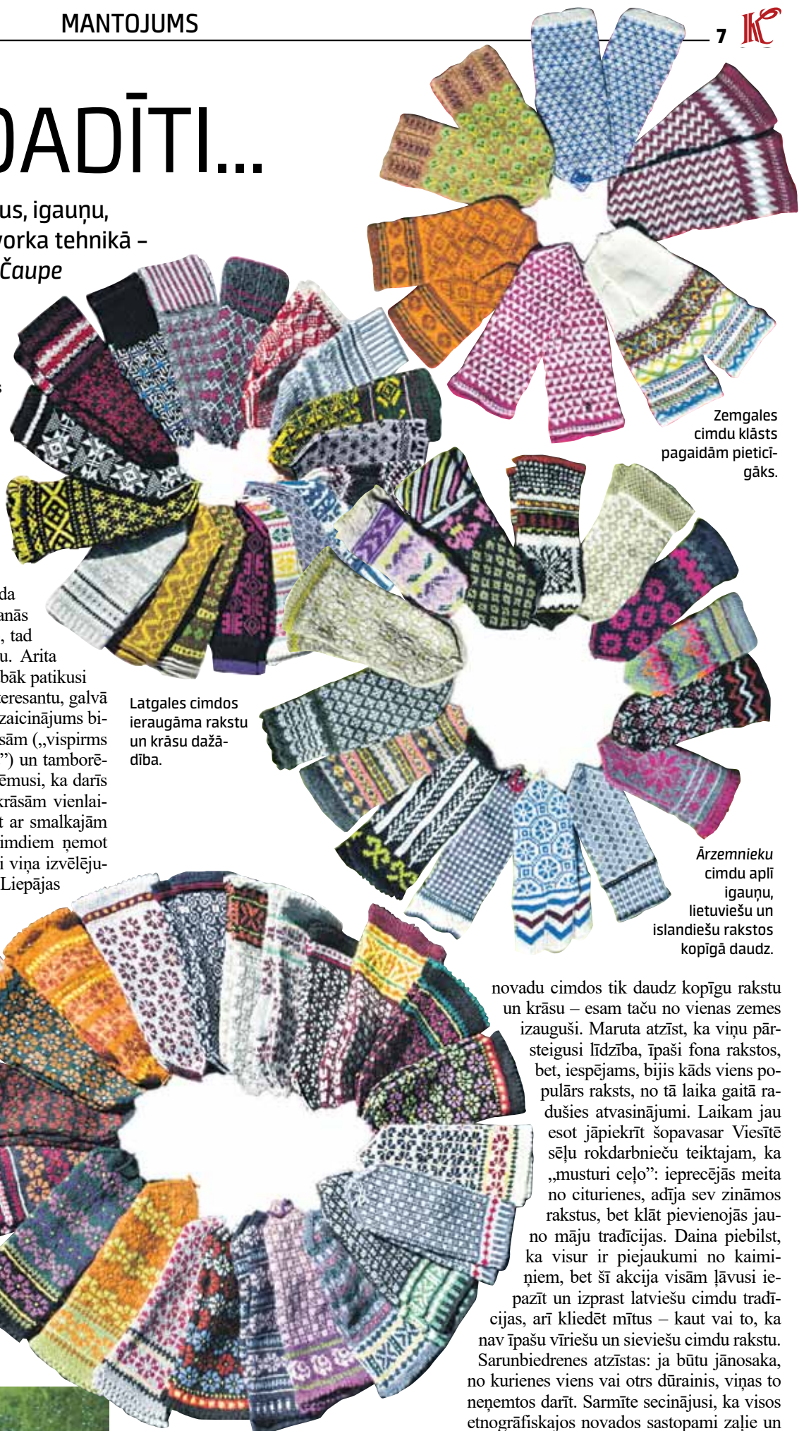
Zemgales cimdņu klāsts pagaidām pieticīgāks.

Izaicinājums bijis adīt neparastajā pečvorka teh-