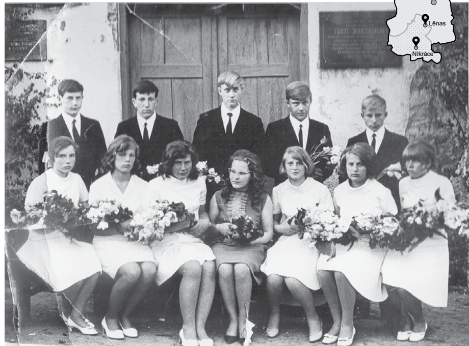
Daigas Brūveres pirmā izlaiduma klase 1969. gadā.

Ik gadu kolektīvs pirmajā skolas dienā un valsts svētkos atcerējās par Otrajā pasaules karā kritušo karavīru atdusas vietu jeb, kā Nīkrācē saka, Varoņu kapiem un uzņēmas šefību, tos kopjot.