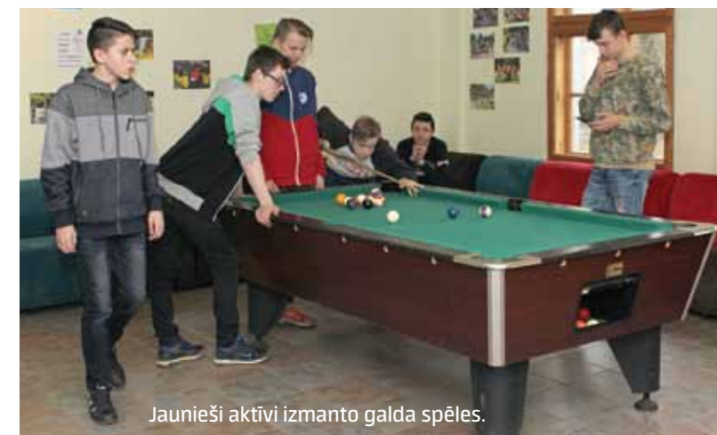
Jaunieši aktīvi izmanto galda spēles.

Šī māja domāta pusaudžiem un jauniešiem no 13 līdz 25 gadiem. Notiek izglītojoši, karjeras attīstības un atpūtas pasākumi, tiek atbalstīta jauniešu iniciatīva. Te ikviens var būt aktīvs, lietderīgi pavadīt laiku un palīdzēt dažādot sabiedrisko dzīvi.”