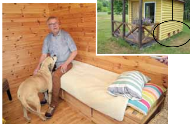
Bišu dziedinātava ir mājiņa, kurai vienā sienā iebūvēti bišu stropi, bet iekšpusē virs tiem iekārtota gulta.