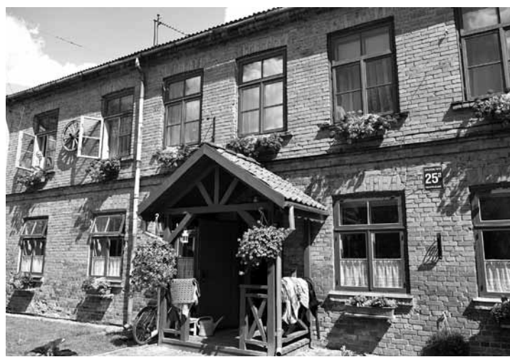
Liepājas ielā 25a puķes zied pie katra loga.