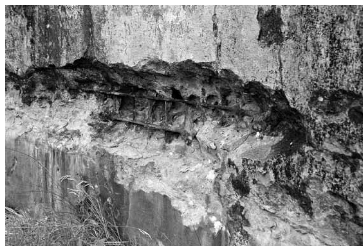
Laika zobs jau papostījis dzelzsbetona būves.