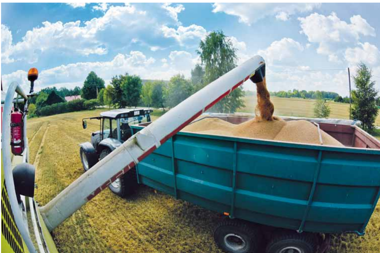
Tāpat kā citur arī Vilgāles Reķos graudaugu kulšana rit pilnā sparā.

„Šogad graudaugu kulšana ir sākusies necerēti agri. Parasti uz lauka var braukt augusta sākumā. Arī mitruma procents šogad labs – 13 līdz 15%, bet graudu birums uz pusi mazāks nekā pagājušajā gadā,” tā par šīgada ražu teic Vilgāles zemnieku saimniecības Reķi īpašnieks Aivars Reķis.