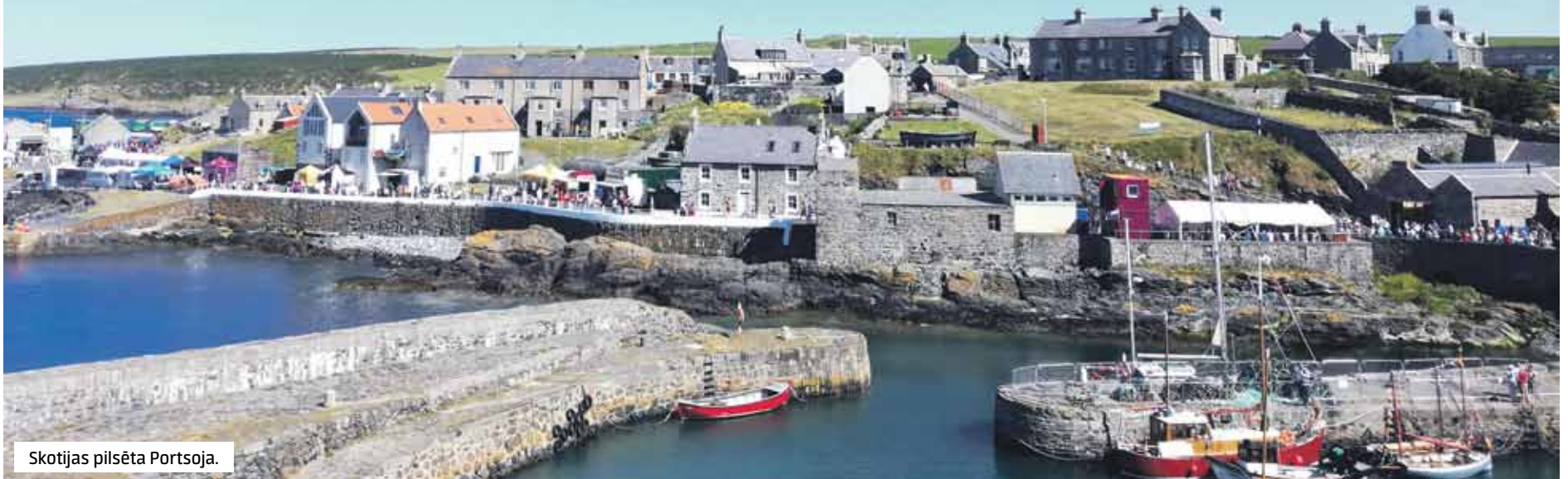
Skotijas pilsēta Portsoja.

Kuldīgas, Alsungas un Skrundas amatniekiem bija iespēja ar savu veikumu iepazīstināt Skotijas pilsētas Portsojas (Portsoy) iedzīvotājus un viesus, kuri jūnijā apmeklēja laivu festivālu, kas šajā pilsētā notika 25. reizi.