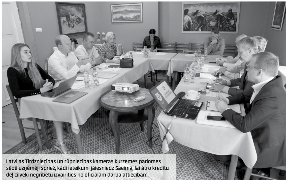
Latvijas Tirdzniecības un rūpniecības kameras Kurzemes padomes sēdē uzņēmēji spriež, kādi ieteikumi jāiesniedz Saeimā, lai ātro kredītu dēļ cilvēki negribētu izvairīties no oficiālām darba attiecībām.

Sēdē arī runāts par to, ka jāuzlabo e-veselības tehniskie risinājumi. LTRK priekšlikums