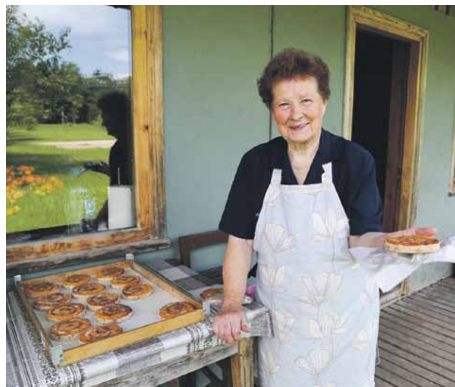
Recepti saimniece ir aizguvusi no senčiem, bet laika gaitā tā nedaudz pamainījusies.