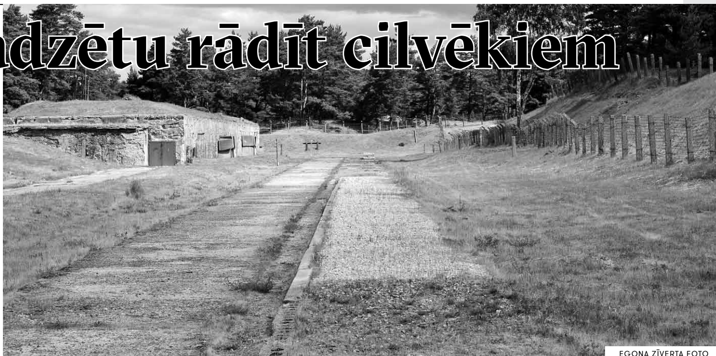
Šajā vietā gar krasta artilērijas bateriju no Karostas reiz bija dzelzceļa sliedes.