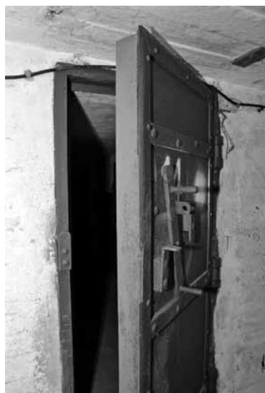
Kaltās durvis, eņģes un cits aprīkojums ir unikālas vērtības. Tāpēc objektu rūpīgi apsargā.