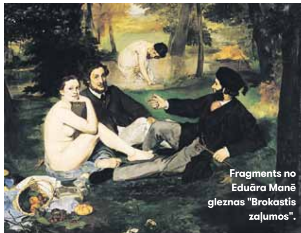
Fragments no Eduāra Manē gleznas "Brokastis zaļumos".

Jaņa Rozentāla Saldus vēstures un mākslas muzeja rīkotajiem muzikālajiem svētdienas rītiem dots franču impresionista Eduāra Manē gleznas "Brokastis zaļumos" (Le Déjeuner sur l'herbe) nosaukums.