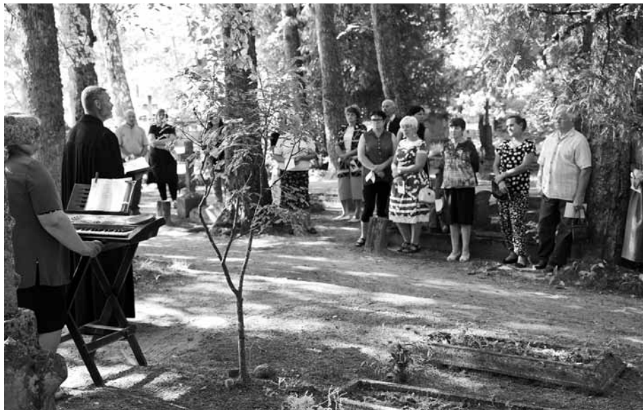
Mirkļis no aizgājušo piemiņas brīža Zvinguļu kapos Īvandē.

Kapu svētki arī mūsu pusē ir kļuvuši par tradīciju. Katru gadu pieminam savus tuviniekus un draugus, satiekam attālāk dzīvojošus paziņas un radus.