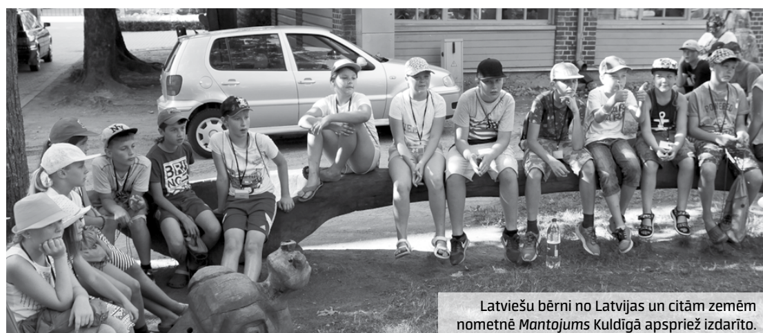
Latviešu bērni no Latvijas un citām zemēm nometnē Mantojums Kuldīgā apspriež izdarīto.

Bērni gleznoja Ventas rumbu un tiltu, un katrs savu darbu varēja ņemt līdzi uz mājām kā suvenīru. Labprāt mācījušies cept sklandraušus, tomēr pašu izceptais visiem neesot garšojis. Cita lieta bija kopā ceptās picas, smalkmaizītes un