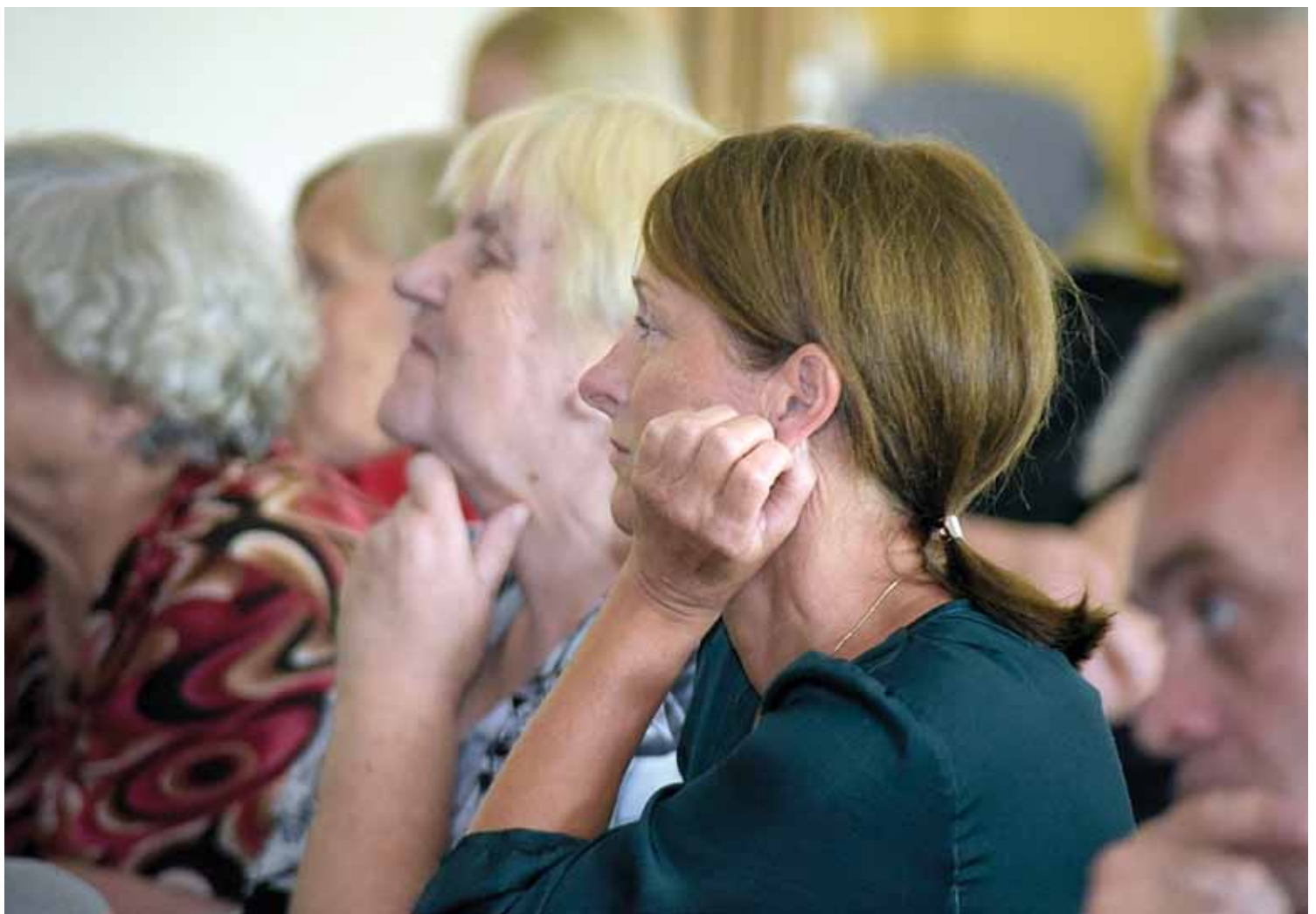
Alsungas iedzīvotāji ar bažām uzklausa Neatliekamās medicīniskās palīdzības dienesta pārstāvjus.

„Iedzīvotājus uztrauc attālumš, kādu nāksies naktī braukt ātrās palīdzības mašīnai. Tā tiešām ir drošības izjūta, ja mašīna ir tepat, uz vietas, bet ir daudz situāciju, kurās arī mūsu mašīna ir aizbraukusi kur