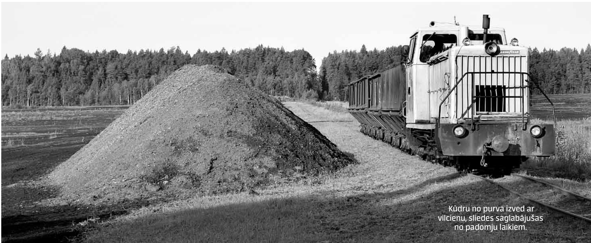
Kūdras no purva izved ar vilcienu, slīdes saglabājušas no padomju laikiem.