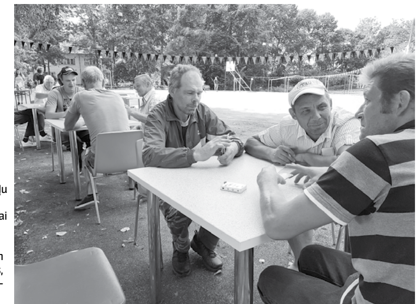
Šīgada spēļu jaunums bija zolīte, lai vīriem, kuri bieži vien sēž malā un vēro spēles, būtu interesantāk.