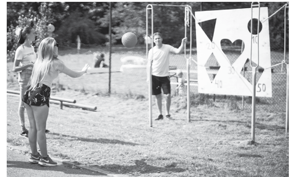
Disciplīna Trāpi mērķi bija netradicionāla nodarbe, kas pulcēja daudzus interesentus.