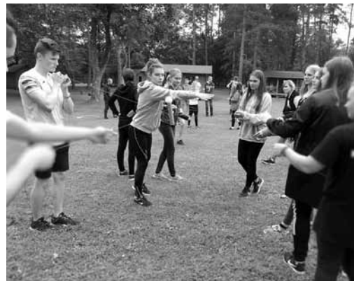
Rendas pagasta kempingā Usmas Meķi nedēļu notiek Kuldīgas novada un Panevėžas (Lietuva) jauniešu nometne, kurā tiek muzicēts, spēlētas spēles un kopīgi pavadīts laiks.

Rīt 19.00 Rendas estrādē notiks Kuldīgas un Paņevēžas jauniešu koncerts .