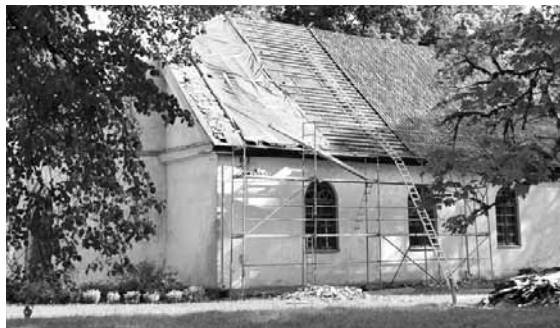
Rendas baznīcas jumta remonts ir pusē.

Šovasar notiek Rendas baznīcas dakstiņu jumta nomaiņa, būvdarbus veic Kuldīgas komunālie pakalpojumi .