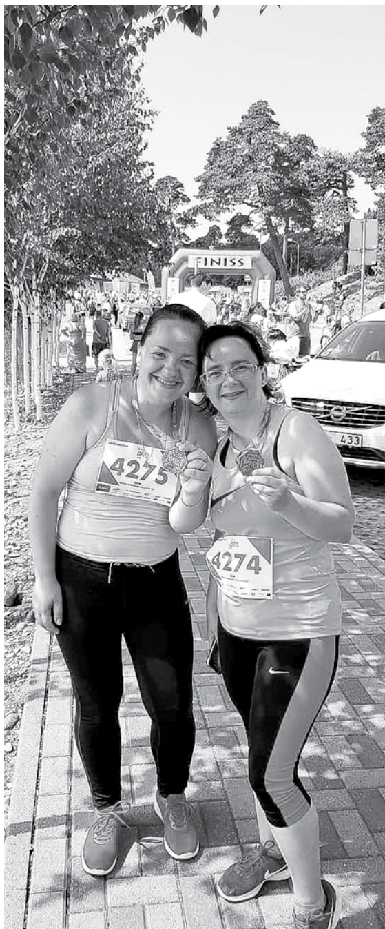
Jūnijā Ventspilī kopā ar māsu laimīgi noskriet 5,3 km.