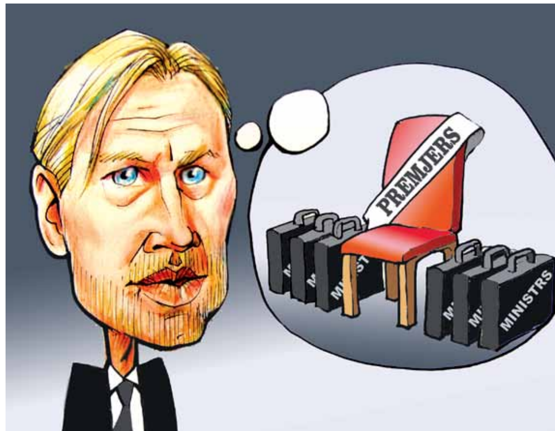
Viņa Bulava karikatūra

Lai cik sliktā būtu jūsu izvēle, vienmēr labāk ir balsot, nekā nepiedalīties vēlēšanās un ļaut, lai Latvijas likteni izlemj bez jums. Latvijai ir vajadzīgs lielāks iedzīvotāju procents, kas apzinīgi piedalās vēlēšanās. Parunājiet ar domubiedriem, ģimenes lokā un tad pieņemiet lēmumu!