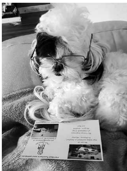
Šis no Velsas dzimis Jelgavā.