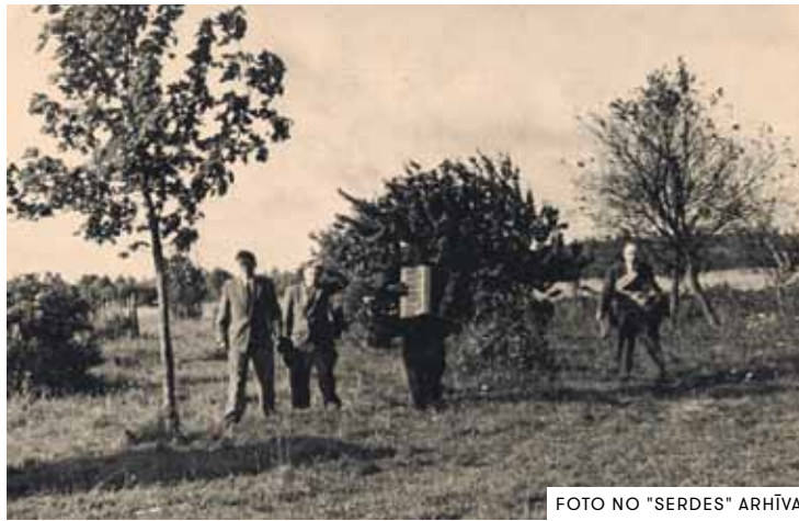
Muzikanti Lēnās pie Skrundas.