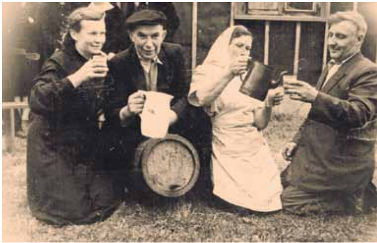
Svinētāji zaļumos Jūrkalnē.