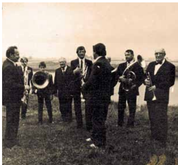
Slavenie Piltenes prāģeri.