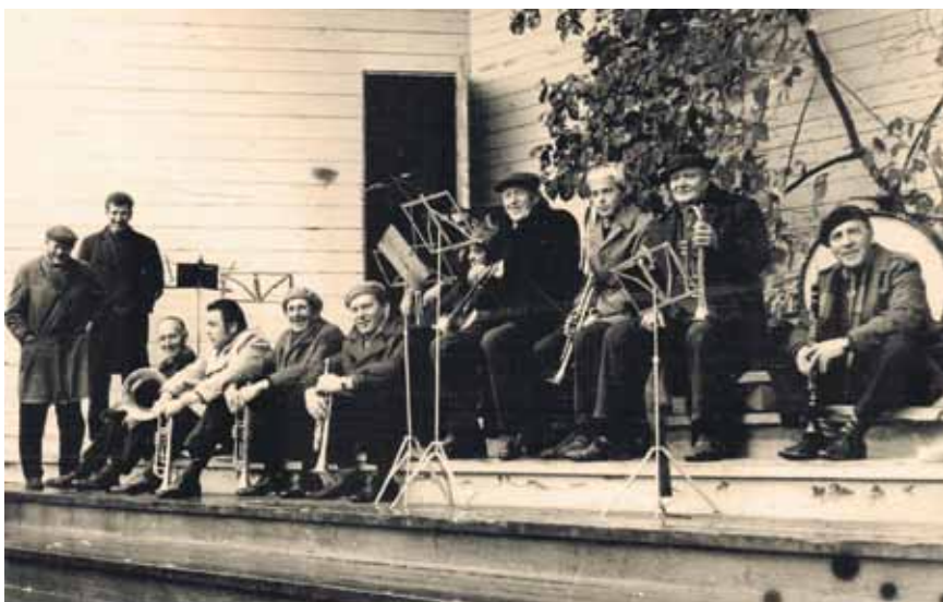
Zaļumballe Misiņkalnā Aizputē.