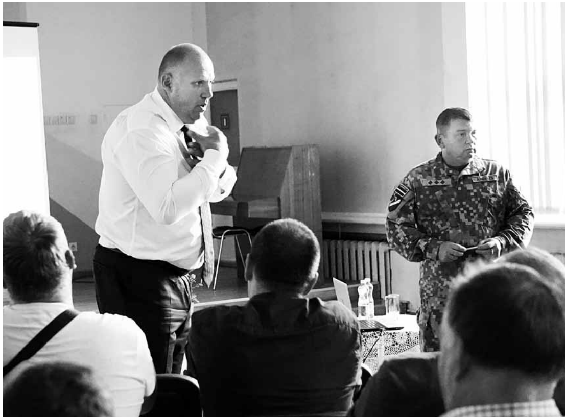
Aizsardzības ministrs Raimonds Bergmanis skaidro, ka poligona paplašināšana nozīmē arī darba vietas iedzīvotājiem.

R.Bergmanis atbildēja, ka par īpašnieku interesēm varot iestāties,