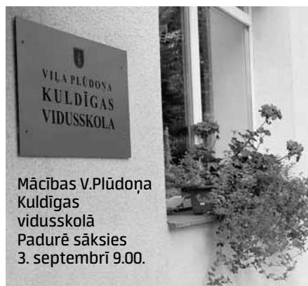
Mācības V.Plūdoņa Kuldīgas vidusskolā Padūrē sāksies 3. septembrī 9.00.

Bijusī Kuldīgas Alternatīvās sākumskolas Padures filiāle jauno mācību gadu Deksnē sāks kā V.Plūdoņa Kuldīgas vidusskola.