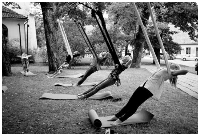
Jaunajā pasākumā ģimenei Eko, eho, etno Kuldīgā, Pilsētas dārzā, svai-gā gaisā varēja izmēģināt gaisa jogu.