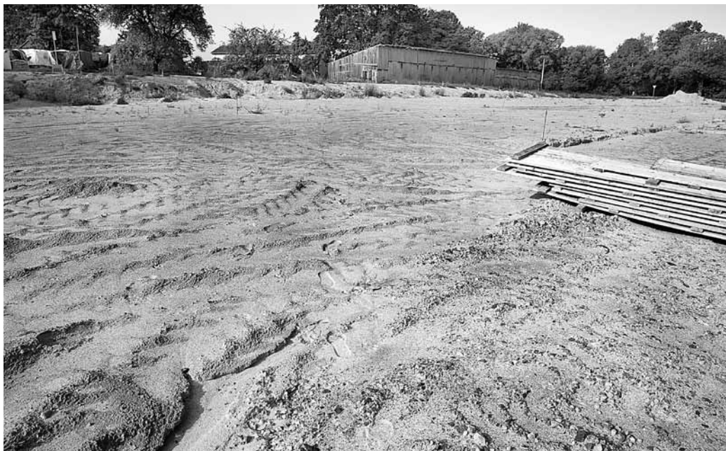
Šeit būs uzņēmuma jaunā galdniecība. Padomju laiku šķūņi pārtaps par noliktavu, bet pamestajā mājā būs dzīvokļi darbinieku ģimenēm.

brauktuves līmeņa. Kad pauguru noraksim, varēsim māju atjaunot, lai darbiniekiem ir dzīvokļi. Svarīgi, lai cilvēki grib nākt šurp dzīvot un strādāt. Būtiski, lai centrs kļūst pievilcīgs. Jau esam novākuši katlumājas graustu.” Uzņēmējs skaidro: kad būs uzcelta jaunā galdniecība, atjaunota tiks arī vecā ēka. „Tur divos stāvos ir 16 telpas – tā nav ražošana, tā ir pagātne.”