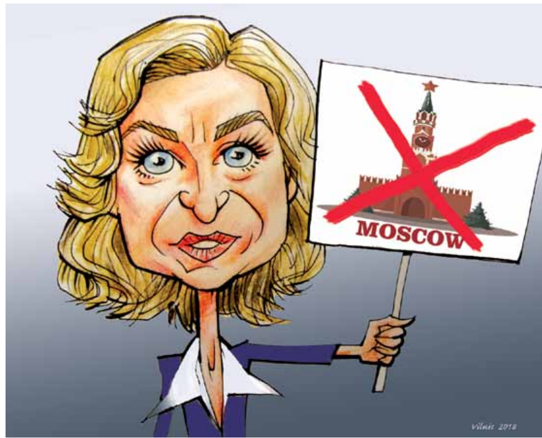
Viņa Bulava ierīkātūra