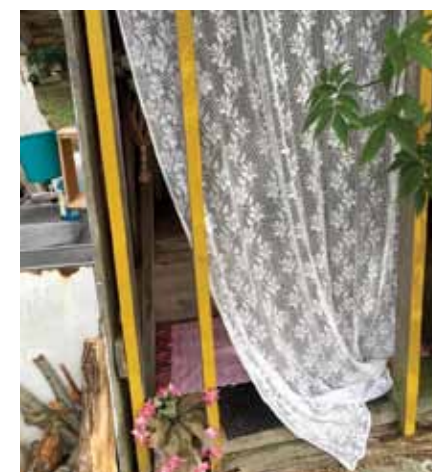
Seti pārāk nesatraucas, ja ērtības nav kā Eiropā. Improvizēta sirsniņmājiņa ar ažuŗiem aizkariem.