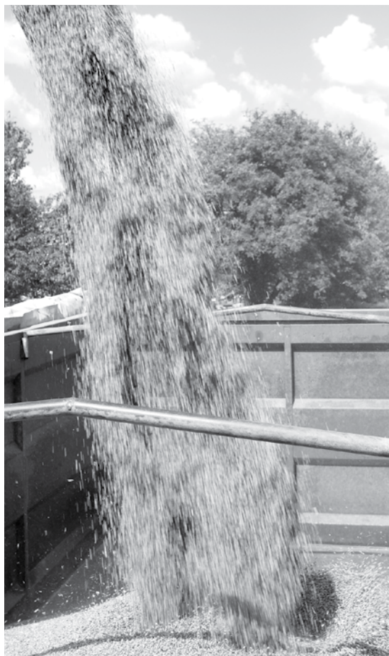
Šogad Kurzemē gan ziemājiem, gan vasarājiem nokulta tikai trešdaļa no tā, ko zemnieki plānoja.

Šī vasara zemkopjiem bija atkal viens pamatīgs pārbaudījums – labības raža ļoti maza, toties kvalitāte laba un iepirkuma cena augstāka, tomēr kopējos zaudējumus tas nespēj kompensēt.