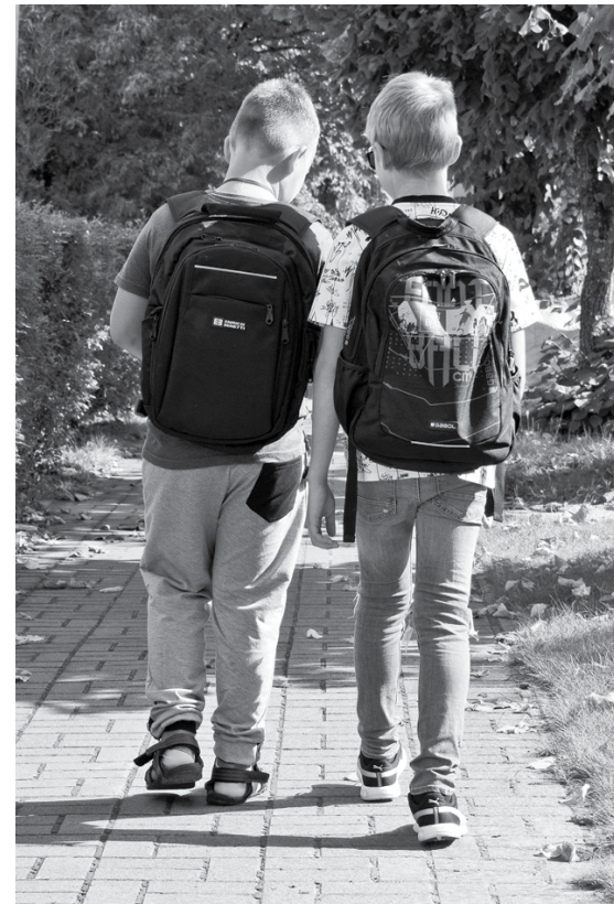
Kopā ar mācību piederumiem skolas somas sveram nevajadzētu pārsniegt 10% no bērna svara.