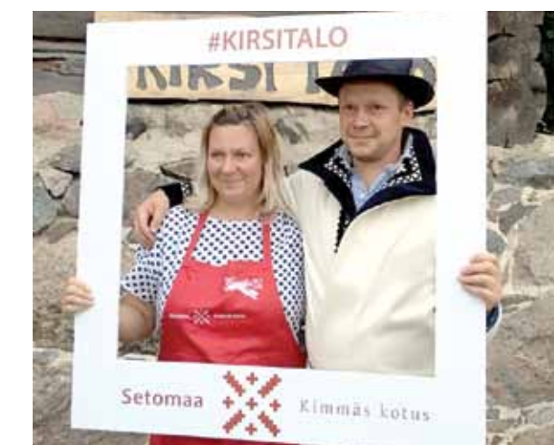
Arī Kaidi Kerdtā no pilsētas atgriezies senču vecsaimniecībā Kīrsi un ar pietāti atjauno visu, kas saglabājams no setu arhitektūras. Tur ierīkota viesu māja. Ēdieni ir no vecmāmiņas pūra: setu grūbi biežputru ar kartupeļiem, siers, zupa un plātsmaizes. Saimnieks cienāja ar mājas darinājumu handžu, kas tā pati kandža vien ir.