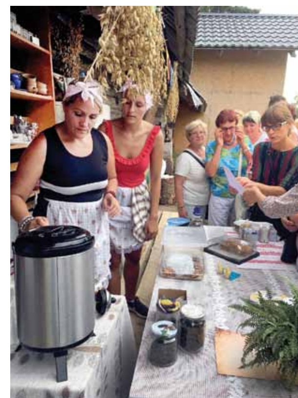
Metsiku kafejnīcā – biežpiena plāceniši un eļļā vāritas biežpiena bumbiņas, var dabūt arī soļanku u.c. ēdienus. Īpaši šai dienai no malkas pagalēm un dēļiem sētā uzcelti improvizēti galdi.