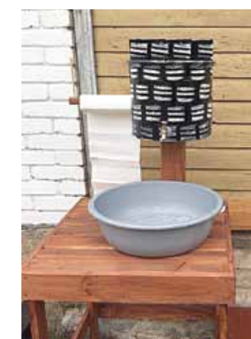
Kafejnīcu apmeklētājiem daudzviet pagalmā ierīkota roku mazgāšanas vieta. Šī – Mikitamē ciematnīņā.