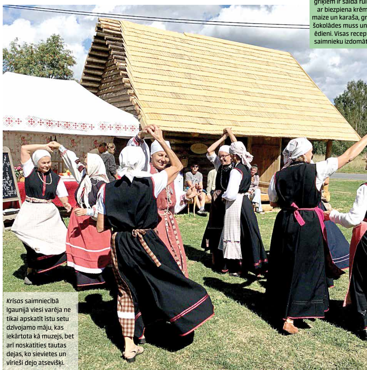
Krišas saimniecībā Igaunijā viesi varēja ne tikai apskatīt istu setu dzīvojamā māju, kas iekārtota kā muzejs, bet arī noskatīties tautas dejas, ko sievietes un vīrieši dejo atsevišķi.