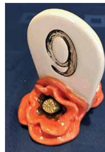
Kafejnīcā Magonite šie ziedi ir visur: uz sienām, galdaudaiem, saimnieču priekšautiem un pat salvešu turētājiem.