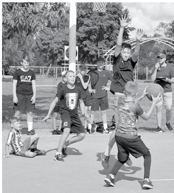
Minibasketbolā spēkiem mērojas komandas Ēdole un KFK .