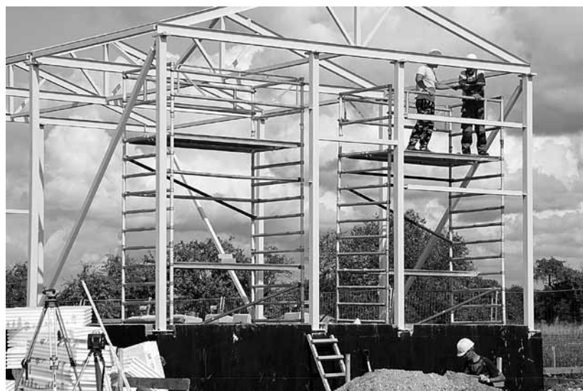
Skrundā Sadales tīklam tiek būvēta jauna apakšstacija, lai elektroapgāde ir drošāka un tās pārtraukumi – īsāki. Ēku paredzēts nodot līdz gada beigām.

Kuldīgas novadā elektrotīkla rekonstrukcija šogad norit Turlavas, Vārmes, Rendas, Laidu, Ēdoles, Kabiles un Pelču pagastā, informē ST pārstāve Tatjana Smirnova. Laidos vidējā sprieguma tīklā tiek ierīkots tāds jaudas slēdzis, kas personālam ļaus elektrotīklu vadīt un pārslēgumus izdarīt no attāluma, klientiem samazinot pārtraukuma laiku. Turlavā tīkls tiek pārbūvēts Klosteres apkaimē, kur plānots atjaunot 3,9 km vidējā sprieguma 20 kV (kilovoltu) gaisvadu līnijas, 5,5 km zemsprieguma 0,4 kV gaisvadu līnijas pārbūvēt par kabeļu līnijām, uzcelt četras un pārbūvēt vienu apakšstaciju. Ēdolē pie Kauliņupes 1,7 km zemsprieguma gaisvadu vietā būs kabeļi. Tiks pārbūvēta viena un uzceltas divas jaunas apakšstacijas. Rendā plānots rekonstruēt 3,2 km zemsprieguma līnijas un uzcelt jaunu apakšstaciju. Kabiles centrā 4,7 km zemsprieguma gaisvadu līnijas tiek pārveidotas par