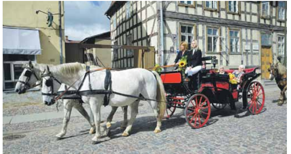
Balto zirgu vilkto puskarieti Kuldīgas ielās garāmgājēji sveica, smaidot un mājot ar roku.