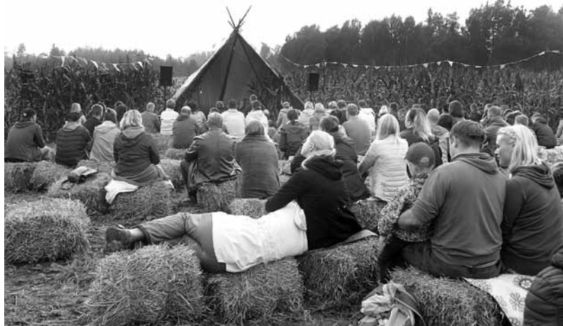
No malu malām atbraukušie klausītāji gumijas zābakos pēc koncerta lauka vidū tika arī cienāti ar pankūkām, augļiem un kafiju.

Šo atrakciju Laidu pagasta biedrība Kopā cits citam rīko otro gadu, bet K. Kazāks šaipusē divreiz jau viesojies: Lieldienu labdarības koncertā Valtaiku baznīcā un Grigaļos pasākumā Skrundas kultūras darbiniekiem.