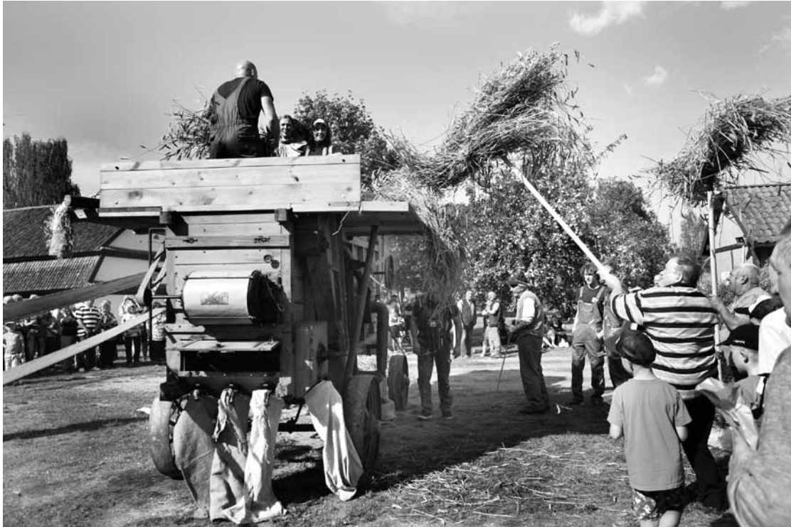
Jautrajā mašīntalkā Padūrē trešo reizi iedarbināta atjaunotā kuļmašīna Imanta.

Tur var redzēt īstu kuļmašīnu, notiek gadatirgus, izstādes, radošās darbnīcas un koncerti. „Kuļmašīna tiek darbināta trešo gadu. Vienmēr ciemos ir tuvākie pašdarbnieki, šoreiz arī teātris no Šķēdes. Darbniču ir vairāk nekā citus gadus. Tirgotāji ierodas gan no mūspuses, gan Liepājas un Sabiles. Gribētos cerēt, ka apmeklētāju mašīnas drīz stāvēs līdz pat Ventspils šosejai.”