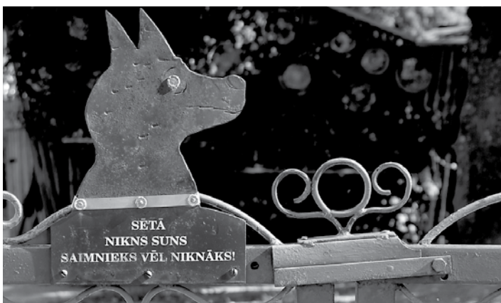
Apdomājies, pirms sper tur kāju!