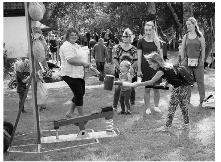
Dažādās atrakcijās un darbnīcās varēja iesaistīties gan lieli, gan mazi.