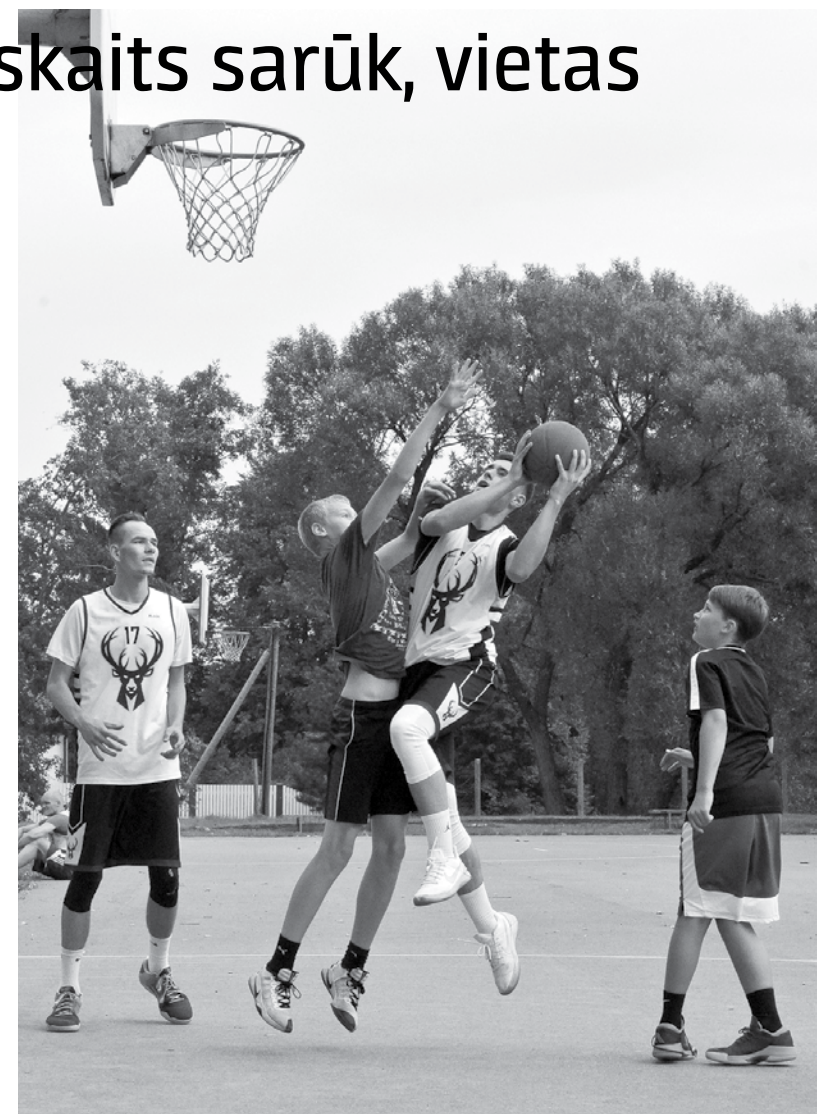
Kuldīgas novada strītbola čempionātā sacenšas Burbulis un Tēvi un dēli.