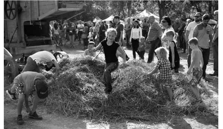
Īpašs prieks par salmu kaudzi bija svētku mazākajiem apmeklētājiem.