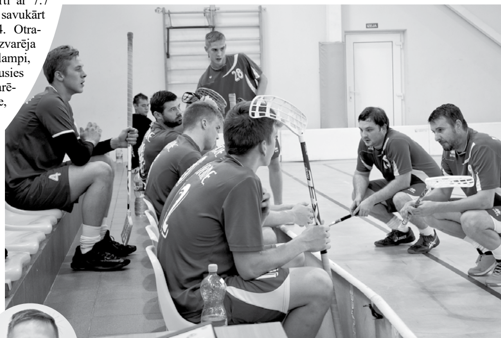
Lai gatavotos spēlēm Latvijas florbola čempionātā vīriešiem 2. līgā, Vārmes komandas dalībnieki piektdienas vakaros pagasta sporta hallē uz treniņu atbrauc no malu malām.