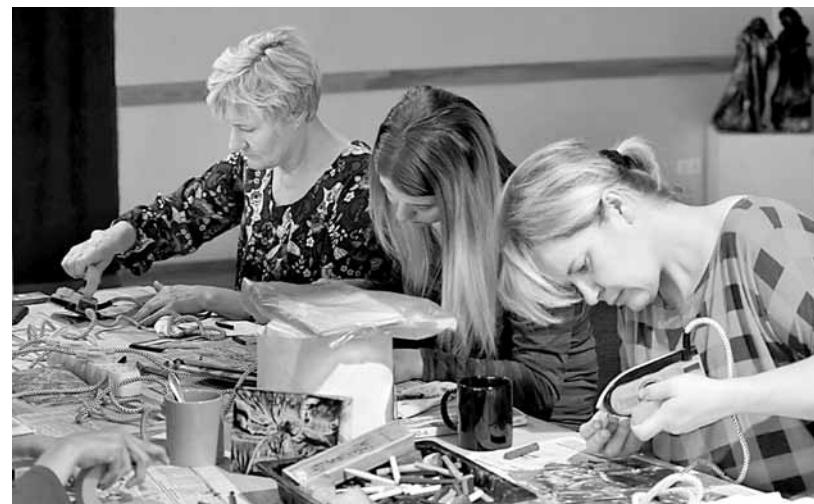
Radošās darbnīcās dalībnieces izgatavo mākslas darbu enkaustikas stilā.