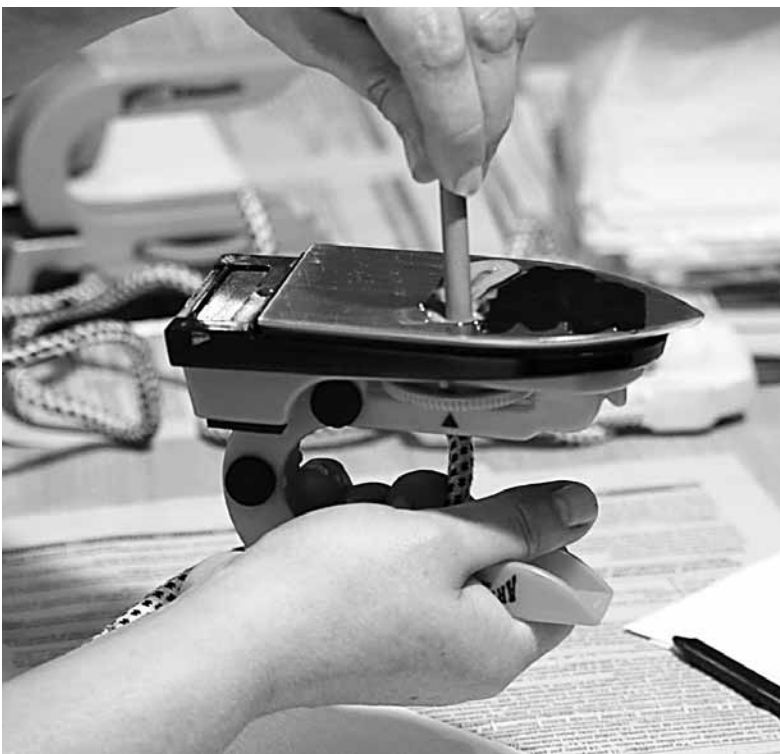
Enkaustika ir gleznošana ar vaska kritiņiem un speciālu gludekli.