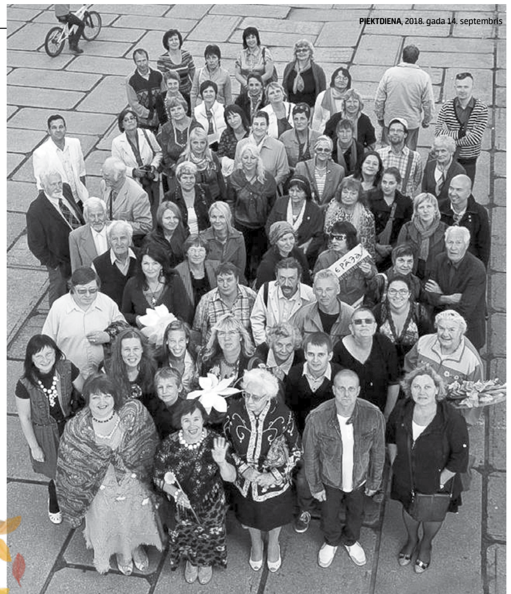
Pirms pieciem gadiem kurzemnieki savās Dzejas dienās pulcējās Talsos, šogad Kuldīga rīkotāju stafeti atkal nodos talsiniekiem.