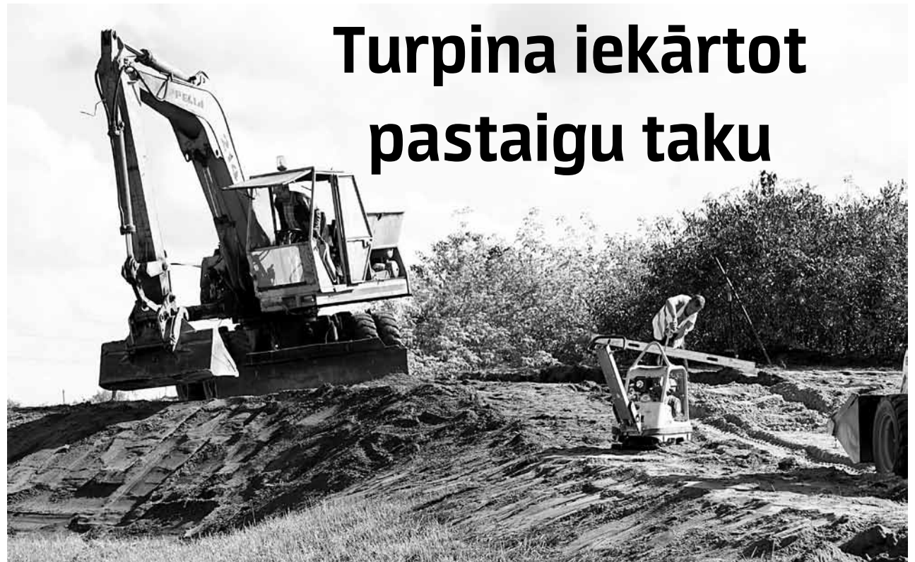
Skrundā turpinās Ventas kalna labiekārtošana – top jauni celiņi. Objekts uzticēts Aizputes uzņēmumam AD būve.

Jolanta Hercenberga, Aivara Vētrāja foto