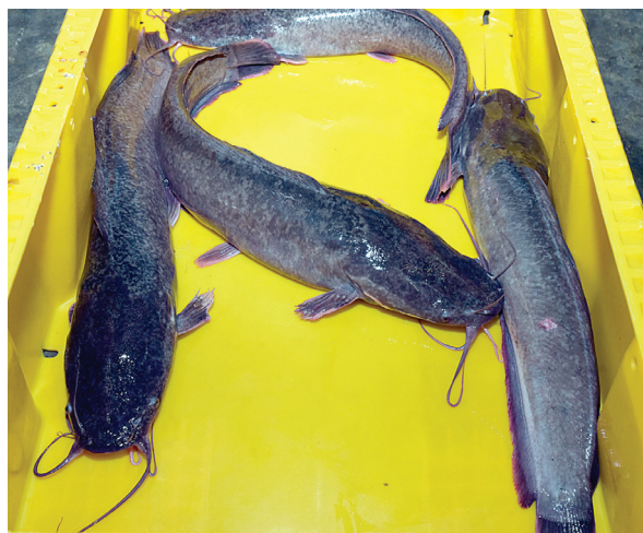
Samiem ir astoņas ūsas, un tie esot ļoti dzīvīgi. Šie jau ir ceļā uz restorāna virtuvi.

Saldūdens zivju audzēšanas komplekss Kolumbija Liepājā, viens no modernākajiem Baltijā, audzē varavīksnes foreles, stores un Āfrikas samus.