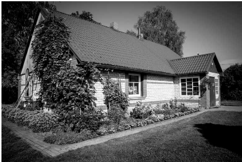
Lai māja iegūtu pašreizējo izskatu, remonts ildzis aptuveni 15 gadus. Apkārtnes iekopšanā ainavisti padomu nav devuši – kā pratusi, tā iekopusi, atzīst saimniece.