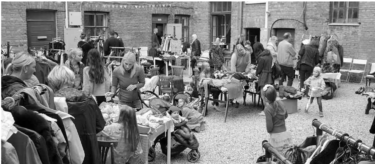
Kuldīgas kafējnīcas Staburadze pagalmā Rudens andelē ģimenes ar bērniem varēja iegādāties drēbes, apavus un rotaļlietas, kas gatavas sākt jaunu dzīvi citās mājās.