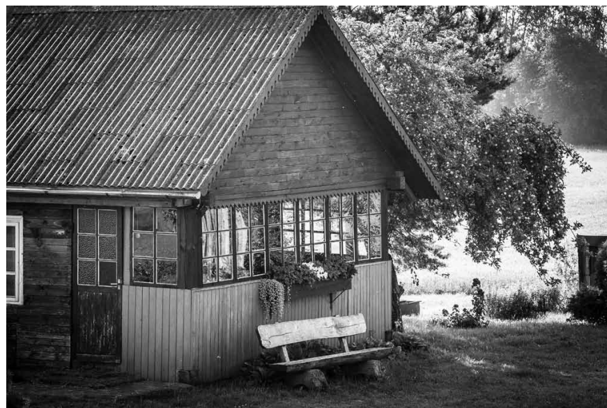
Laukos pirtiņa noteikti vajadzīga, jo tā ir mājas svētnīca, uzskata saimnieks.