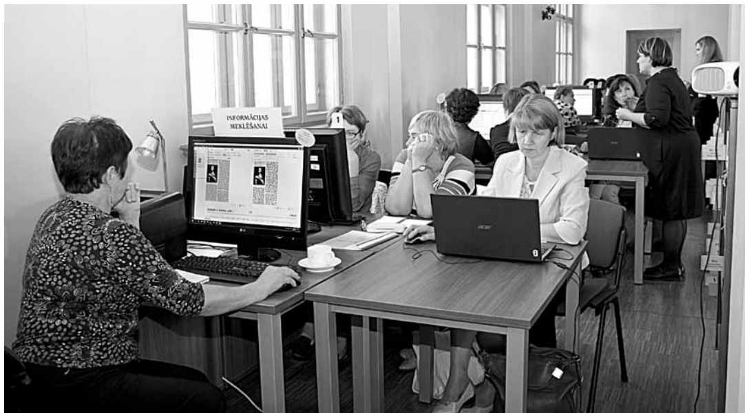
Kuldīgā – Latvijas bibliotekāru konference par novadpētniecību. Otrā diena bija paredzēta darbam četrās sesijās ar praktiskām nodarbēm.

Ikgadējā bibliotēku novadpētniecības konference šoreiz Kuldīgā divas dienas pulcēja 80 speciālistu no visas valsts, jo šajā nozarē mūsu bibliotekāri uzkrājuši lielu pieredzi un valstī ir vieni no labākajiem.