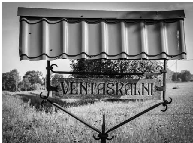
Ventaskalnu nosaukums izskaidro nama atrašanās vietu.