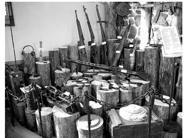
Pretošanās kustības muzeja atjaunotajā klētī Rendā ir vietējo iedzīvotāju nodotās laika liecības.