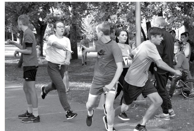
Stafetes skrējienā – Kuldīgas Centra vidusskolas un Kables pamatskolas komandu dalībnieki.