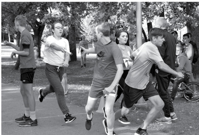
Stafetes skrējienā – Kuldīgas Centra vidusskolas un Kabiles pamatskolas komandu dalībnieki.