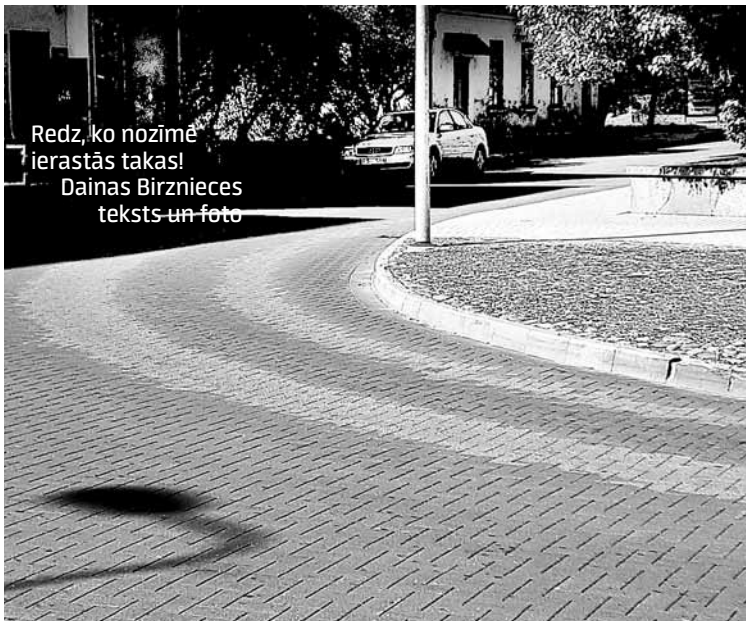
Redz, ko nozīmē ierastās takas! Dainas Birznieces teksts un foto