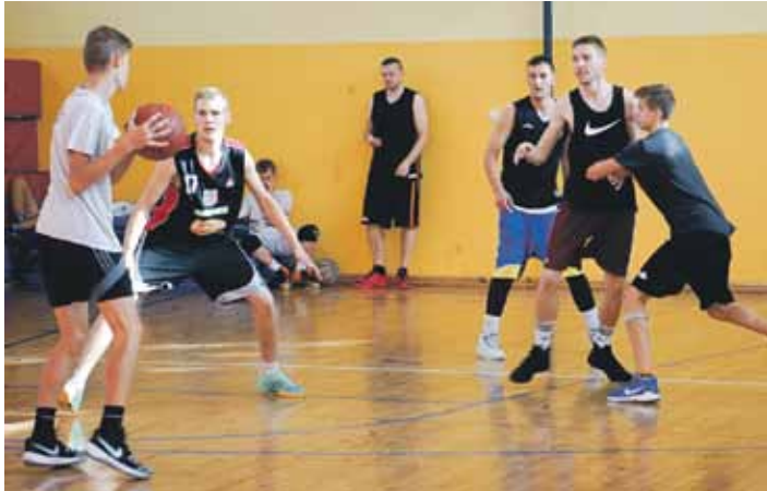
Atvasaras strītbolā Skrundā sacenšas astoņas komandas.

Vienlaikus ar Spēka dienu Skrundā atvasaras strītbola sacīkstēs sporta zālē ieradās astoņas komandas ne tikai no tuvējās apkārtnes, bet arī Liepājas un Kalvenes.