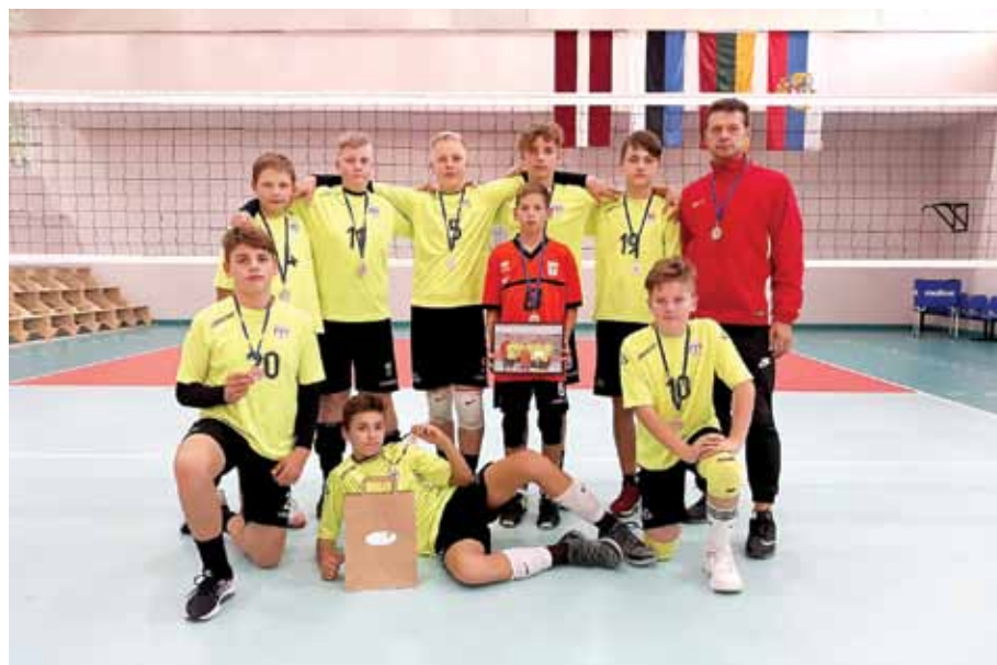
Starptautiskajā volejbola turnīrā Rīgā, Kuldīgas novada sporta skolas U-15 grupas komanda izcīnīja 2. vietu.

Kuldīgas novada sporta skolas U-13 grupas meitenes izcīnīja otro vietu volejbola turnīrā Cēsu kauss, bet U-15 grupas zēni bija otrie starptautiskajā turnīrā Rīgā.