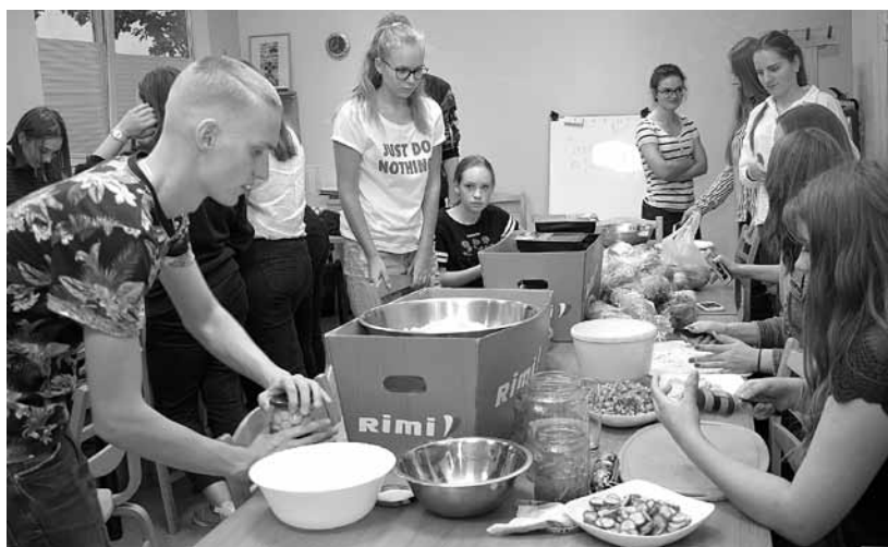
Pavadīt aizraujošu nakti Kuldīgas Centra vidusskolā uzaicināti audzēkņi no vairāku skolu līdzpārvaldēm. Top kopīgas vakariņas.