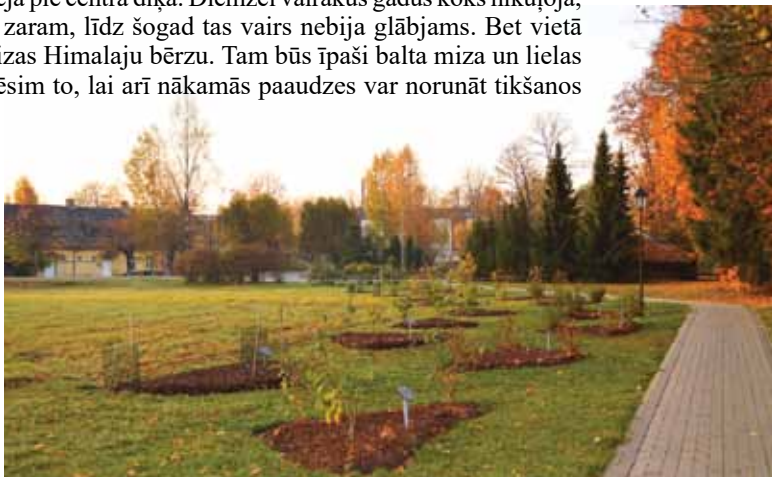
Celiņu pie autobusu pieturas tagad izdaiļo ceriņu dārzs.