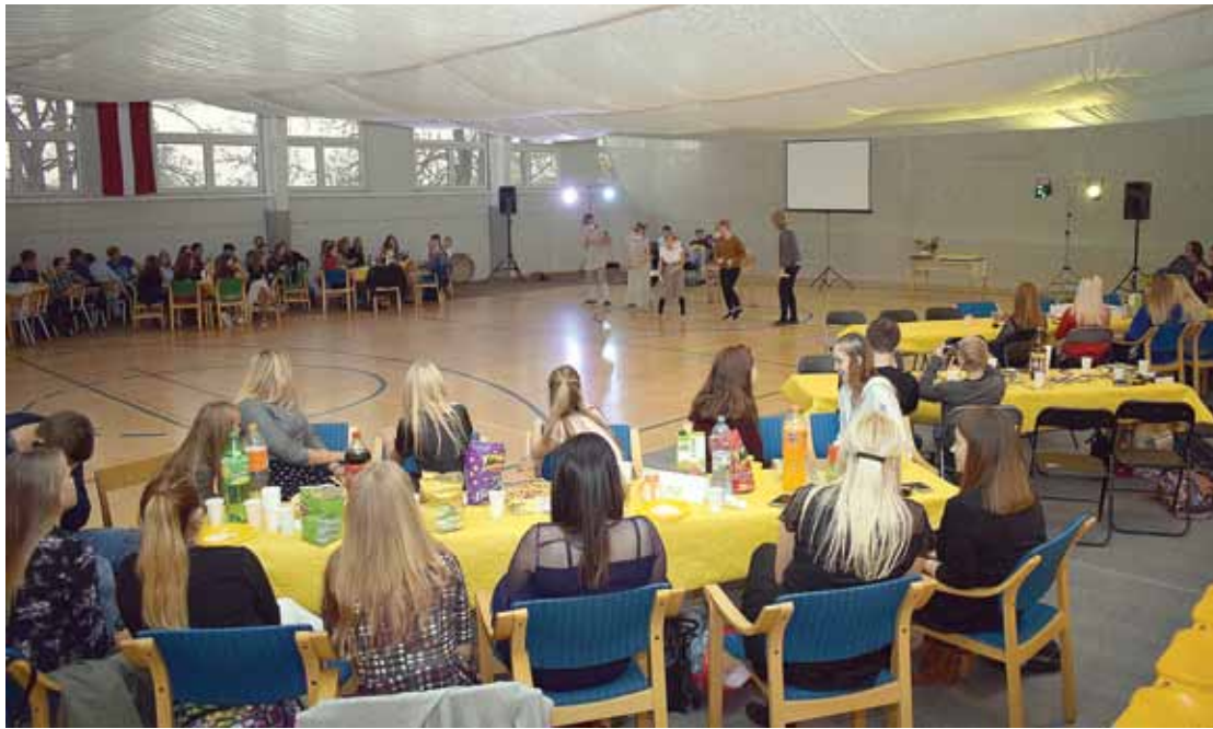
Vārmes jauniešu centru tā desmitgadē ar priekšnesumiem sveikt ieradās jaunieši no dažādām vietām: Padures (attēlā), Turlavas, Kuldīgas, Talsiem u.c.

Gadu gaitā starp vadītāju un jauniešiem izveidojusies laba sadarbība, abpusēji piedāvājot