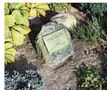
Pašvaldības apbalvojuma zīme jau atradusi vietu puķu dobē.

Konkursam mūs laikam pieteica pagasta pārvaldes vadītāja. Komisijai vajadzēja sakoptākās