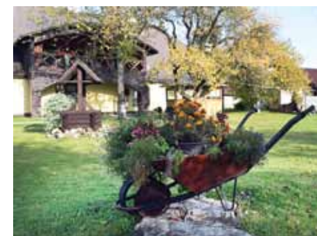
Zelmeņu vecā ķerra ieguvusi jaunu lietojumu.