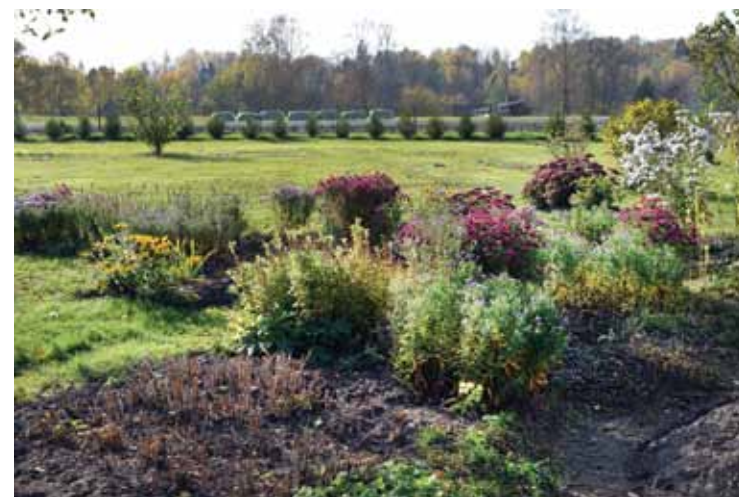
Viļņos vēl aizvien ir krāšņi ziedi.

mazām sāku veidot apstādījumus. Gadu no gada radu jaunus. Ar to stādīšanu man ir tā: ieraugu akcijā tūjas un nevaru pāriet garām. Arī izbraukumos nevaru pabraukt garām stādaudzētavām. Jau bērnībā, kad mamma rušinājās pa puķu dobēm, mēs ar tēti un brāli palīdzējām, jo patika pret dārza