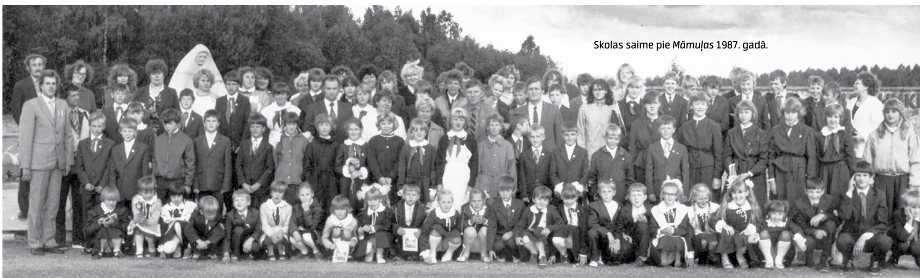
Skolas saime pie Māmuļas 1987. gadā.