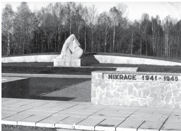
Piemineklis Pieti 2. pasaules karā kritušajiem. Tēlniece – Līvija Rezevska.