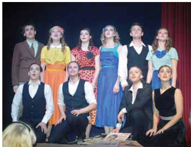
Jaunie aktieri no Maskavas ne tikai dejo, bet arī dzied.