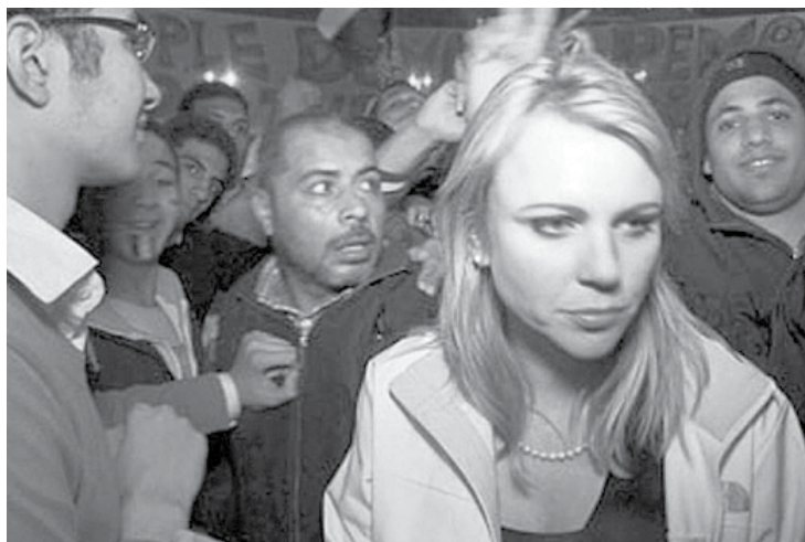
Mīms, kas tika izmantots ilustrācijai par Jaungada sagaidīšanas laikā notikušajām izvarošanām Ķelnē.

Mēdz izmantot arī tā sauktos mīmus, konstruējot attēlus, lai pievērstu uzmanību kādam notikumam, pret kuru foto pārveidotājs iestājas. Piemēram, lai pierādītu, ka Vācijas imigrā-