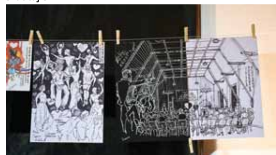
Ķīnas mākslinieces Mērijas Ženkas skice tapusi izrādes Taņas dzimšanas diena laikā.