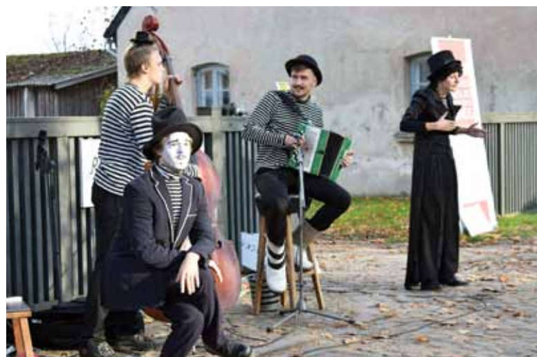
Četri mākslinieki bez vārdiem spēja prieku radīt gan lieliem, gan maziem skatītājiem.

Šeit – ieskats dažās norisēs. Vairāk foto: www.kurzemnieks.lv , www.tivk.lv , Kurzemnieka un festivāla rīkotāju feisbuka kontā.