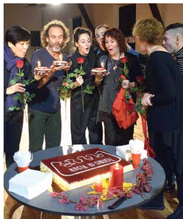
Festivāla viesi, aicināti nopūst trešās dzimšanas dienas svečītes, iedomājās vēlēšanos. Varēja noprast, ka tā ir Kuldīgā atgriezies.

Divās dienās ar trim izrādēm ielās garāmgājējus aizrāva četri mākslinieki – mūziķi, cirka un teātra darbinieki no Sanktpēterburgas. Ar projektu Circo Baffo izbraukāta visa Eiropa, bet visilgākā uzstāšanās bijusi Latvijā. Kā nonākuši šeit? „Rīgā viena izrāde bija pie Rīgas krievu teātra. No tā pienāca viens cilvēks un piedāvāja uzstāties arī Kuldīgā. Esam priecīgi, ka priekšlikumu nenoraidījām. Kuldīga ir tik mājīga, it kā būtu no citas pasaules: klusa, jauka, brīnumaina. Mūsu pēdējā uzstāšanās pie kultūras centra pēc izrādes Graņonka bija dāvana Kuldīgai, lai teātra gars un burvestība paliek tās ielās.” Kā skatītāji latvieši esot nevis noslēgti, bet kautrīgi. „Ir ļoti interesanti sadarbīties ar garāmgājējiem. Kad uzstājamiem Pilsētas dārzā, varēja redzēt, ka visi ir performancei atvērti, tikai kautrējās piedalīties.”