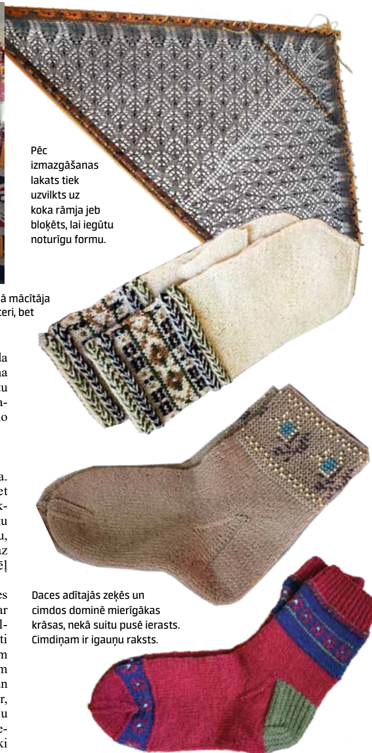
Pēc izmazgāšanas lakats tiek uzvilts uz koka rāmja jeb bloķēts, lai iegūtu noturīgu formu.