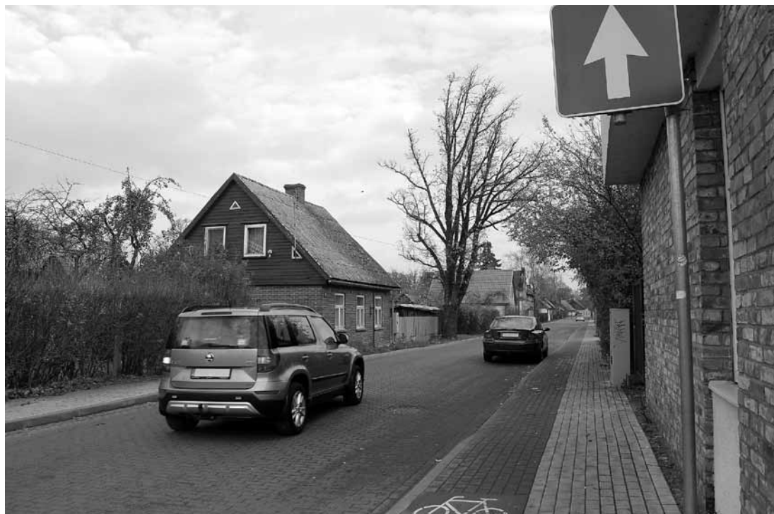
Vai Grants ielā autobraucēji brauks lēnāk, uzliekot zīmi, ka ātrums ir 30 km/h?