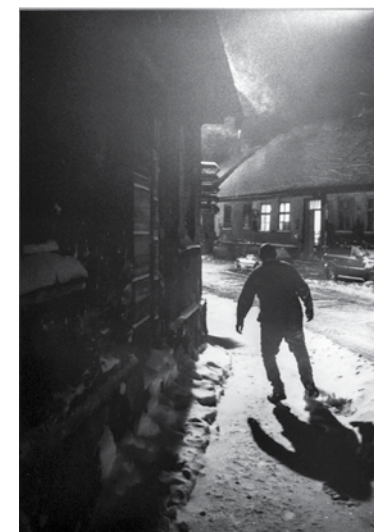
Kluba Liepājas pozitīvs simpātiju balva.