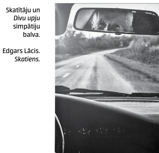
Skatītāju un Divu upju simpātiju balva.