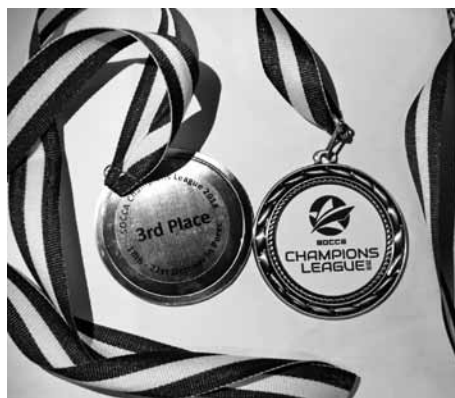
Starptautiskās Minifutbola federācijas Čempionu līgas turnīrā 6x6 bronzas medaļa.