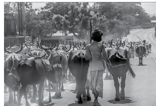
3. VIETA. ARTIS GUSTOVSKIS. INDIA.

L. Šmite: „Braucām ceļojumā pa Itāliju. Lai nofotografētu šo bildi, izbāzu roku ar fotoaparātu pa logu. Diezgan riskanti bija, jo aparāts karājās virs aizās.”