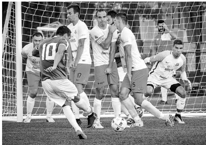
Nikers spēles brīdī, sargājot vārtus.

tienu nevienā pozīcijā. Jaunie labi cīnījās. Z.D.: – Skatoties no malas, Nikera spēlē daudz jauniešu, bijām vienā no jaunākajām komandām. Preī nāca vienības no kalnainām valstīm – vīri ar lielām bārdām. A.Š.: – Izņemot divus, pārējie spēlētāji iesita pa vienam, pa diviem goliem . Komandā viens otru papildināja. Minat, ka spēle visa koman-