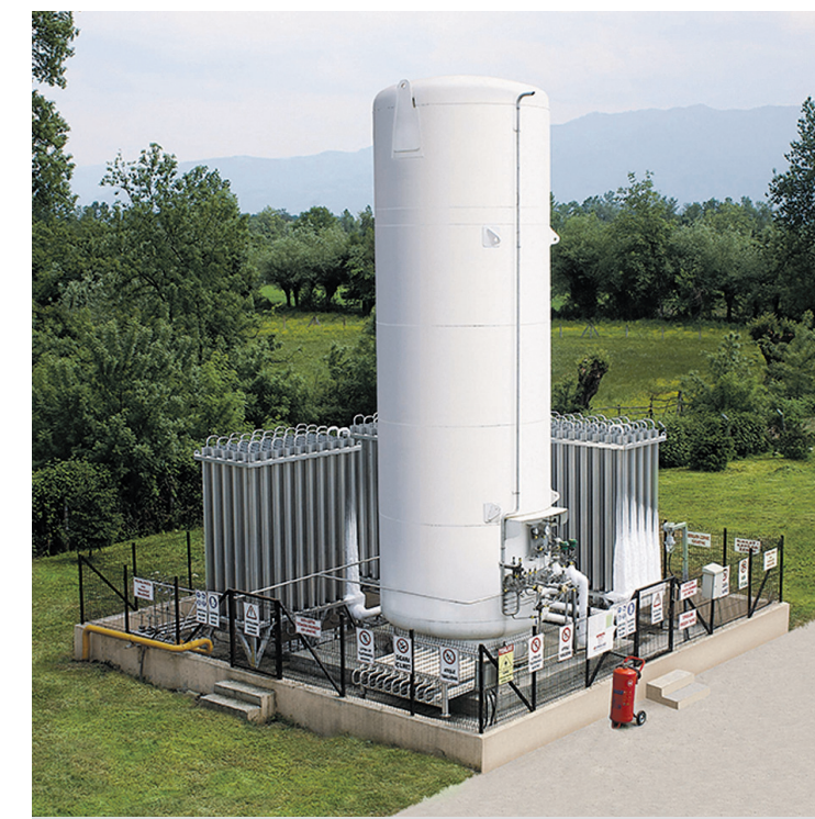
Lai uzzinātu vairāk par šo dabasgāzes piedāvājumu, aicinām sazināties ar Enefit speciālistiem, rakstot e-pastā: info@enefit.lv vai zvanot pa tālr. 67780590, kā arī apskatīt mājaslapu www.enefit.lv .