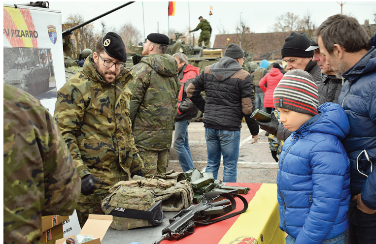
Rīta pusē Pilsētas laukumā Kuldīgā varēja apskatīt militāro ekipējumu un tehniku.