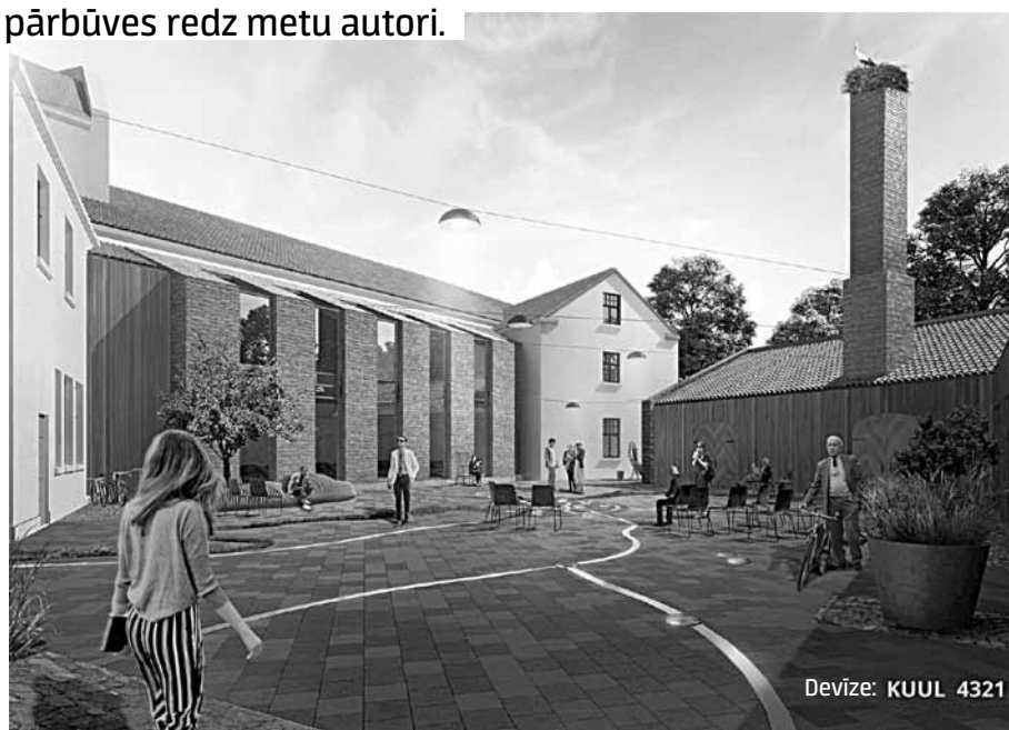
Devīze: KUUL 4321