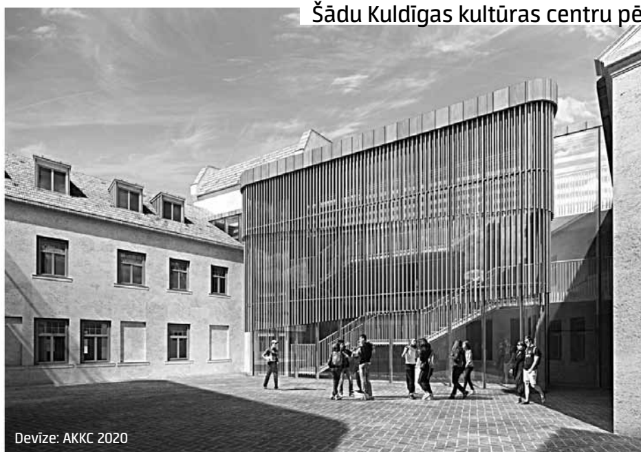
Devīze: AKKC 2020

Šādu Kuldīgas kultūras centru pēc pārbūves redzētu autori.