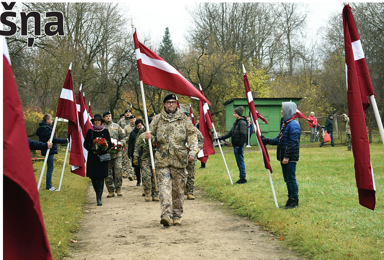
Lāčplēša dienas svinības Kuldīgā beidzās ar Valsts akadēmiskā kora Latvija koncertu Sv. Annas baznīcā.