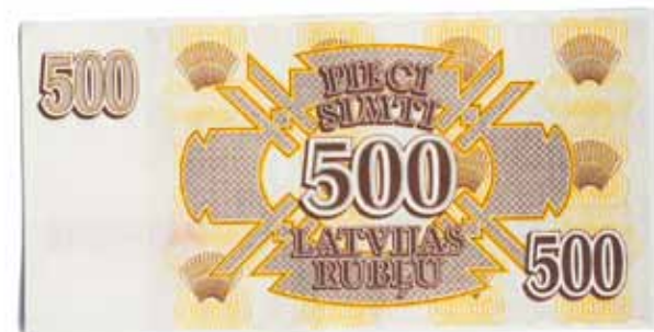
500 Latvijas rubļu jeb repsīšu.