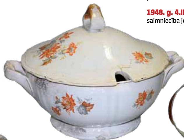
Kuzņecova porcelāna fabrikas terīne – Latvijas pirmās brīvvalsts labklājības simbols.