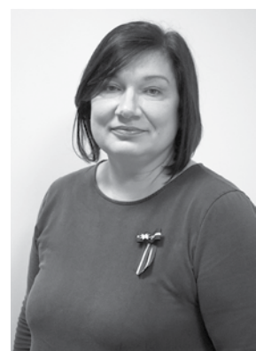
Antras Grinbergas foto