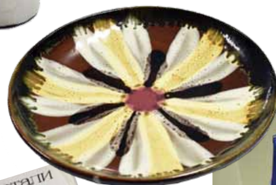
Šādi šķivji 70. gados pie sienas bija gandrīz katrā dzīvoklī.