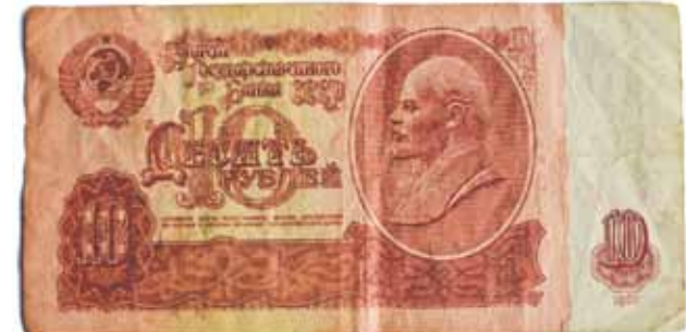
10 rubļu pēc naudas reformas 1961. gadā.

Viens rublis, kas nonāca apgrozībā pēc 1947. gada reformas.