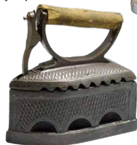
Ar šādu pletizeri latviešu saimnieces drēbes gludināja vēl 20. gs. pirmajā pusē.

1928. g. – nodota jaunā Kuldīgas vācu ģimnāzija Pētera ielā 5.