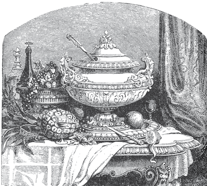
Ilustrācijas no grāmatas Minjonas pavārniecības māksla

Cūkas fileju izspeķo ar īsti labu svaigu vai žāvētu speķi un tad uzspiež tam virsū kāda citrona sulu, uzlej pāra glāzes Madeiras vīna, pieliek piparus, virces gabaliņus un kādas neļķītes (krustnagliņas). Atstāj fileju šajā marīnādē apm. 24 stundas, bieži apgrozot, tad liek ar visu marīnādi krāsnī cept, turklāt fileju kādas reizes pārsmērē ar krējumu. Kad filejs gatavs, liek to uz garenas blodas virs rīsa paaugstinājuma, garnē apkārt ar kartupeļu un šampinjonu pīrē kaudzītēm, pētersīļzariņiem un artišokiem. Zosti, kas pannā palikusi, savāra, pieliekot vēl krējumu un citronu sulu, un pasniedz īpašā traukā.