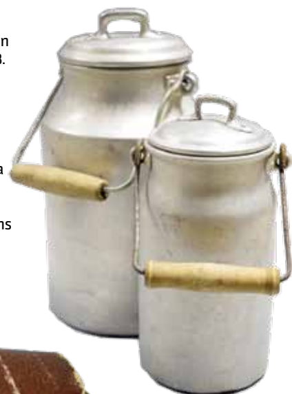
Alumīnija kanniņas – ļoti ērtas gan ogu lasīšanai, gan pienam.

1958. g. – bijušajā ebreju sinagogā sāk darboties kinoteātris Kurzeme .