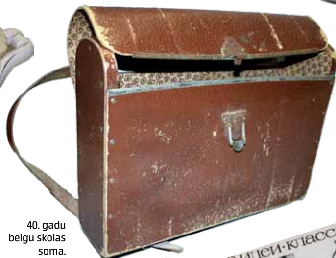
40. gadu beigu skolas soma.