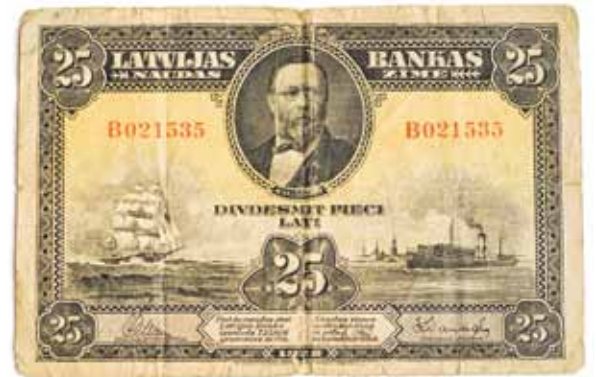
25 lati (1928. gads).

Otrā pasaules kara laika vācu nauda, kas lietota okupācijas apgabalos, tai skaitā Latvijā. 20 reihsmarkas. Kara laikā apgrozībā bijuši arī PSRS rubļi, ko mainīja pēc kursa 10 rubļu pret vienu reihsmarku.