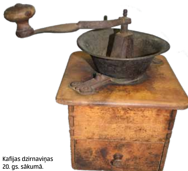
Kafijas dzirnaviņas 20. gs. sākumā.