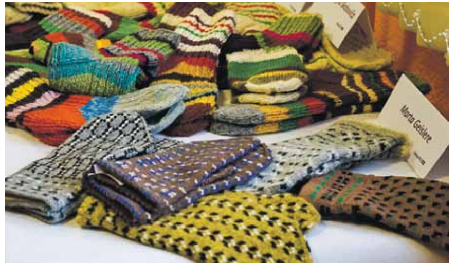
Skrundas novada rokdarbnieces savos darinājumos izmantojušas krāsainus rakstus.

Skrundas bibliotēkā līdz novembra beigām izstādē Rakstu raksti simtgadei redzami novada rokdarbnieču cimdi un zeķes.