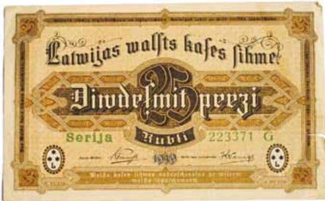
Latvijas Valsts kases zīme – 25 rubļi (1919. gads).

Latvijas maiņas zīme piecu kapeiku vērtībā, kas bija apgrozībā no 1919. līdz 1922. gadam. Metu veidojis ievērojamais naudaszīmju dizainers Rihards Zariņš.