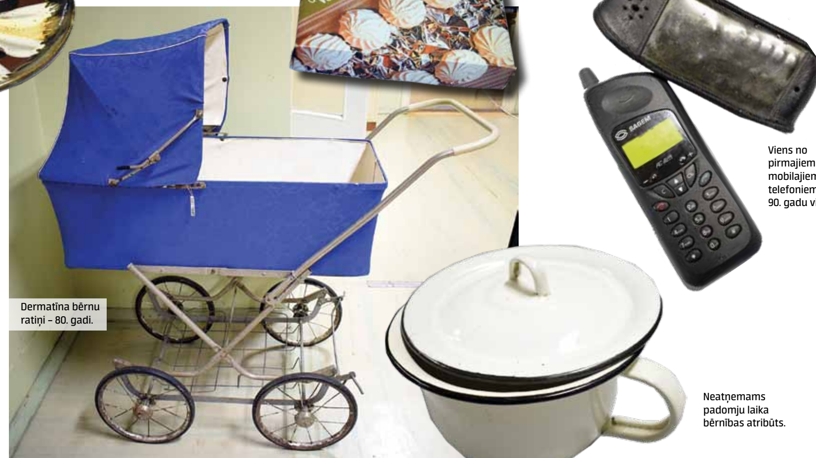
Dermatīna bērnu ratiņi – 80. gadi.

2018. g. 20.II – parakstīta vienošanās par projektu Jēkaba ceļa kultūras mantojuma un mākslas jaunrades magnēti – Kuldīgā, Kalpaka ielā 4, plānots veidot radošo klasteri.