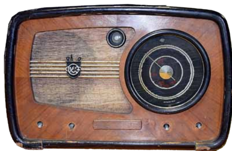
Rigas Valsts elektriskās fabrikas (VEF) radioaparāts. 30. gadi.