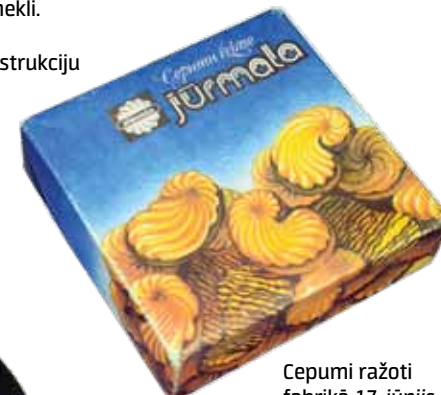
Cepumi ražoti fabrikā 17. jūnijā.

1978. g. – Kuldīgā izveidota bērnu mākslas skola.