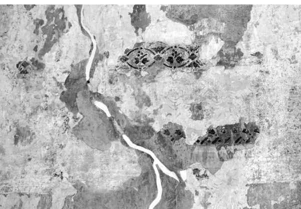
Uz sienām ir vairāk nekā desmit krāsas slāņi. Daži atsegti, lai tos parādītu.