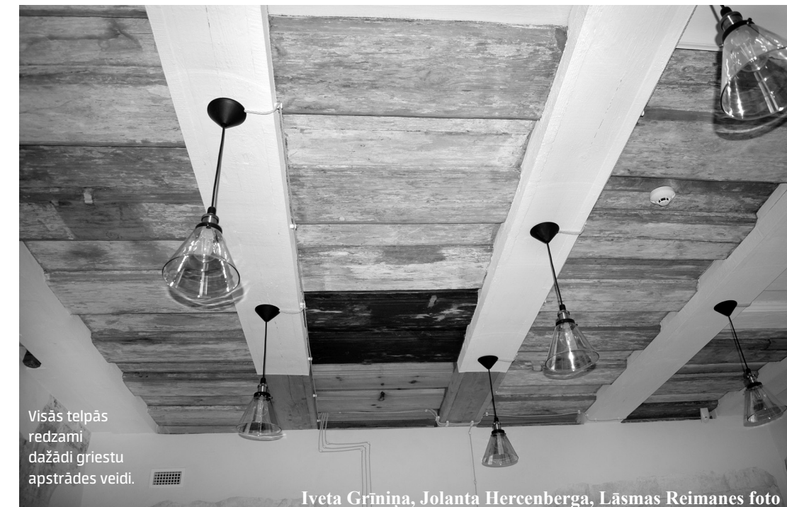
Visās telpās redzami dažādi griestu apstrādes veidi.