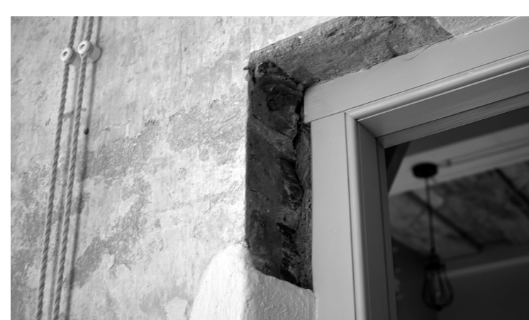
Drīvējums starp durvju aplodu un mūri ir līna pakulu un gīpša sajaukums.

Iedzīvotāji, kuri piedalījušies logu restaurācijas akcijās, jaunās telpas var apskatīt rīt, 22. novembrī , 17.00–19.00, pārējie – atvērto durvju dienā 1. decembrī no 12.00 līdz 16.00.