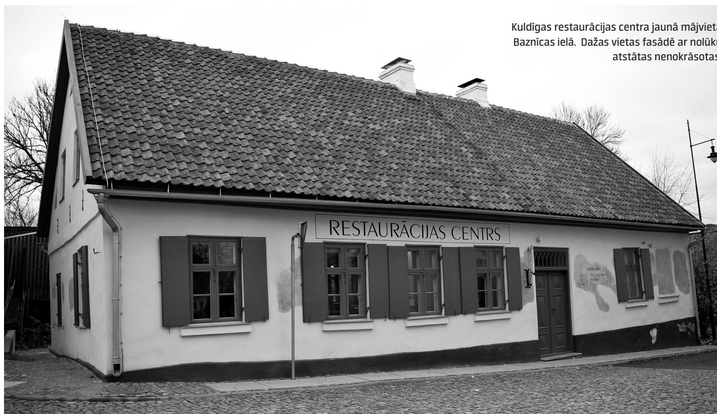
Kuldīgas restaurācijas centra jaunā mājvieta Baznīcas ielā. Dažas vietas fasādē ar nolūku atstātas nenokrāsotas.