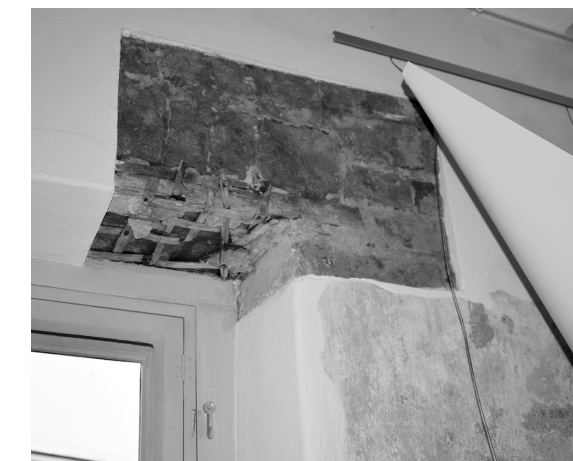
Loga pārsedes daļā atsegti mūris un skaliņu siets, kas stiprināts pie koka pārsedes un nodrošina to, lai apmetuma java nekristu nost.