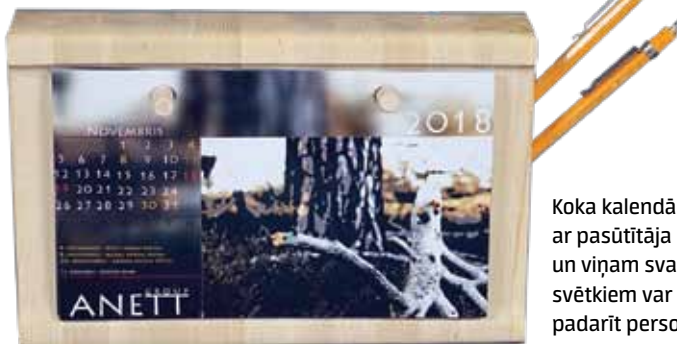
Koka kalendārs, ko ar pasūtītāja bildēm un viņam svarīgiem svētkiem var padarīt personisku.