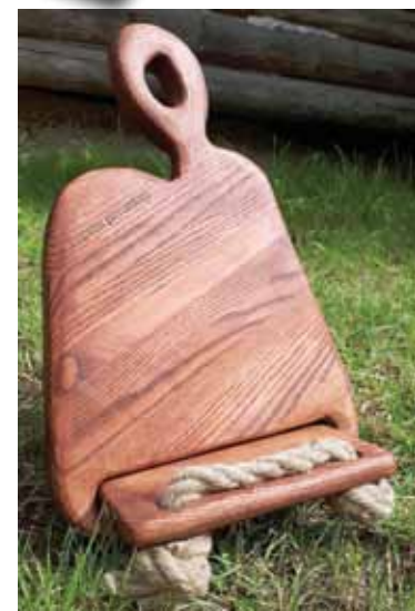
Labs palīgs saimniecēm virtuvē ir receptu grāmatu un planšetdatoru turētājs.

jaunu tehniku lampu kupoliem – samaltu kartonu sajaukt ar krāsu un cementu.”