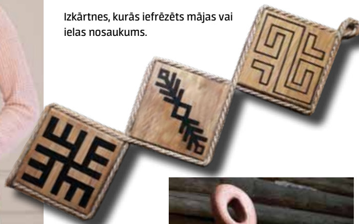
Zīmju rakstus Anete iedezinājusi ar rokām.