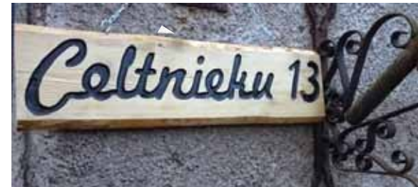
Izkārtne, kurās iefrēzēts mājas vai ielas nosaukums.