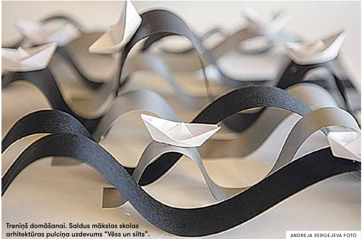
Treniņš domāšanai. Saldus mākslas skolas arhitektūras pulciņa uzdevums "Vēss un silts".

Bērni būvējuši pilsētu, pieturas, māju uz riteniem, savu