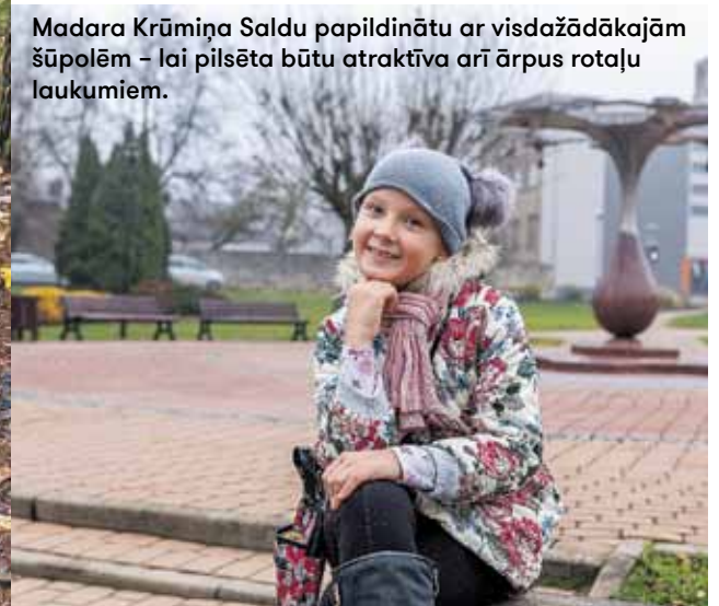
Madara Krūmiņa Saldū papildinātu ar visdažādākajām šūpolēm – lai pilsēta būtu atraktīva arī ārpus rotaļu laukumiem.