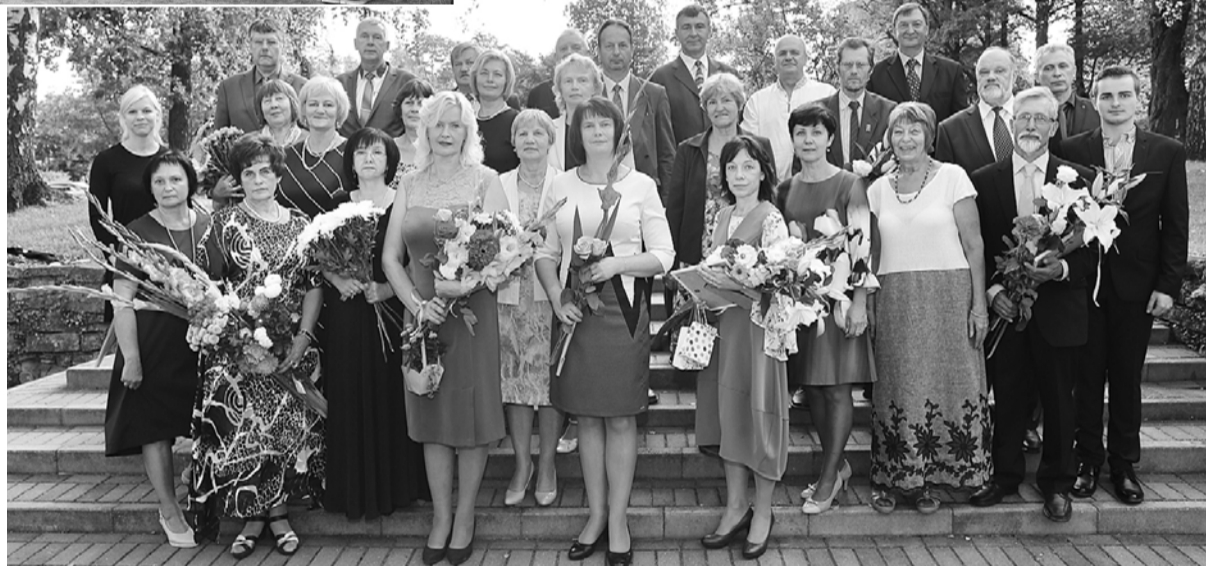
Smiltenes tehnikuma pedagogu un darbinieku kolektīvs.

Priecājos, ka Smiltenes tehnikuma skolotāji neskatās uz audzēkni kā no desmitā stāva uz pirmo, bet ir labi vecākie kolēģi. Tas ir svarīgi. Man ļoti patika tas, ko Smiltenes tehnikuma pasākumā uzņēmējiem,