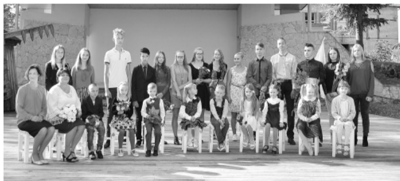
1. septembri Grundzāles pamatskolā.

skolēni no Bilskas, Blomes, Grundzāles, Palsmanes, Variņu pamatskolām un Smiltenes vidusskolas.