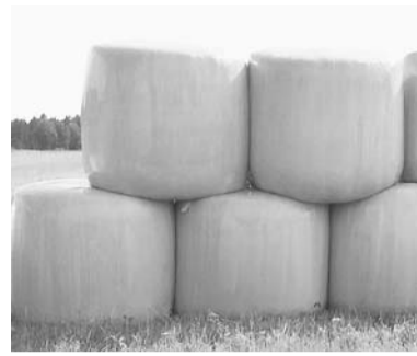
atkritumu savākšanas daļu pa tālr. 29221847.

Atgādinām, ka lauksaimniecībā izmantotā iepakojuma (ruļļu plēves, bedru plēves, Big-bag maisi, HDPE kannas) savākšanu var pieteikt visu gadu, sazinoties ar ZAAO Šķirotu